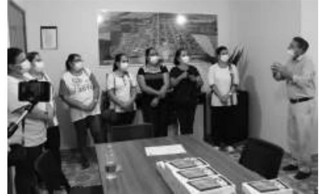
Agentes de saúde são recebidas pelo prefeito, que fez a entrega dos tablets.

saúde para utilização na coleta e compartilhamento de dados das famílias assistidas.