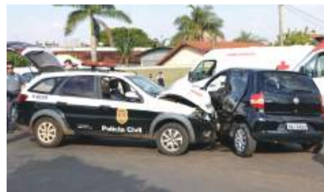
A colisão causou danos nos dois veículos.

Um motorista embriagado não respeitou a sinalização de pare na Rua Luiz Camargo e adentrou a avenida Dr. Manoel P. Fernandes no momento em que a viatura da Polícia Civil passava, causando um grave acidente. O motorista foi detido na hora. Pág. 5