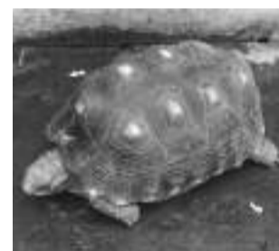
Jabuti apreendido em residência de Colina.

Um jabuti foi apreendido em Colina no dia 18 após fiscalização da Polícia Ambiental. Além da falta de documentação, o proprietário alegou desconhecer as leis ambientais. Ele foi autuado em R$ 500,00 por manter o jabuti em cativeiro sem autorização.