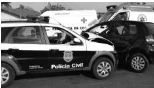
A viatura policial bateu no Fox que invadiu a avenida.

embriagado, foi submetido ao teste do bafômetro que constatou 1,5 mg/L. Ele foi preso em flagrante por infração ao artigo 306 do Código de Trânsito, arbitrada fiança de R$ 1.100,00 e o autor liberado. Os dois veículos sofreram bastantes danos e por sorte ninguém ficou ferido.