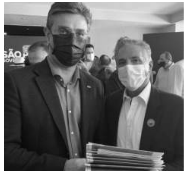
Vice-governador Rodrigo Garcia recebe do prefeito Silvinho toda documentação e estudo de engenharia para pavimentação da estrada.

"Isso permitiu que o nosso projeto saísse na frente. Outra ação primordial para o sucesso da solicitação foi o apoio da prefeita de Barretos Paula Lemos, do deputado federal Geninho Zuliani, além do governador Doria e vice Rodrigo que vislumbraram a importância da pavimentação e o impacto econômico positivo no escoamento da produção agrícola", conclui Silvinho.