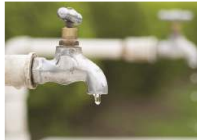
Medidas drásticas serão adotadas para coibir o desperdício d'água.