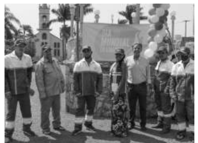
Silvinho entregou uniformes e equipamentos de proteção aos servidores que atuam na limpeza pública.

O prefeito Silvinho entregou uniformes e equipamentos de proteção individual (EPIs) para os servidores da limpeza pública utilizarem no