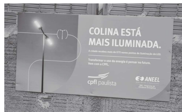
Vários banners da CPFL foram fixados em muros de residências pela cidade.

A reportagem constatou que o referido banner também estava fixado em outros endereços pela cidade. Diante da situação o Jornal relatou os fatos à CPFL e solicitou esclarecimentos que