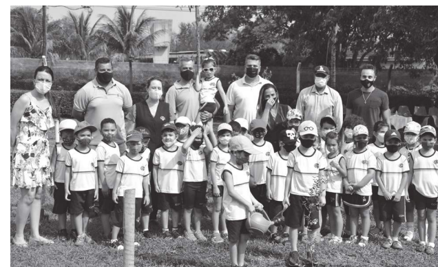
Diretores gremistas, estudantes e professores após o plantio de mudas no clube.

O Grêmio Cultural plantou diversas mudas de árvores frutíferas na área abaixo das piscinas. O plantio, com a participação dos alunos da pré-escola do Colégio Cecília Meireles, foi acompanhado pelos diretores do clube e aconteceu na tarde de terça-feira, 21, quando se comemorou o Dia da Árvore.