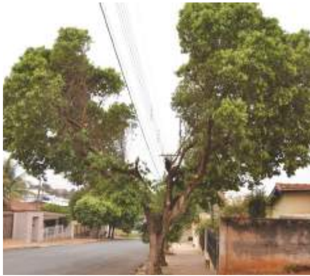
Poda irregular de árvores gera reclamação.