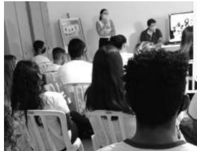
Adolescentes da Arco na oficina de apoio à campanha de prevenção ao suicídio ministrada por psicóloga.

a importância da "Valorização da Vida", que está acima de tudo.