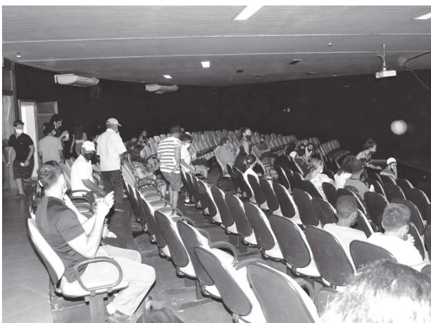
Logo após a inauguração o público começa a ocupar as poltronas para o início do filme “Viúva Negra”, com direito a pipoca e guaraná.