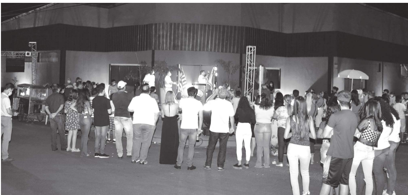
Público prestigiou solenidade inaugural e se encantou com a nova roupagem do CIEB – Centro Integrado de Educação Básica que além do cinema com anfiteatro terá, em breve, uma cafeteria permanente.

Para a instalação da sala de cinema o CIEB foi totalmente reformado pela atual administração, que também adquiriu um projetor de alta tecnologia para garantir a qualidade das sessões de cinema, que respeitam todos os protocolos sanitários contra a Covid.