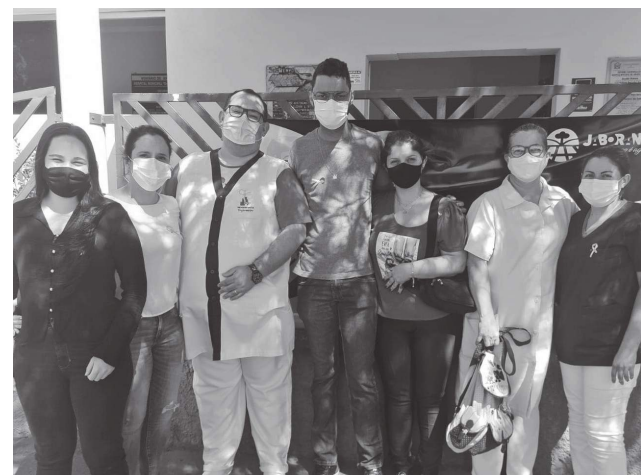
Funcionários recepcionaram os novos integrantes da equipe municipal de saúde.

tiraram dúvidas e percorreram as Unidades de Saúde do município.