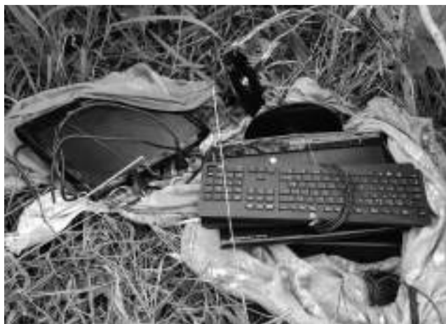
Computadores furtados de escola da Nova Colina estavam escondidos em mata.