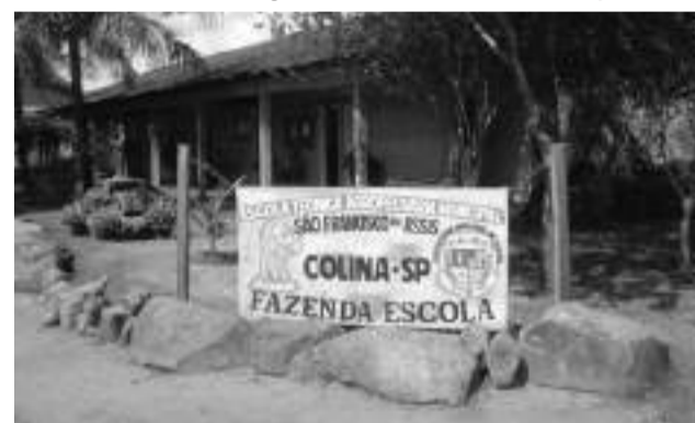
Vestibulinho da ETAM será realizado em cinco escolas municipais onde os inscritos estudam.

Os inscritos devem chegar aos locais de prova com antecedência de 15 minutos antes do fechamento dos portões.