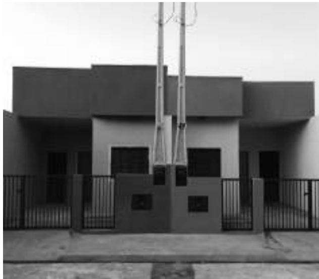
Unidades habitacionais que serão entregues à famílias carentes em dezembro.

A prefeitura também fará a entrega de duas novas unidades habitacionais de aproximadamente 55 m2 cada construídas com recursos municipais, beneficiando famílias carentes. O 1º Censo Municipal, realizado no início da atual administração, detectou 19 famílias residindo em habitações precárias e em situação de vulne-