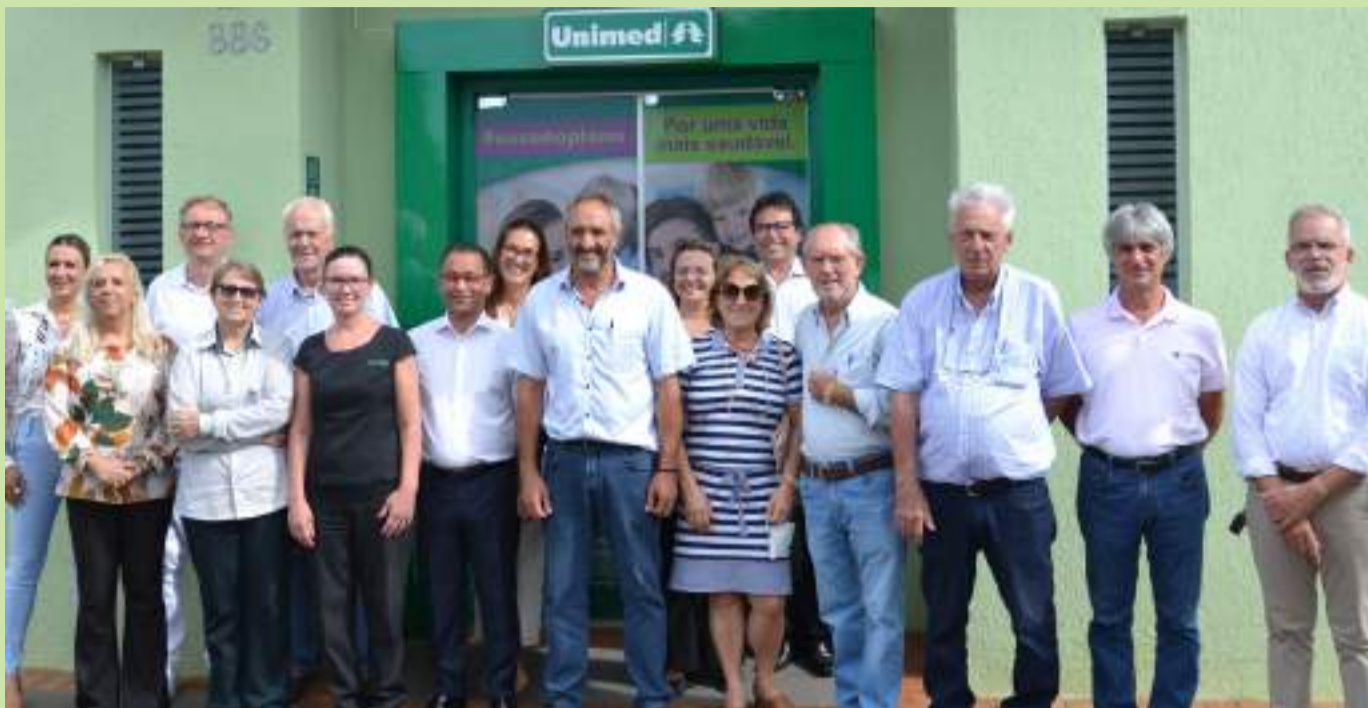
Membros da diretoria executiva da Unimed/Barretos, médicos cooperados de Colina, prefeito colinense, colaboradores e convidados em frente ao novo escritório e ambulatório recém-inaugurado da Unimed.

O novo telefone da Unimed Colina é 3612-1580 .