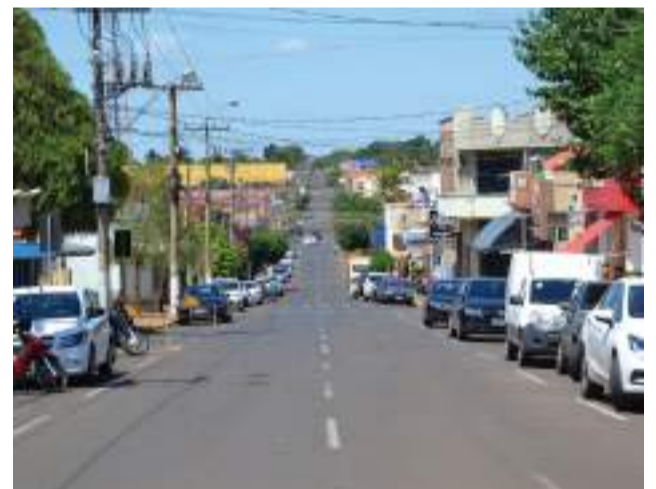
Município tem previsão de orçamento de R$ 116 milhões para o próximo ano.