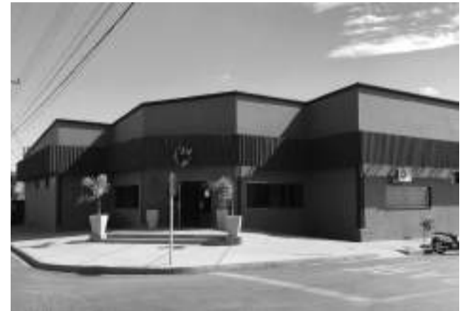
A estrutura do Cieb abrigará o polo da Univesp em Jaborandi.

recente, apresentado no Fórum Mundial, indica que até 65% das funções e profissões atuais desaparecerão ou serão trocadas por outras no período de formação dos alunos que ingressam no ensino infantil”.