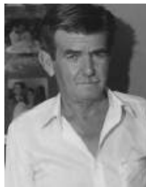
A contribuição do maestro à música foi imprescindível.

Daher “Tô”. Por mais de 20 anos conduziu a corporação musical como