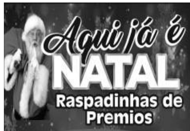
Banner da campanha da ACIC.

“Todos os consumidores, ganhadores ou não da raspadinha, devem preencher o verso e depositá-la nas urnas espalhadas no comércio e na ACIC para concorrer ao sorteio de duas bicicletas