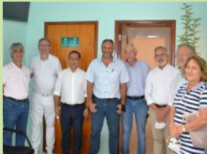
Diretoria, autoridades e convidados durante a solenidade inaugural.