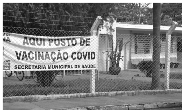
Desde de dezembro o antigo posto de saúde é o local de vacinação contra Covid no município.