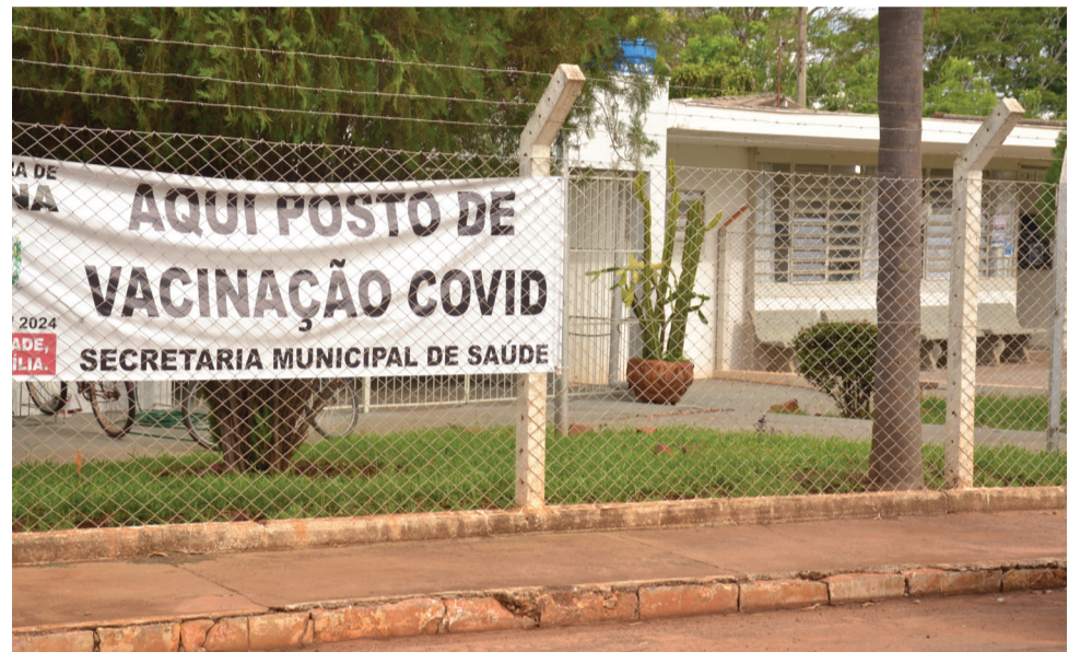
O antigo Posto de Saúde é o novo local para vacinação contra Covid.