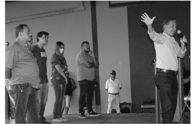
No discurso de inauguração o prefeito ressaltou a importância do novo almoxarifado na prestação de serviços à população.