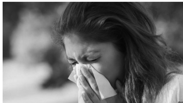
O surto de gripe tem infectado muitas pessoas.

As festas, eventos e competições esportivas coletivas somente poderão ser realizadas mediante prévia autorização da prefeitura mediante apresentação do pedido e documentação necessária no Departamento da Receita, com antecedência mínima de 10 dias antes do evento. Após análise a documentação será enviada a Vigilância Sanitária para as providências cabíveis. O decreto ressalta que é dever de todo cidadão submeter-se à vacinação obrigatória, assim como os menores sob a sua guarda ou responsabilidade.