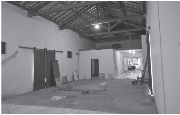
Mesmo com as obras de reforma o Museu permanece aberto à visitação.