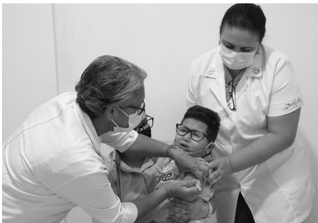
Criança é imunizada contra a Covid na UBS da Vila Fabri, posto de vacinação infantil.

A Secretaria de Saúde divulgou o cronograma de vacinação infantil contra a Covid que é realizada apenas na UBS da Vila Fabri, das 13 às 16h30. A campanha teve início na última quinta-feira, 20, com a imunização de crianças de 6 a 11 anos com comorbidades e necessidades especiais, que continua sendo feita para este grupo.