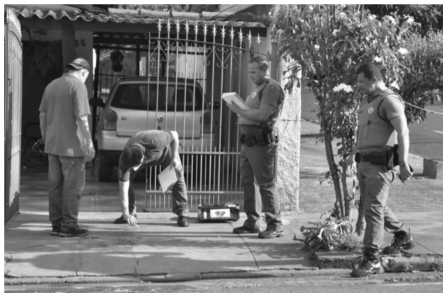
Fotógrafo, perito e policiais militares onde a vítima foi alvejada por vários disparos. Os cartuchos vazios ficaram espalhados pela calçada.

Segundo informações da polícia, a vítima estava mudando-se para uma casa na Rua 13 de Maio quando foi surpreendido por uma moto com dois indivíduos atirando