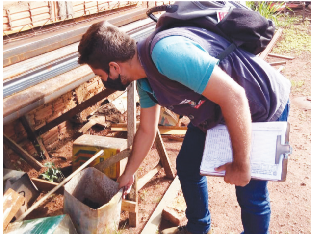
Equipe da Vigilância Epidemiológica intensifica intervenções para eliminar o mosquito transmissor da dengue.

Até o momento não existe caso positivo da doença. O período de chuvas é propício para a proliferação do Aedes aegypti . Pág. 6