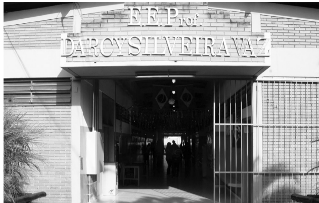
O ano letivo na única escola estadual do município, que passa a ser de ensino integral, começa no dia 2.

“o professor tutor (tutoria) é uma metodologia da Escola de Tempo Integral onde o aluno escolhe um professor para ser seu tutor, que vai acompanhá-lo. É um processo de evolução individualizada em que é desenvolvida uma relação mais próxima do aluno com o professor (mentor)”.