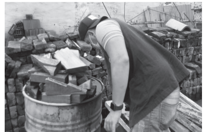
Os agentes de controle de vetores têm vistoriado residências e locais públicos para eliminação de criadouros do mosquito.

que as pessoas que apresentarem sintomas da doença, como: febre alta associada à dor de cabeça, prostração, dores musculares nas juntas, atrás dos olhos, vermelhidão pelo corpo e coceira devem, imediatamente, procurar uma unidade de saúde e notificar a vigilância, para que todos os protocolos de combate sejam adotados.