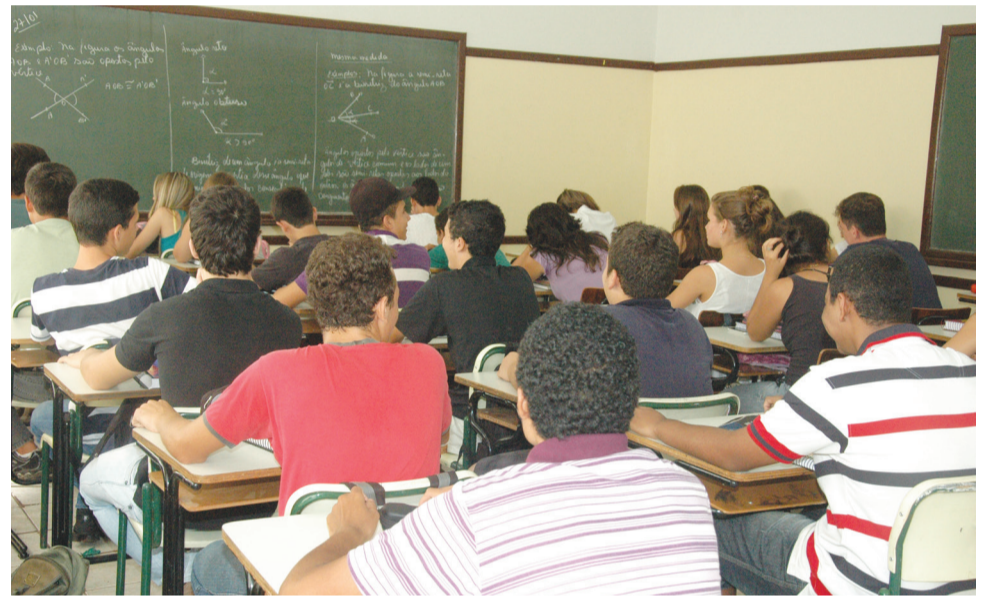
Estudantes da “Darcy” ficarão 9 horas por dia na escola.