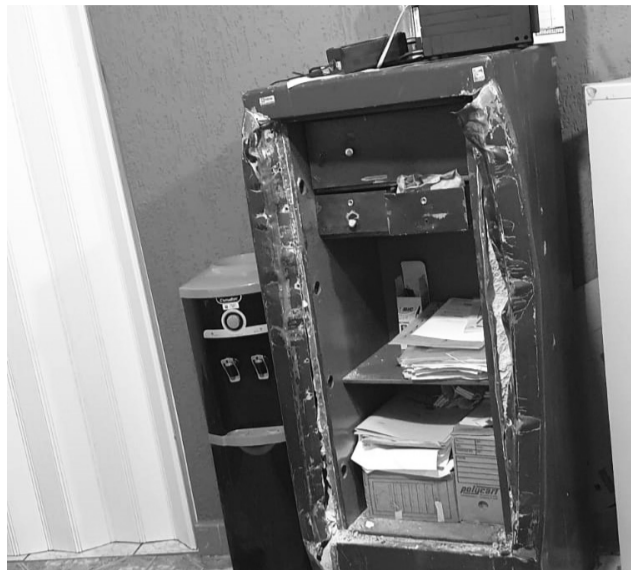
A porta do cofre foi arrancada e ficou jogada no chão.

O mais estranho é que paralelo ao furto do cofre, outros fatos, ocorridos na cidade no mesmo dia, podem ter colaborado para a fuga dos assaltantes e até para distrair a atenção da polícia. Na quarta-feira, dia do crime, houve o furto de uma moto e as tentativas de roubo de outra moto e da casa de um ex-vereador.