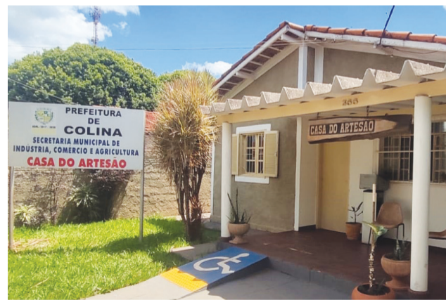
Fachada do novo endereço da Casa do Artesão, que fica em frente ao Saaec.