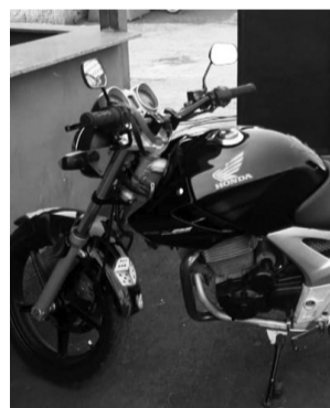
Twister 250 furtada horas antes do arrombamento do cofre da prefeitura.