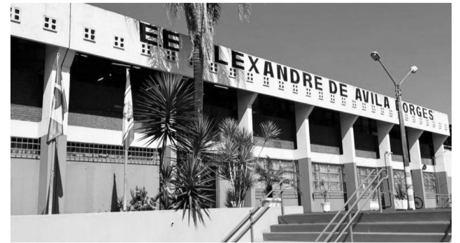
A Escola Alexandre, que fornece o Ensino Médio, inicia o ano letivo no próximo dia 2.

Maior tempo na escola e mais disciplinas acrescentadas à grade curricular são algumas das vantagens do Ensino Integral, implantado na EE “Alexandre de Ávila Borges” que inicia o ano letivo no dia 2 de fevereiro com 188 alunos.