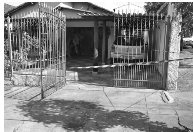
A cena do crime foi preservada até a chegada da perícia.