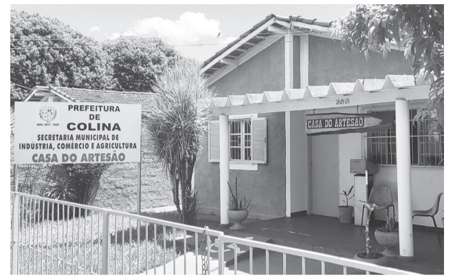
Desde o início do ano a Casa do Artesão está funcionando na Rua 13 de Maio, em frente ao Saaec.