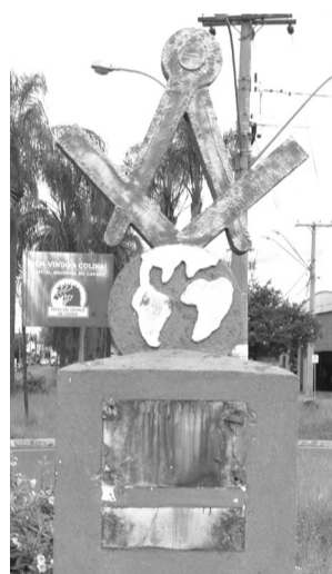
Monumento do trevo que teve as placas de bronze furtadas.

Duas placas de bronze pertencentes à Loja Maçônica, instaladas no monumento do trevo da Av. Luiz Lemos de Toledo, foram furtadas do local. O registro da ocorrência foi feito pela entidade que constatou o fato no último dia 31. Esse furto se soma aos do Museu, praça matriz e rodoviária que também tiveram as placas de bronze levados pelos ladrões.