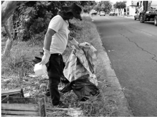
O novo arrastão, previsto de 14 a 18 deste mês, será realizado nos moldes de novembro. Estas e outras ações estão na programação do DECEN para conter o avanço da dengue.

“A equipe pretende realizar um novo arrastão na próxima semana se a chuva permitir. A intenção é eliminar a maior quantidade possível de criadouros do