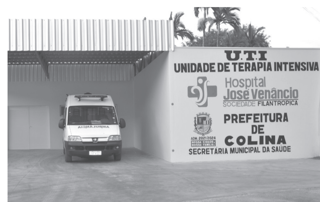
Fachada da UTI que na segunda-feira estava com todos os 5 leitos ocupados.

Ele explicou que para viabilizar esta homologação foi preciso adquirir boa parte dos equipamentos e pedir outros emprestados. “É preciso lembrar que no primeiro momento, em junho de 2021, foi o Estado que equipou os 10 leitos quando da instalação da UTI. O governo estadual alugou os equipamentos que