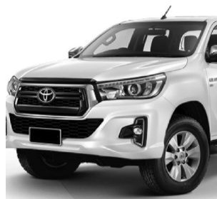
Modelo da caminhonete furtada de comerciante na segunda-feira.

A chuva incessante da manhã de segunda-feira, 7, retardou a presença do público nas ruas que na hora do almoço lotou o centro da cidade no 5º dia útil do mês e de maior movimento. O grande número de pessoas na Rua 7 de Setembro não impediu e nem inibiu