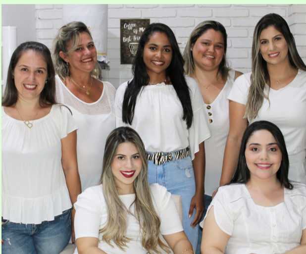
Equipe de profissionais da Revigore, clínica que oferece os mais diversos procedimentos para a saúde, beleza e bem estar dos clientes. Não espere mais para ficar mais bonito e de bem com a vida. Agende seu horário e peça mais informações pelo fone 99267-6120 ou vá até a Revigore, que funciona na Rua Tiradentes nº 55.

PEIXES - de 20/02 a 20/03 Particularmente deve pensar no êxito em tudo. Considere assuntos do amor, amizades, vida social e intercâmbios de ideias. Melhores possibilidades quanto aos assuntos de esporte. Com o fluxo do planeta Vênus você poderá sentir-se a vontade, livre mesmo para conseguir o que sempre quis, principalmente em termos financeiros.