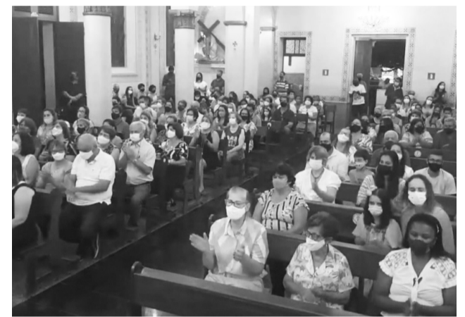
A igreja matriz ficou lotada na missa em louvor ao padroeiro na noite de sábado.