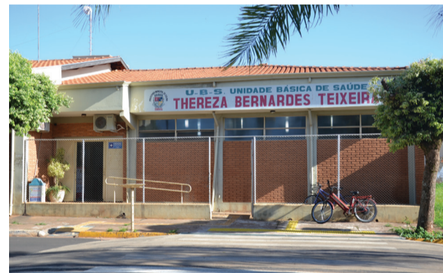
Unidade Básica de Saúde do bairro São Sebastião que ficou sem atendimento pediátrico devido ao não comparecimento da médica.