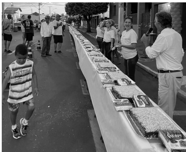
O enorme bolo foi servido à população em frente a prefeitura.

No final da tarde a comemoração continuou na praça central com a exposição de um bolo de brigadeiro gigante, de 73m lineares de comprimento, servido aos munícipes. A iniciativa inédita envolveu a dedicação de diversas secretarias e depar-