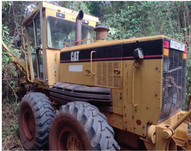
As máquinas estavam atoladas e tiveram que ser guinchadas da mata.

Um trator e uma motoniveladora, furtados no último dia 11 no canteiro de obras da Coopercitrus, foram encontrados abandonados nas proximidades da Fazenda São Joaquim. A polícia investiga o caso que coloca Colina na rota dos bandidos de máquinas agrícolas.