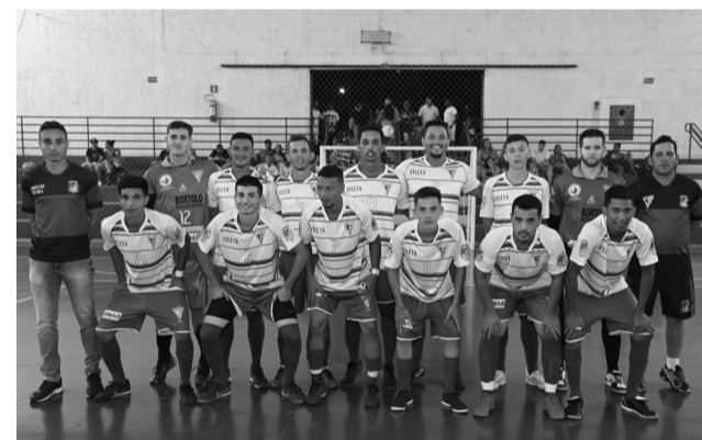
Equipe colinense que representa Colina na Copa Regional de Futsal e na Taça EPTV.

A equipe que disputada o futsal é a mesma que representa Colina/Secretaria de Esportes na 36ª edição da Taça EPTV. Colina estreia na competição hoje, dia 24, em jogo contra Terra Roxa que acontece em Bebedouro.