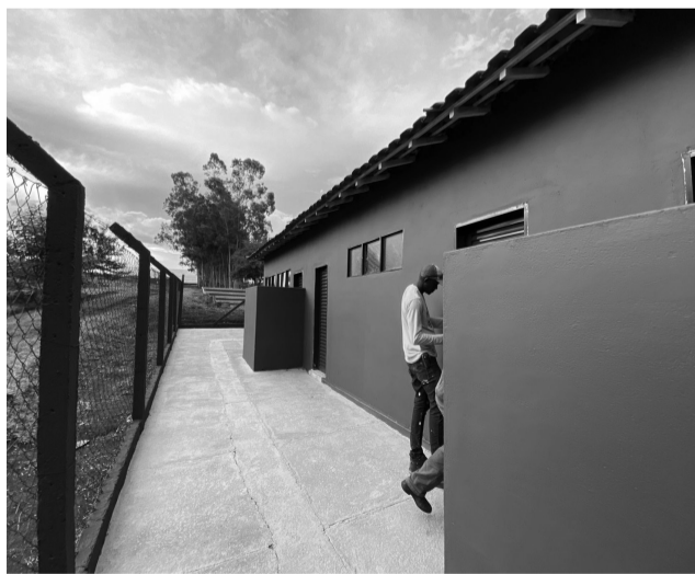
As obras de recuperação dos vestiários do Centro de Lazer foram concluídas na última semana.

“Já recuperamos as quadras, vestiários, arquibancadas e estamos concluindo o projeto de implantação do Jardim