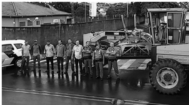
Sargento Espanhol, PMs e representantes da empresa com as máquinas encontradas na área rural.

O funcionário de uma propriedade rural avistou, nas proximidades da Fazenda São Joaquim, duas máquinas no fundo de uma mata na tarde do dia 16 e avisou o responsável, que acionou a PM que chegando ao local constatou tratar-se do trator Valtra 1680 e a motoniveladora Caterpillar 140H furtados na madrugada do dia 11 do canteiro de obras da Coopercitrus. Os maquinários foram retirados da mata e levados à delegacia, onde após periciados foram devolvidos ao proprietário da empresa que presta serviço à Coopercitrus. Os equipamentos furtados de um contêiner não foram localizados.