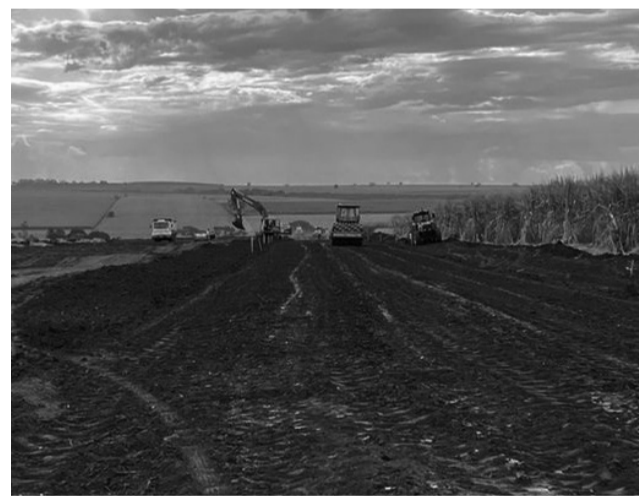
O alargamento e compactação do leito carroçável é uma das melhorias executadas na vicinal, que liga o município a Terra Roxa.