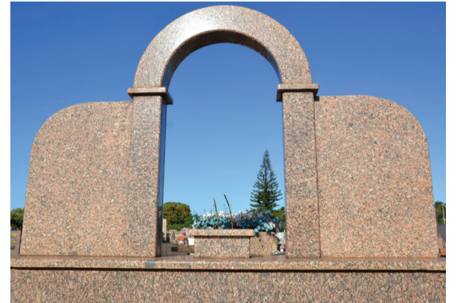
PANORAMA Túmulo sem a imagem que decorava a parte superior.

Em busca de cobre e bronze os ladrões não respeitaram nem mesmo os túmulos do Cemitério Municipal, que foi invadido na madrugada do dia 19. A direção constatou o furto de várias imagens, vaso e outros objetos.