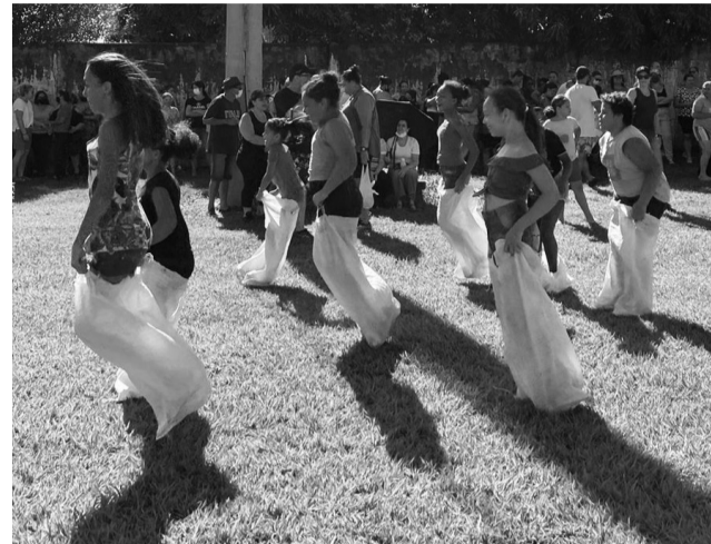
As crianças se divertiram com as inúmeras brincadeiras.

que doou troféus e camisetas aos atletas inscritos. O evento esportivo, com largada no Centro de Lazer, reuniu mais de 100 atletas de Jaborandi e região que disputaram 10 categorias.