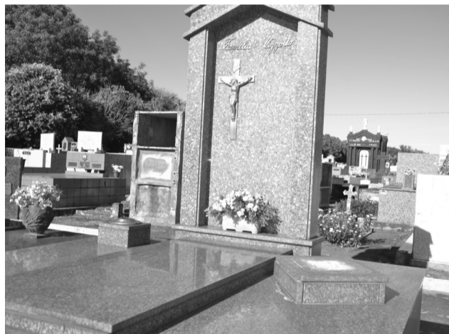
Túmulo de onde foi furtado a imagem de São José.

Em busca de cobre e bronze os ladrões tem causado grande prejuízo na cidade e deteriorado a memória histórica de monumentos e prédios públicos, que tiveram as placas furtadas. O alvo desta vez foi o cemitério que foi invadido durante a madrugada do dia 19 por meliantes que arrancaram e furtaram imagens de bronze de Nossa Senhora e São José de três túmulos. Também houve a tentativa de retirada de vaso, mais imagens e objetos de outras sepulturas, mas sem êxito. A imagem de um monge franciscano, arrancada de um dos jazigos, foi encontrada próxima a um dos portões do cemitério.