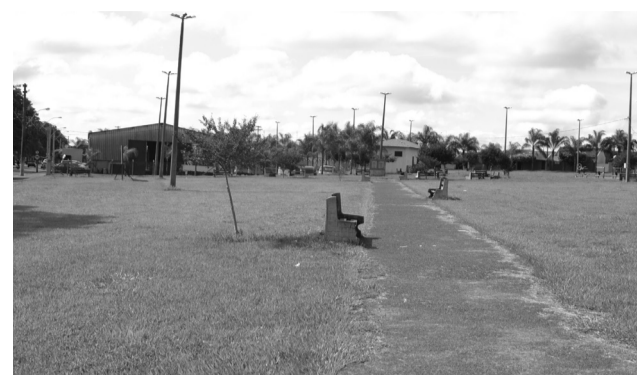
Praça da Cohab 3 onde a PM fez mais uma apreensão de droga sintética.

droga numa festa, no dia anterior, por R$ 50,00 e que começou a usar a substância há cerca de um mês. Em contato com o plantão policial em Barretos, os PMs apreenderam a droga e liberaram o autor no local.