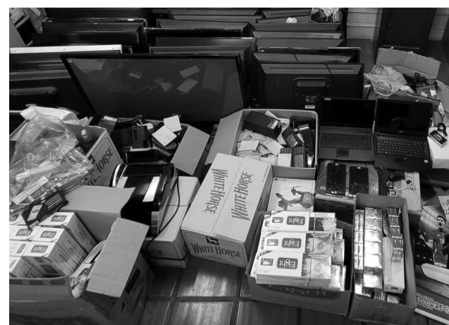
Produtos apreendidos em megaoperação da Polícia Civil que envolveu policiais de diversas unidades e prendeu 14 pessoas.

Mediante todas as informações levantadas nas investigações, o delegado Rafael Faria Domingos solicitou e a justiça concedeu os mandados que resultaram na prisão temporária de 12 pessoas, sendo 10 homens e duas mulheres, além de 2 adolescentes apreendidos. Também houve a apreensão de R$ 6 mil, cocaína, cigarros tradicionais e eletrônicos produtos de contrabando e farto material relacionado a jogos de azar. Os homens foram encaminhados à cadeia de Colina, as mulheres à cadeia de Bebedouro e os adolescentes levados à Fundação Casa de Araraquara. As investigações prosseguem para identificação de outros envolvidos nesta rede de distribuição de drogas em Barretos.