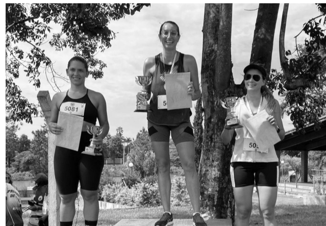
A corrida na manhã de domingo reuniu mais de 100 participantes nas diversas categorias.