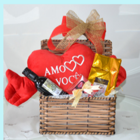
DOCE DIA DOS NAMORADOS A comemoração do Dia dos Namorados merece os aromas e sabores da Santé Cacao, especialista em tornar qualquer momento mais prazeroso com a sua linha de produtos que só de lembrar já dá água na boca. Deguste a dois estas delícias!