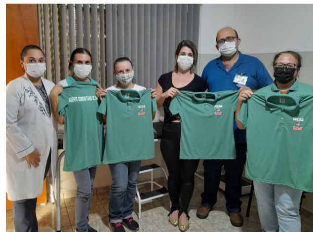
Servidores exibem as novas camisetas durante entrega feita pelos representantes da Saúde.

executem suas tarefas com maior conforto e comodidade e também proporcionando segurança para a população que os recebe em casa”, destacou o prefeito Dieb.