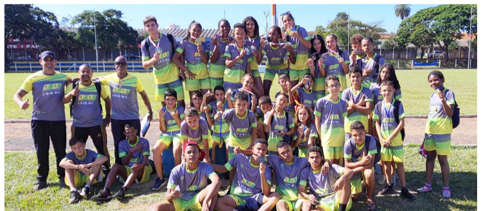
Comissão técnica com os 33 atletas que participaram da competição em Araraquara.

Os atletas jaborandienses foram destaque na 2ª Etapa do Circuito de Atletismo da Juventude realizada em Araraquara no último final de semana, que teve a participação de 7 cidades da região: Guariba, Sertãozinho, Santa Rita do Passa Quatro, Monte Alto, Ibaté, além de Jaborandi e a anfitriã dos jogos.