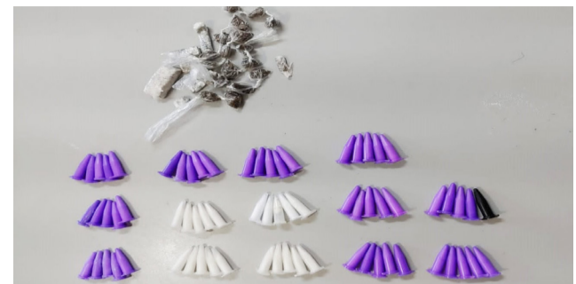
Papelotes de maconha e cápsulas de cocaína apreendida com três homens presos no Patrimônio.

Em patrulhamento pelo bairro Patrimônio na tarde do dia 2, os PMs Urias e Neves avistaram vários indivíduos próximos a um seringal. Ao todo 8 pessoas foram revistadas e três conduzidas à delegacia, sendo que três de 19, 20 e 21 anos permaneceram presas por portarem as seguintes drogas: 26 papelotes de maconha (36g), 70 cápsulas de cocaína (106g) e celulares.