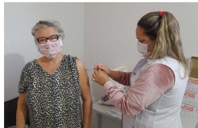
Idosa recebe a dose da gripe em um dos postos de vacinação.