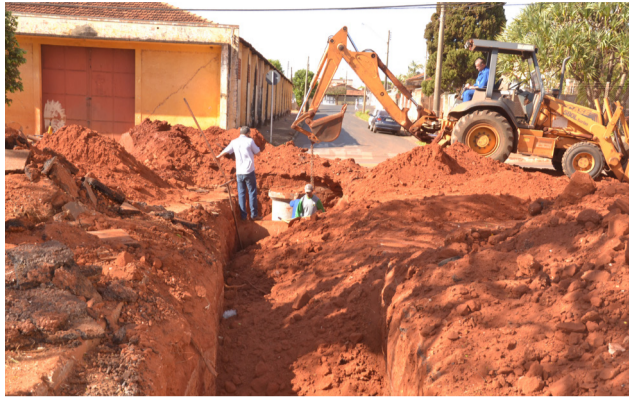
O município tem investido na substituição das tubulações de amianto por PVC, reduzindo vazamentos e custo operacional.

Os projetos de atualização do plano de perdas e a reforma e ampliação da estação elevatória de esgoto do Jardim Santa Lúcia já estão aprovados, aguardando somente a