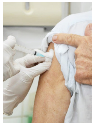
A quarta dose para pessoas de 50 anos ou mais já está disponível.