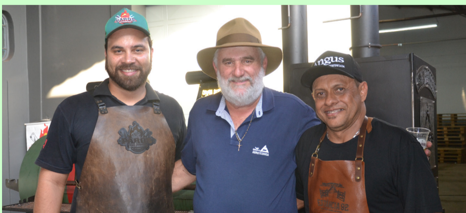
A equipe Paros Churrasco também marcou presença e ganhou destaque ao lado do proprietário.