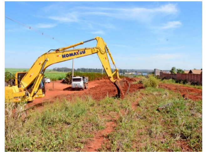
Construtora iniciou as obras de pavimentação da estrada que interliga Jaborandi a Barretos.

A conquista também contou com a ajuda de parceiros. Silvinho agradeceu os produtores rurais