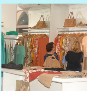
CREDIÁRIO ESPECIAL - O Grupo Brasil está com Crediário Especial nesta Semana dos Namorados para não deixar seu par sem presente. Comprando em uma das lojas (Casa Brasil Magazine, Pé Brasil, Brazil Store e Línea Brazil/Línea For Men) até neste sábado, dia 11, você começa a pagar somente em outubro. É isso mesmo, você faz seu amor feliz e paga o presente só daqui a quatro meses e de forma parcelada.