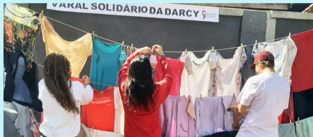
O Grêmio Estudantil da Escola Darcy organizou o "Varal Solidário" onde são colocadas roupas para doação. Os prendedores trazem palavras de carinho para as pessoas que necessitam das peças expostas. A ação faz parte do Programa Inverno Solidário em que a Secretaria Estadual de Educação está envolvida. O varal, que é para toda comunidade, funciona de forma permanente ao lado do portão de entrada dos alunos.