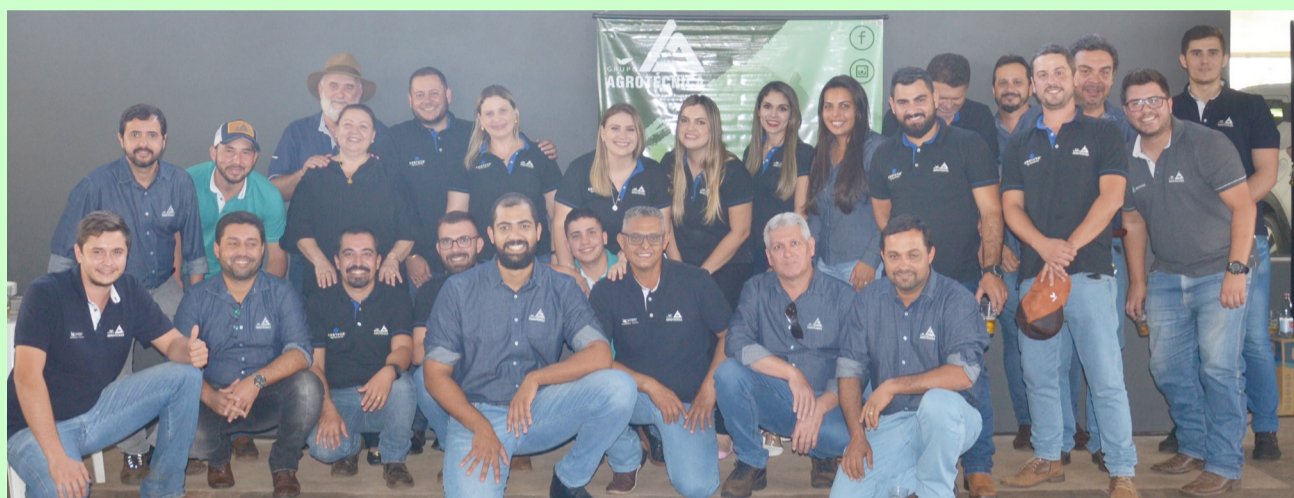
Colaborares do Grupo Agrotécnica presentes na inauguração da nova filial.