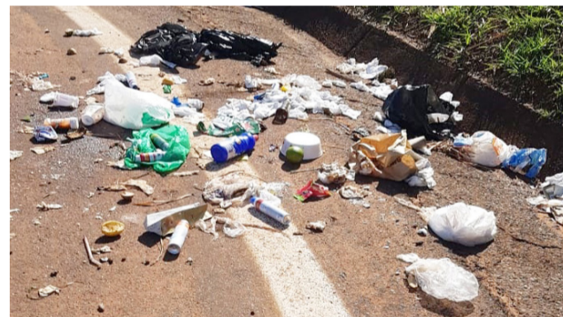
Lixo descartado ficou espalhado pela pista.

“Quando deparamos com cenas desta natureza a obrigação é reclamar e