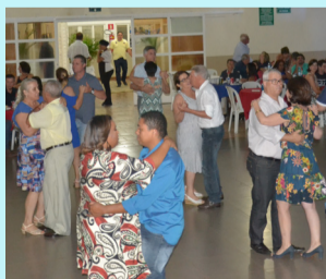
BAILE CASAIS - Você gosta de dançar e está com saudade dos bailes do Grêmio? Então não perca o Baile de Casais que o clube promove neste sábado, véspera do Dia dos Namorados, com a banda R3. Reservas de mesas e informações pelo fone 3341-1419.