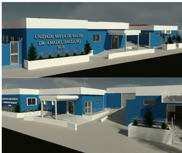
Projeto mostra como ficará a fachada do hospital quando as obras tiverem concluídas.

“Após 33 anos o hospital ganhará, de forma simultânea, os serviços de diagnóstico de imagem com a aquisição de um moderno Raio X Digital DR e de um aparelho de ultrassonografia