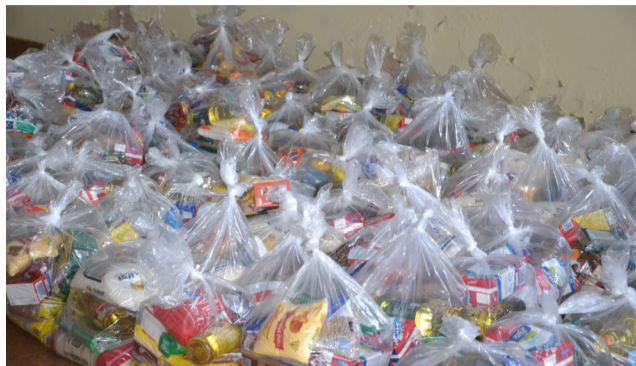
Cestas montadas no ano passado com as doações arrecadadas na celebração, que supriu a necessidade de muitas famílias.

No feriado de hoje, 16, comemora-se o Corpus Christi que tem início às 16h com celebração de missa na praça São Sebastião. Na sequência os cristãos seguem em procissão até a igreja matriz para a bênção do Santíssimo.