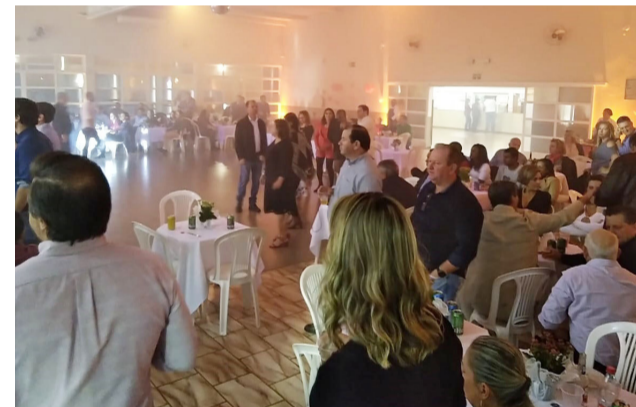
Muitos casais prestigiaram na noite de sábado o baile promovido pelo Grêmio. Além do ambiente agradável, os casais dançaram ao som das músicas da Banda R3, que embalou o repertório romântico da badalada noite.