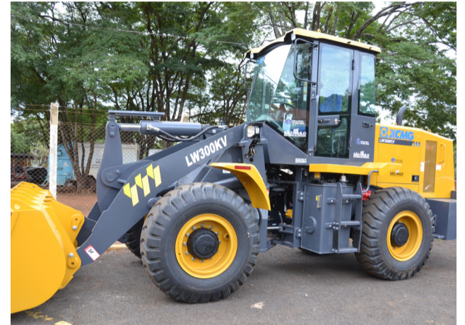
Motoniveladora e retroescavadeira vão reforçar o trabalho na zona rural.