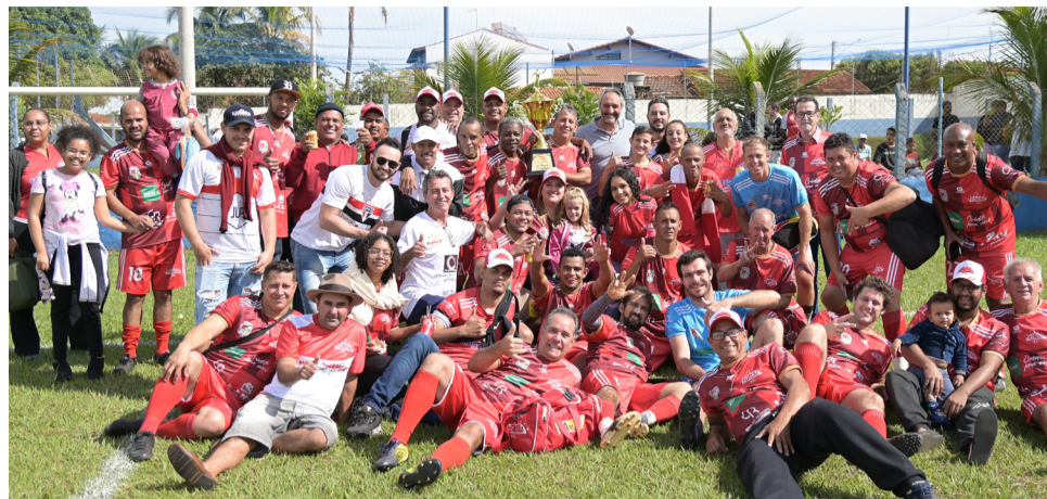
A Pedreira segurou o empate sem gols e foi a campeã do 2º turno. Domingo tem a grande final com mais um duelo com o Amigos do Xibil.

Mesmo perdendo Chupeta logo aos 2', após voltar a sentir dores, o Xibil foi para cima do adversário e dominou as ações nos primeiros quarenta minutos, criando ao menos três boas chances de gol. Uma aos 9', com Parral, que chutou torto errando o gol; outra aos 20' após contra-ataque puxado por Gilsinho, que partiu em velocidade aproveitando a rebatida de um escanteio, tocou para Pelé, que cruzou para Brito, que estava impedido; e mais uma