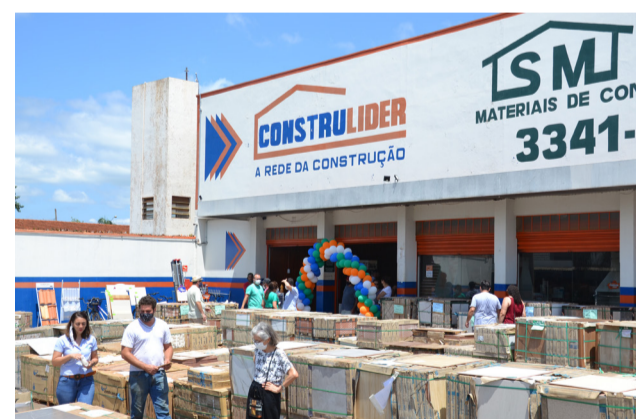
O Super Feirão de Pisos da Simões é imbatível e cada nova edição atrai um número maior de consumidores, que aproveitam as ofertas e condições especiais de pagamento que facilitam muito quando o assunto é reforma e construção. Se você perdeu a promoção de sexta e sábado não se preocupe, logo tem mais!