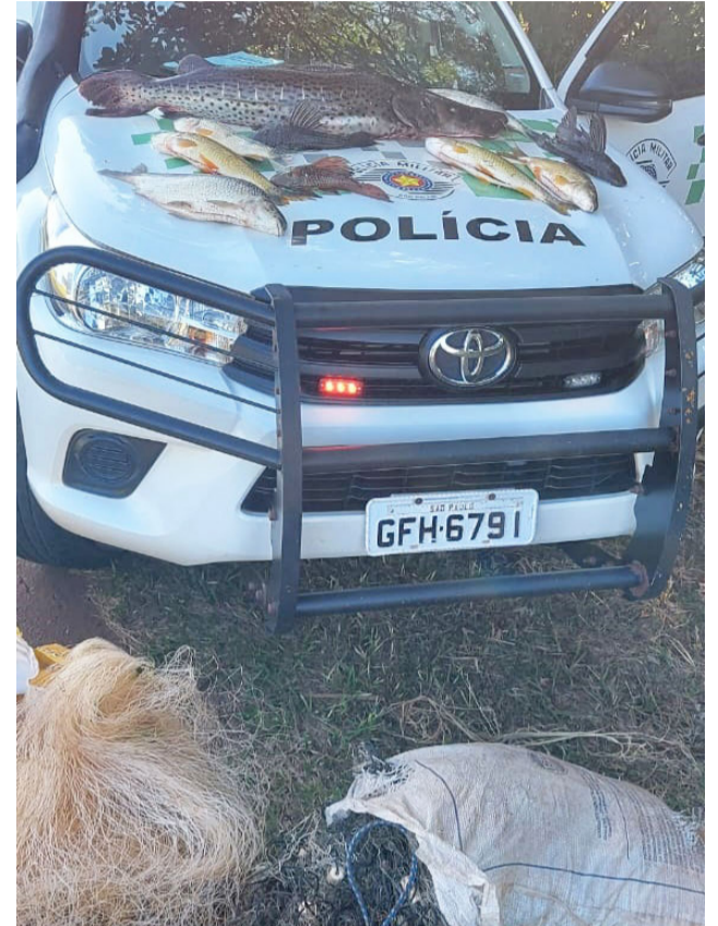
Peixes, rede e tarrafas apreendidos pela Polícia Ambiental com pescadores às margens do Rio Pardo, em Jaborandi.

Dois pescadores de Jaborandi foram autuados pela Polícia Ambiental em R$ 6.721,60 por pesca mediante apetrecho não permitido e multa simples de R$ 1 mil por dificultarem a ação policial. A autuação foi realizada dia 5, às margens do Rio Pardo, na área de ranchos, quando os pescadores desrespeitaram a ordem de parada e fugiram com o barco dispensando alguns peixes no rio. A abordagem aconteceu no rancho onde os pescadores desembarcaram. Além de peixes, foram apreendidos 45m de rede e 4m de tarrafas.