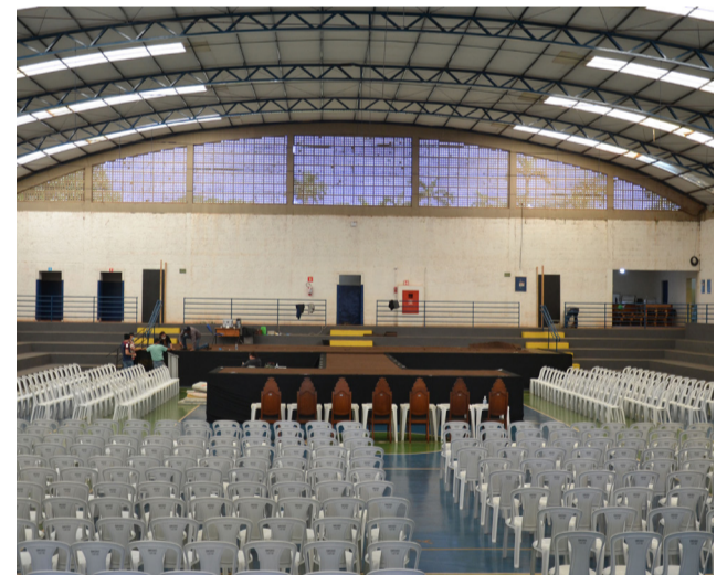
Interior do Ginásio de Esportes que está sendo preparado para o grande evento de sábado.

do Recinto, das 20 às 23h59, mediante apresentação do voucher impresso e documento com foto.