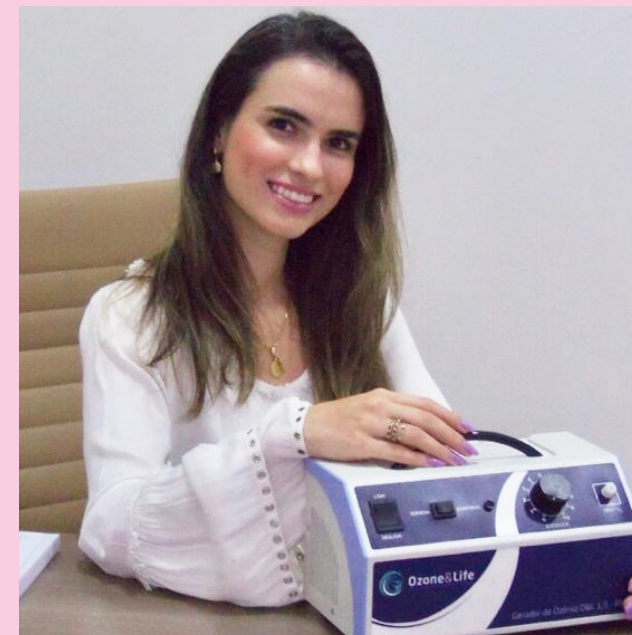
A fisioterapeuta é especialista em ozonioterapia e uma das pioneiras a introduzir a técnica em Colina e região.

Siga nossas redes sociais no Instagram: @revitalize.colina Av. Dr. Manoel P. Fernandes, 459 Fone: 98187-5594