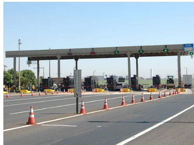
Considerando o índice do IPCA, a tarifa do pedágio da praça de Colina deve ser superior a R$ 11,00.

O reajuste contratual das tarifas de pedágio acontece amanhã, dia 1º, mas até o fechamento desta edição a Artesp não tinha divulgado o novo valor na praça de pedágio em Colina, que atualmente é de R$ 10,10. O IPCA (11,73%) é usado no cálculo do reajuste.