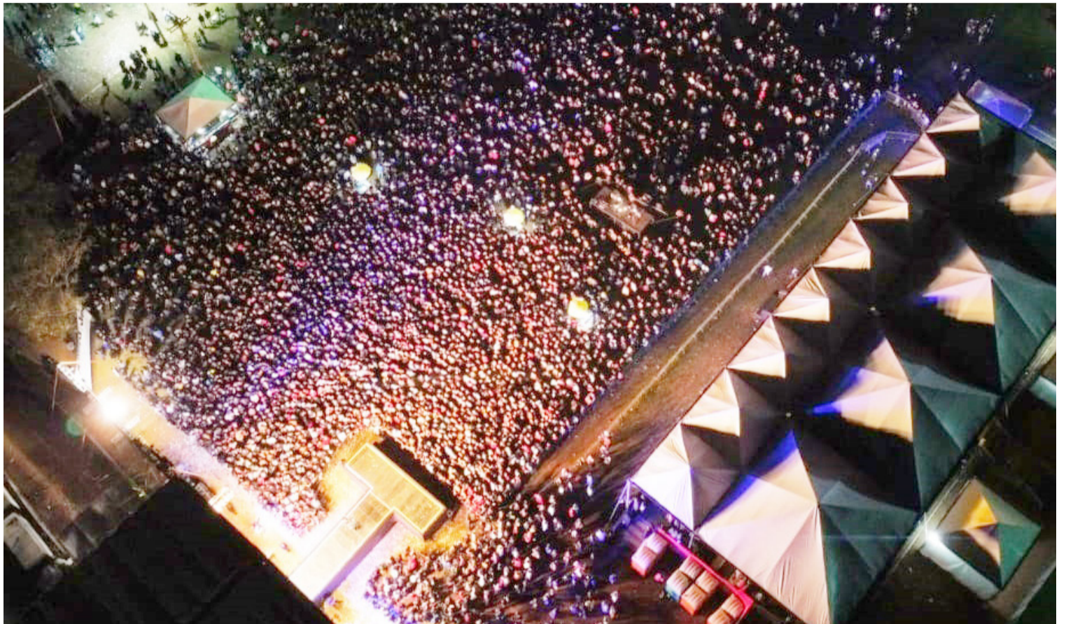
Vista aérea do Recinto que foi tomado pela multidão. As noites de sexta e sábado registraram o maior público.

Segundo informações extraordinárias, a sexta e o sábado foram os dias de maior público, inclusive com uma longa fila para entrar no Recinto Municipal. As competições hípcas registraram a participação de 715 competidores. Confira mais detalhes da festa nesta edição