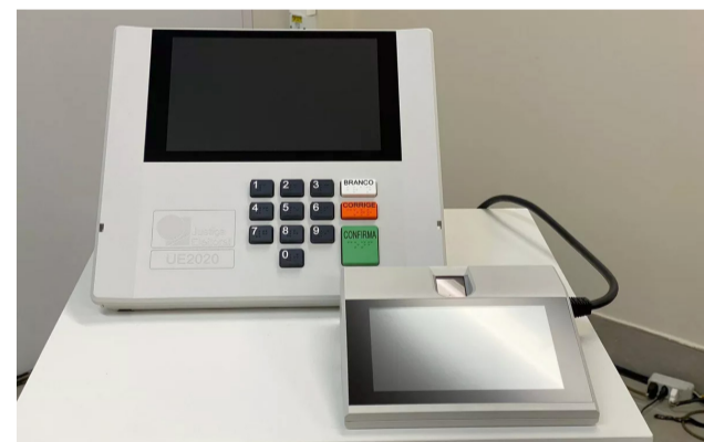
Modelo de urna que o Cartório recebeu para a eleição de outubro.

o mesário nos trabalhos. Futuramente analisaremos a necessidade do treinamento também presencial que, se ocorrer, será realizado no mês de setembro em datas a definir", ressaltou Campos Júnior.