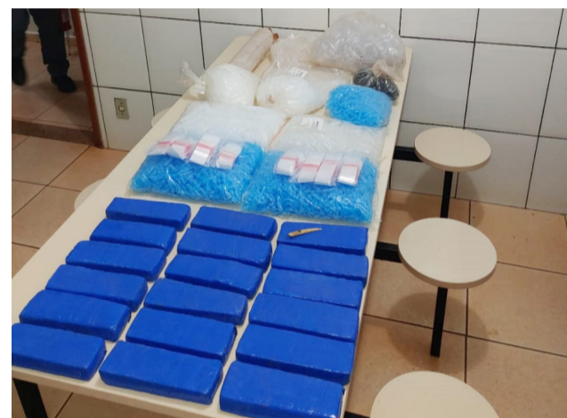
Tabletes de maconha enterrados dentro de um tambor na Fazenda do Estado.

Na noite do dia 10, por volta das 18h20, a PM foi checar denúncia de tráfico e apreendeu 18 tabletes de maconha, que pesou 9,4 quilos. A droga estava dentro de um tambor enterrado na Fazenda do Estado, próximo à Estação de Tratamento de Esgoto. Também foram apreendidas 3 mil embalagens vazias para cocaína, 500 para crack, 200 flaconetes para lança-perfume, 8 pacotes com 100 embalagens plásticas e um rolo de plástico filme.