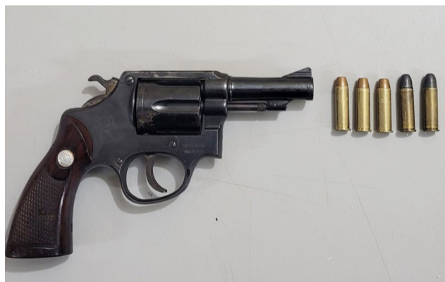
Revólver calibre 38 e projéteis apreendidos na Vila Hípica com morador de Pitangueiras, que teria vindo a Colina praticar homicídio.

Um morador de Pitangueiras, de 47 anos, casado, veio a Colina na madrugada do dia 10 para conversar com a namorada, que reside na Alameda D da Vila Hípica, onde o indiciado ficou esperando. Desconfiado da atitude do autor, que passou várias vezes com seu Vectra pelo local, um morador do bairro acionou a PM por volta das 04h30 que o abordou e apreendeu no interior do seu veículo um revólver Taurus, calibre 38, municiado com 5 cartuchos intactos. Ele alegou ter adquirido a arma há cerca de um ano por R$ 2.800,00. Ao pesquisar a numeração os PMs Uilis e Almeiani constataram que o revólver foi furtado em 2003 em Ribeirão Preto. O autor foi conduzido ao plantão policial onde permaneceu preso.