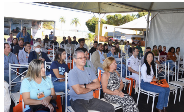
Público que assistiu as palestras realizadas em estrutura instalada no Recinto.

O evento contou com a parceria da prefeitura e de diversos apoiadores e patrocinadores, como a Apta, ETAM "São Francisco de Assis", Unesp, USP, Exército Brasileiro, Polícia Militar e iniciativa privada.