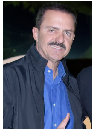
Deputado Itamar Borges.