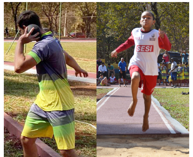
A competição na manhã de sábado também teve arremesso de peso e salto à distância.