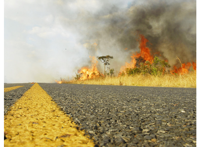
Bituca de cigarro pode provocar incêndios de grandes proporções nas rodovias.