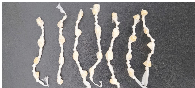
Pedras de crack encontradas com recicladora, que também foi presa.