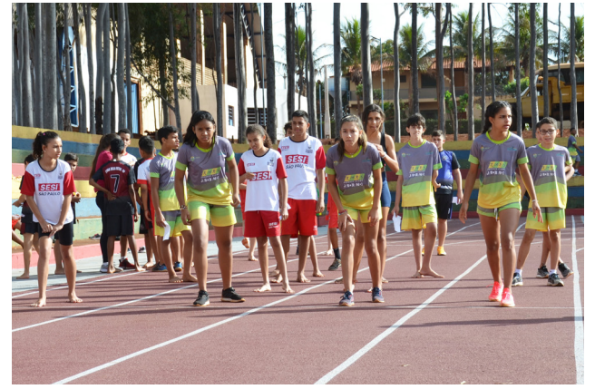
Participantes se preparam para a largada de corrida na nova pista de atletismo, inaugurada no centro de lazer.