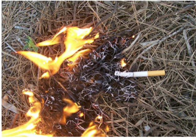
Uma bituca pode se propagar na vegetação seca e causar incêndios, tanto no campo como na cidade.

geralmente, Colina fica na cor amarela que significa em observação. A cor roxa é usada em caso emergencial. Essa classificação é enviada diariamente pela Defesa Civil Estadual e divulgada no Facebook da Secretaria de Planejamento e Meio Ambiente (Colina