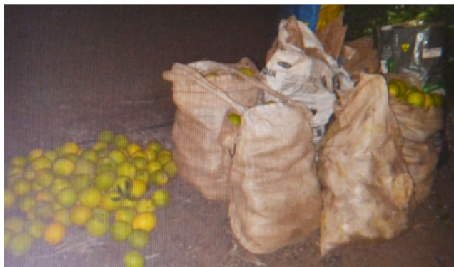
Frutas e sacolas cheias de laranja abandonadas na fazenda pelos ladrões que fugiram.

No dia 25, por volta das 23h10, o funcionário de uma fazenda na vicinal Renê Vaz de Almeida, entre Colina e Monte Azul, foi avisado sobre o furto de laranjas na propriedade. Ao chegar ao local os autores fugiram, deixando para trás muitas frutas colhidas, aproximadamente 25 caixas, acondicionadas em sacolas próprias para colheita e embalagens de ração canina.