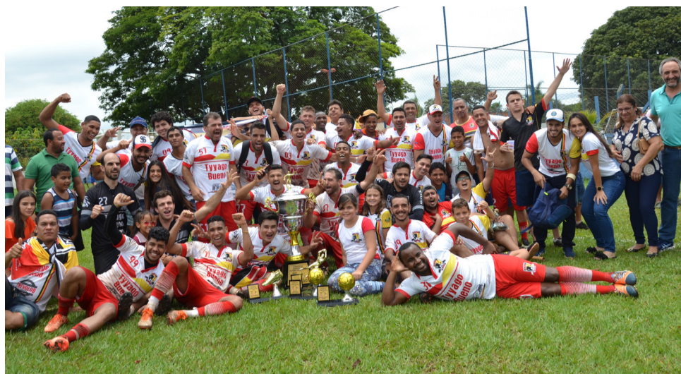
Campeão em 2019, última edição do Amador, o Muleks da Dirce vem reforçado para este ano.

Como de costume, o Colina Atlético e Pedreira recebem dois jogos cada aos domingos, às 8h e 10h. O revezamento será entre os campos da Nova Colina, Vila