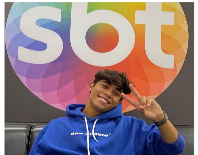
Ator Vinícius Leme participa das gravações da novela “Poliana Moça”, transmitida pelo SBT.

Por conta dos milhares de seguidores nas redes sociais (@oviniuscilme), o ator também se tornou um influenciador digital. Ele possui mais de 1 milhão de seguidores no TikTok, 500 mil no Kwai, 200 mil no YouTube e 32 mil no Instagram.