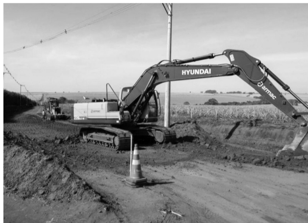
Máquina trabalha na construção da estrada que interligará a região as rodovias do Estado.