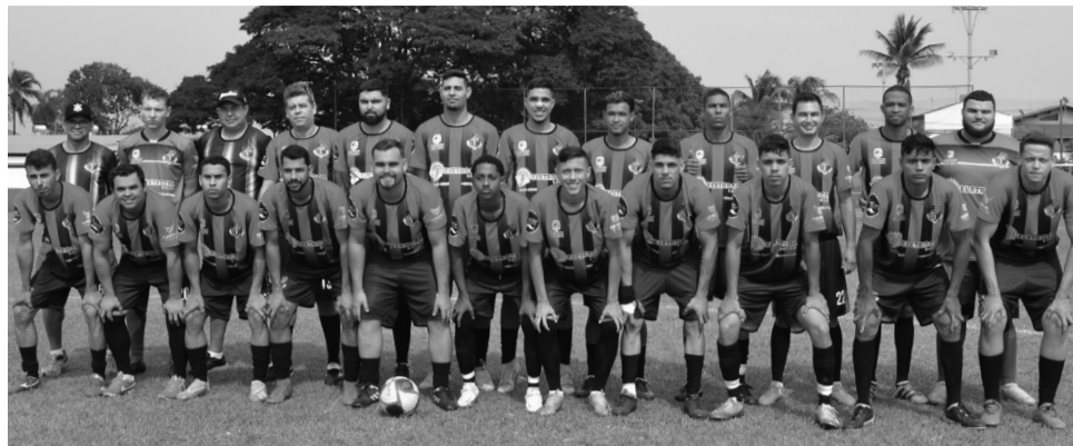
AMIGOS DA COHAB 1 – Estreante no Amador o AC1 comemorou o empate em 2 a 2 diante do campeão do Amador, Muleks da Dirce. No próximo domingo o time pega o Primavera (vice-campeão de 2019), às 10 horas, no Colina Atlético.

O estreante AC1 (Amigos da Cohab 1) conquistou um importante empate diante do atual campeão do Amador, Muleks da Dirce, no jogo das 10 horas no Colina Atlético e comemorou.