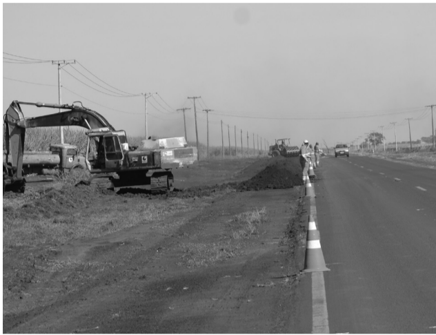
A Rodovia Antônio Bruno, entre Jaborandi e Colina, também recebe melhorias para oferecer segurança aos usuários.