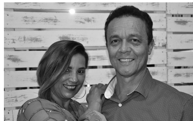
A animação de Paçoca/Geni contagia quem está perto do casal, que no dia 14 celebra mais um ano de casamento.