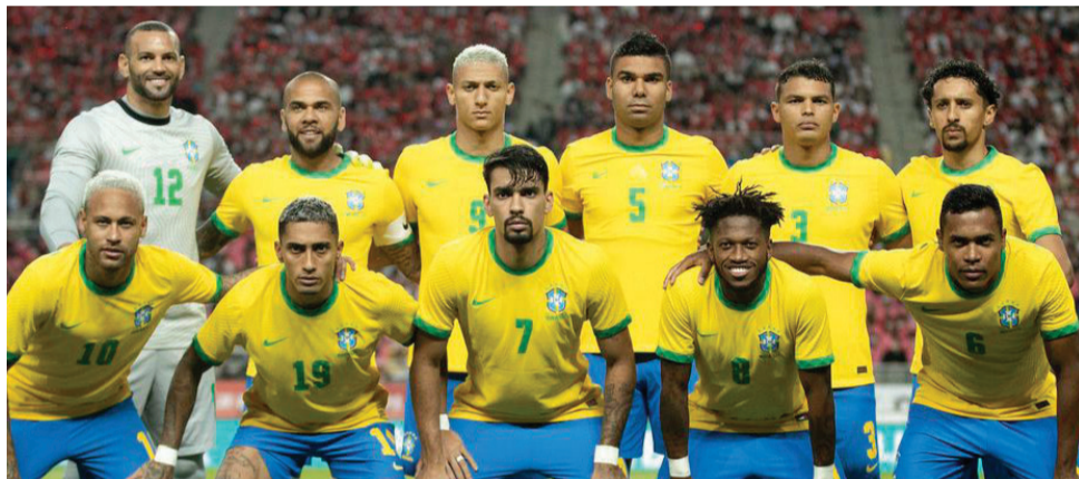
Possível escalação da seleção brasileira que faz o jogo de estreia na Copa do Catar no dia 24, contra a Sérvia.