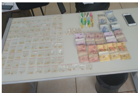
Crack e cocaína que estavam no interior da pochete apreendida com a menor na praça do Patrimônio.

Ao avistar a viatura duas mulheres que estavam na praça do Patrimônio na tarde do dia 10, atravessaram a rua em direção a um estabelecimento comercial sendo abordadas pela PM. A estudante, de 17 anos, portava um pochete com 20 cápsulas de cocaína (44,86g), 105 pedras de crack (42,91g) e uma nota de R$ 10,00. Ela alegou que a quantia de R$ 103,00 que estava no bolso da calça é fruto da venda de drogas com a comparsa, de 24 anos, que negou a participação. As duas foram apresentadas na delegacia, onde a autora maior de idade foi autuada por tráfico e corrupção de menores, sendo encaminhada a cadeia feminina de Bebedouro. O depoimento da menor foi acompanhado por sua genitora.