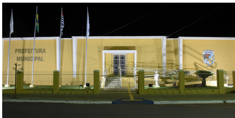
Receita/despesa do município para 2023 está orçada em cerca de R$ 12,7 milhões por mês.

As secretarias com a maior dotação na Administração Municipal são as de Educação com total de R$ 46.635.000,00, Saúde (R$ 38.362.000,00),