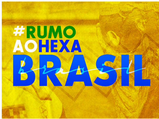
A Copa reacende as esperanças da conquista do hexa pela seleção brasileira.

A ACIC montou um horário especial para o funcionamento do comércio durante os jogos da seleção, que estreia na próxima quinta-feira, dia 24, contra a Sérvia. As lojas fecharão meia hora antes do jogo,