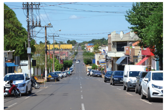
Comércio colinense vai distribuir mais de 370 raspadinhas premiadas durante promoção do final de ano, que começa no próximo dia 21.

As lojas participantes da promoção também estarão concorrendo a prêmios. Uma comissão, montada pela ACIC, escolherá os cinco estabelecimentos mais enfeitados e com a decoração natalina mais bonita. Os escolhidos ganharão um jantar com acompanhante (cada) em data e local a ser definido pela associação.