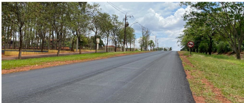
A nova camada de asfalto já deu um novo visual à estrada, importante via de acesso para os moradores de Colina e Jaborandi.

As obras de recuperação e modernização em toda extensão da Rodovia Antônio Bruno, que liga Colina a Jaborandi, estão quase concluídas, restando apenas a aplicação da camada de rolamento, pintura e a sinalização.