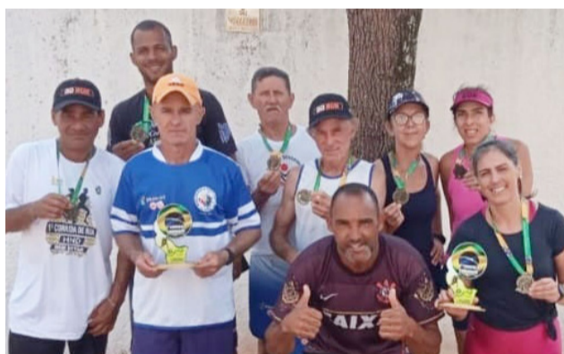
Atletas da Secretaria de Esportes que participaram da corrida.