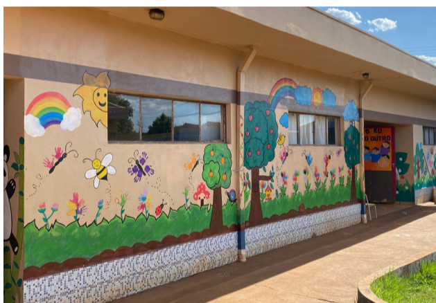
Parede da unidade infantil ganhou novo visual com as pinturas.