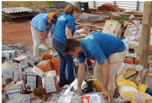
A coleta de materiais nas construções, no combate à arboviroses, também fez parte das ações.