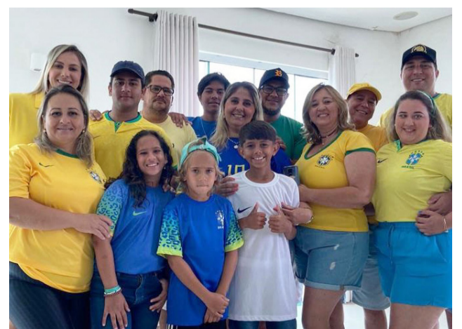
O contato com as belezas naturais de Capitólio revigorou as energias desta turma de colinenses, que se encantou com este famoso pedacinho de Minas Gerais.