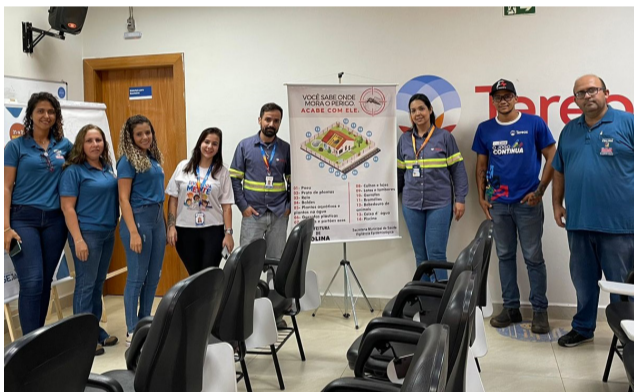
Agentes na mobilização realizada na Unidade São José do Grupo Tereos.

“A participação da sociedade é fundamental para conquistar o sucesso no combate ao mosquito transmissor da dengue”, destacou o prefeito Dieb.