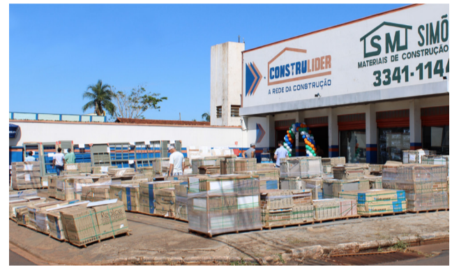
Adquirir pisos com pagamento facilitado e preços imperdíveis é no Feirão de Pisos da Simões, uma das promoções mais esperadas pelos colinenses que não perdem as condições especiais oferecidas pela loja de materiais de construção, que nos dias 25 e 26 realizou mais uma edição do feirão.

Alunos do Ensino Médio da EE "Prof. Darcy Silveira Vaz" e professoras na redação d'O COLINENSE. Na visita, que aconteceu na manhã de segunda-feira, os estudantes conheceram todo o processo de elaboração da edição semanal e a história deste hebdomadário centenário. Foi um prazer recebê-los!