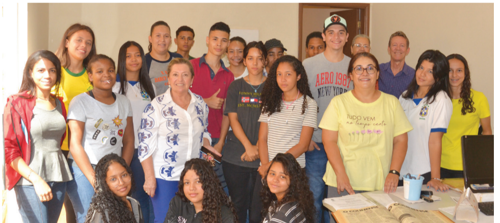
Estudantes e professoras da Darcy durante visita à redação d'O COLINENSE.

Alunos da Escola Darcy estiveram na redação do jornal O COLINENSE na manhã de segunda-feira, 28, quando conheceram o processo de edição e