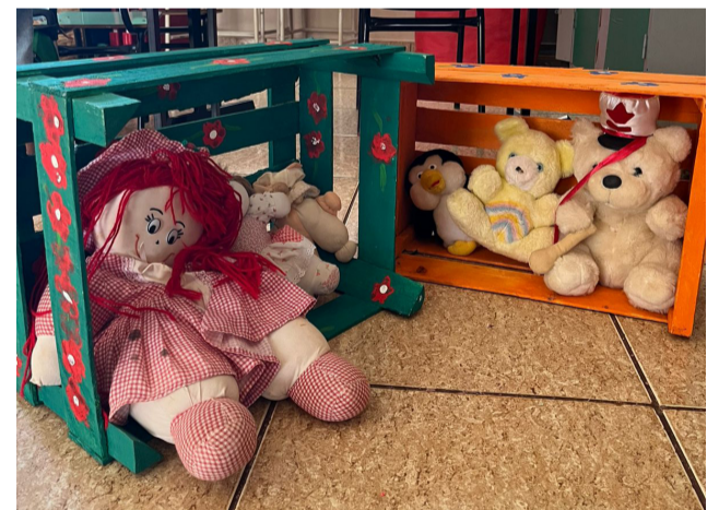
Caixotes se transformaram em armário para bonecas e ursos de pelúcia utilizados pelos alunos.