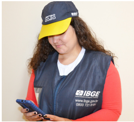
Moradores ausentes e recusa em dar informações atrasa conclusão do Censo.

O Censo em Colina já foi prorrogada por duas vezes, por conta da falta e evasão de funcionários. Além do número reduzido de recenseadores, outra dificuldade são os moradores que não são encontrados em suas residências e também daqueles que se recusam em dar informações. Pág. 3