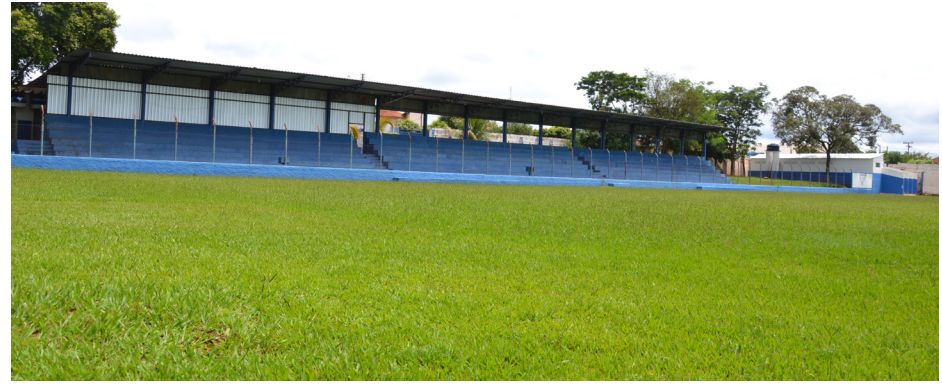
Gramado do Colina Atlético está preparado para estreia do time que pega o Manchester neste domingo.

O Colina Atlético estreia neste domingo, dia 29, às 9h30, no Campeonato Amador e recebe na "Toca do Tigre" o Manchester, de Bebedouro.