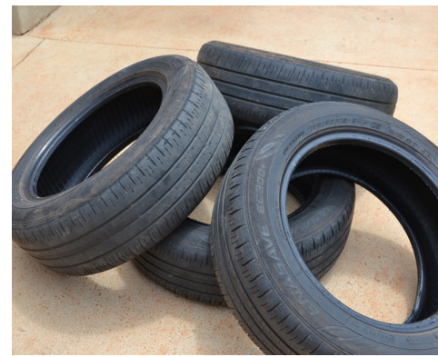
Colina mantém programa de coleta e destinação adequada para pneus em desuso.

O programa existe faz tempo, mas muitas pessoas ainda insistem em descartá-los de forma errada prejudicando o meio ambiente e causando risco à saúde, já que os pneus expostos à chuva são potenciais criadouros do mosquito da dengue. Pág. 6