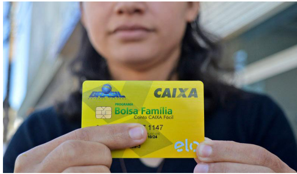
Beneficiários do programa social precisam fazer o recadastramento para continuarem recebendo o auxílio do governo federal.

O valor extra começará a ser pago após o governo fazer um pente-fino no CadÚnico para eliminar fraudes. “O governo está cruzando informações para averiguar os cadastros