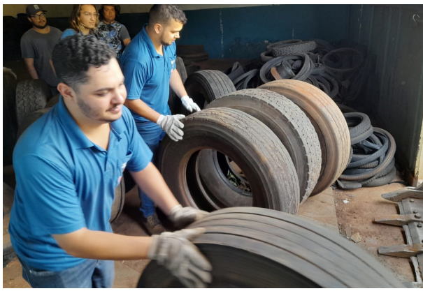
Pneus recolhidos são destinados à empresa de reciclagem ligada à Associação Pneumática.

“O pneu inservível é um objeto que pode reter