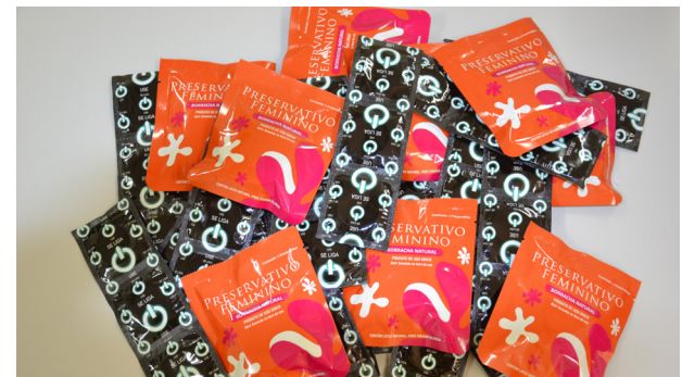
Preservativos estarão à disposição dos foliões no Recinto.

O sexo seguro com o uso de preservativos é a única maneira de se proteger das ISTs (Infecções Sexualmente Transmissíveis) e do vírus HIV/Aids. A Secretaria de Saúde disse que os preservativos, masculinos e femininos, estarão à disposição dos foliões do “Colina Folia”. As unidades podem ser