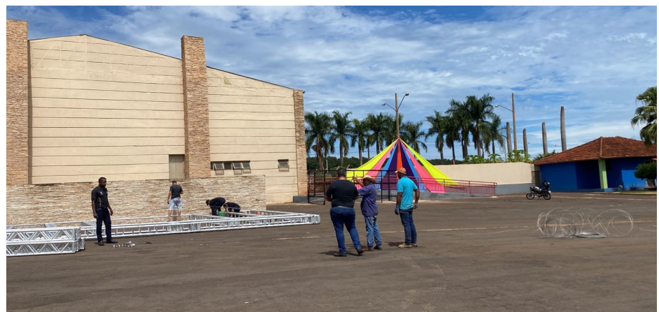
Equipe trabalha na montagem do palco para as apresentações musicais.