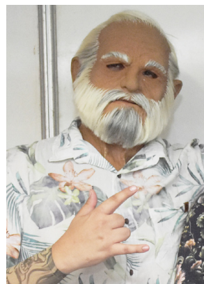
A galera pediu bis e os “Vovôs do Funk” retornam ao “Colina Folia” para sacudir a moçada na noite do dia 20.

PROCURE O DEPARTAMENTO DA RECEITA, ANEXO AO PRÉDIO DA PREFEITURA MUNICIPAL DE COLINA, MUNIDO DE DOCUMENTO COM FOTO E COMPROVANTE DE RESIDÊNCIA. ATENDIMENTO DE SEGUNDA À SEXTA-FEIRA, DAS 8H ÀS 11H30 E DAS 13H ÀS 17H.