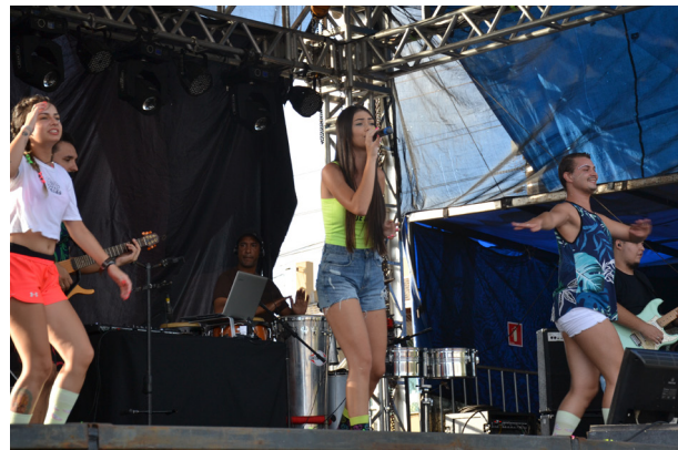
A Banda Reprise vai animar as matinês e as noites de domingo e terça-feira.

ao palco na segunda, seguida dos Vovôs do Funk. Na terça-feira a