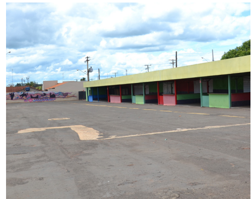
O Parque de Exposições “Gino Henrique Brunozi” recebe os preparativos para o Jaba Folia.