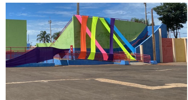
A decoração carnavalesca está colorindo o palco da festa, que começa a partir de amanhã.

vasilhames de vidro. E para agitar a folia terá a disputa de blocos com direito a premiação. A festança carnavalesca começa amanhã, 17 e vai até na terça-feira, 21.