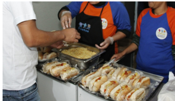
Ambulantes e barraqueiros serão fiscalizados.

vão atuar dentro do Recinto também precisam se cadastrar na Secretaria de Esportes e Turismo, que funciona no local.