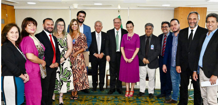
Diretores da Uvesp e prefeitos, que integram o Codevar, reivindicaram a recuperação da ponte sobre o Rio Grande ao presidente em exercício Geraldo Alckmin.