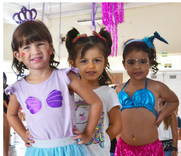
Resgatar o carnaval de salão é a proposta do Grêmio Cultural para este ano. Destaque para as tradicionais marchinhas para os adultos na noite de sábado e segunda-feira. A criançada também ganha atração exclusiva nas matinês no domingo e terça-feira.