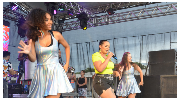
A Banda Reprise comandou as matinês e as noites de festa no domingo e terça-feira.