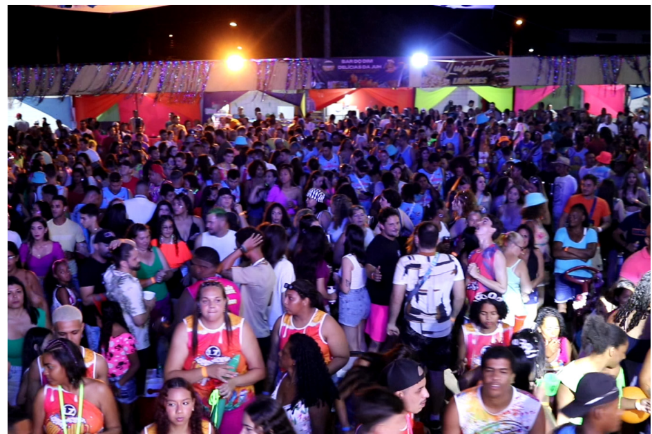
Ao som do axé, funk, pagode e muito mais os DJs agitaram o Jaba Folia.