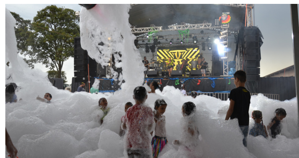
A criançada se encantou com os canhões de espuma durante a matinê no Recinto.