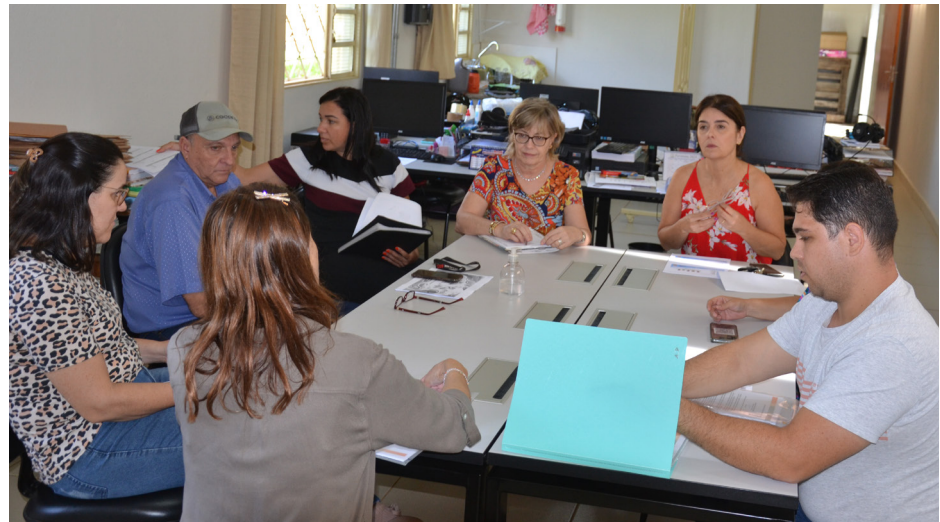
O projeto foi tema de encontro das secretarias municipais com os representantes do Comitê.

o projeto atinja 42 mil alunos nos 13 municípios que formam o Comitê. “A primeira atividade do projeto, direcionada aos estudantes do Ensino Fundamental I, é a realização do concurso cultural de desenho para escolha