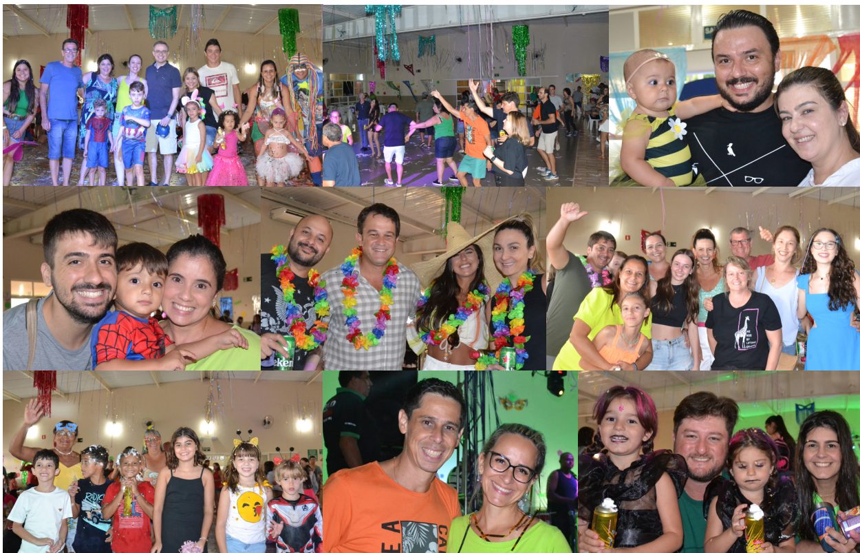
A Diretoria Gremista resgatou o Carnaval de salão e levou para o clube adultos e crianças que se esbaldaram nas duas noites e duas matinês.