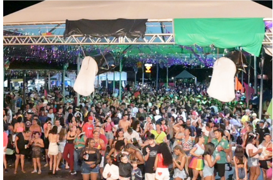
Foliões se esbaldaram no Recinto Municipal durante o Colina Folia.

trocou a praça central pelo Parque de Exposições. Os DJs agitaram os foliões por 5 noites e duas matinês. O concurso de blocos movimentou a festa madrugada afora. Nesta edição mais detalhes sobre o Carnaval.