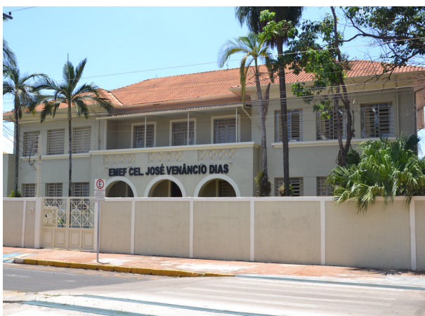
O Polo da Univesp em Colina funciona na Escola Venâncio.

Estão abertas as inscrições para os cursos superiores, na modalidade de ensino a distância, da Univesp. O Polo Colina, que funciona na Escola Cel. Venâncio, oferece 30 vagas.