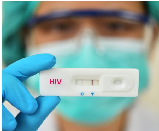
Casos de HIV triplicam em Colina.

pessoas sexualmente ativas precisam se proteger. Preservativos masculinos, femininos e gel lubrificante estão constantemente à dis-