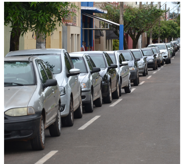
Segundo dados da Secretaria da Fazenda, Colina tem 7.097 veículos que pagam IPVA.

Colina tem uma frota de mais de 7 mil veículos e isso vai gerar cerca de 8,5 milhões de reais para o município. Jaborandi arrecada cerca de 3 milhões com o imposto com seus 2.465 veículos. Pág. 3