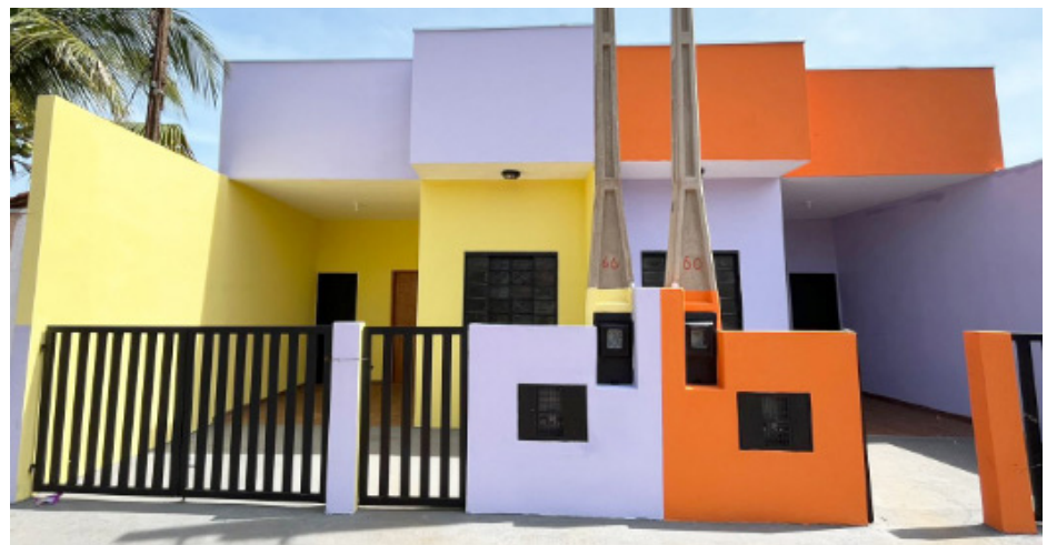
Casas construídas pelos alunos do Projeto Curumim e que serão entregues às famílias na tarde de hoje.

Com estas novas moradias, já são quatro famílias contempladas pelo “Casa dos Meus Sonhos”. O projeto conta com o apoio da Secretaria Estadual de Habitação.