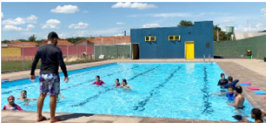
Aula de natação na piscina da Escola Olinto tem atraído as crianças.