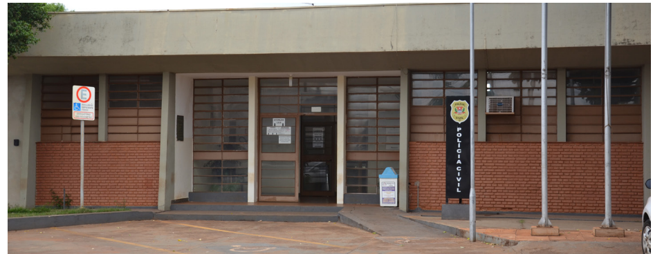
Prédio da Delegacia de Colina que tem a cadeia aos fundos.

O Ministério Público instaurou inquérito civil para apurar a superlotação na cadeia pública. Segundo apurado pelo Poder Judiciário, em abril de 2022, o local abrigava