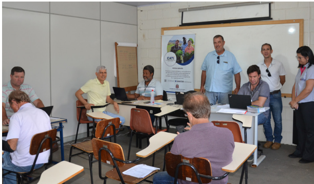
Técnicos atendem produtores que cadastraram a propriedade no sistema eletrônico.

O cadastramento, que é a regularização da propriedade, facilita a vida do produtor já que evita restrições quando da solicitação/renovação de empréstimos e na regularização/transfêrencia de imóvel junto aos cartórios.