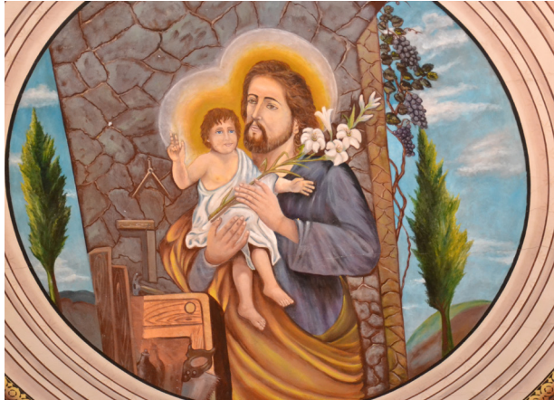
Pintura de São José com o menino Jesus na matriz.