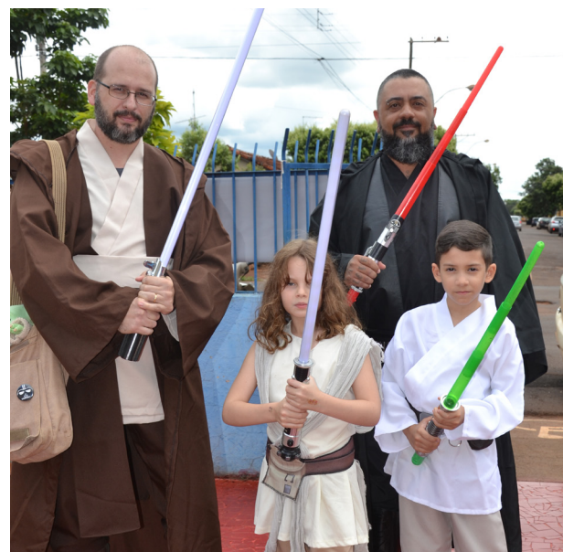
O Geek Fest de Jaborandi, no último domingo, atraiu pessoas de toda região que desfrutaram das novidades tecnológicas, inovação e cultura pop. A mania do "Cosplay" (caracterizar-se como os personagens preferidos) também foi um atrativo à parte no festival. O público aprovou e já pediu a próxima edição.