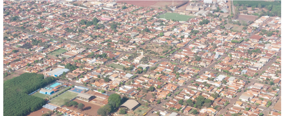
Vista área da "Boa Terra" Jaborandi que completa mais um ano de história.

Para comemorar o aniversário de 74 anos de Jaborandi, a prefeitura elaborou uma programação esportiva que acontece neste final de semana.