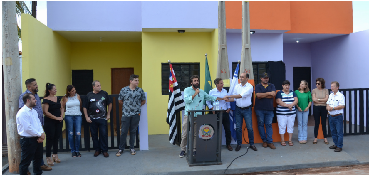
Fachada das duas casas que foram entregues às famílias contempladas.

que recebeu aplausos do público que tomou conta da praça da Bíblia.