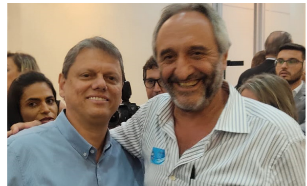
Dieb encontrou-se com o governador Tarcísio em Rio Preto.