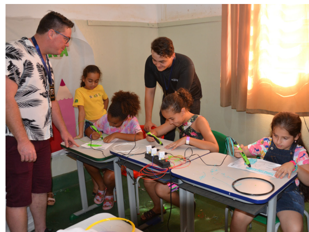
Crianças desenham com canetas 3D e transformam a criatividade em objetos. Robótica, games e pilotagem de drone também ilustraram o universo dos geeks.