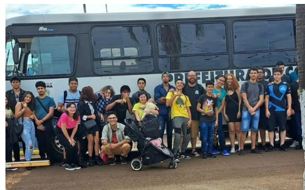
Alunos das oficinas da Associação A Rede que prestigiaram a feira de tecnologia e cultura geek que movimentou a Escola Olinto, em Jaborandi, no domingo. Estudantes da Rede Municipal e jovens da comunidade também fizeram parte da galera que lotou o ônibus, cedido pela prefeitura.