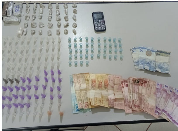
Drogas e dinheiro apreendido com traficante preso pela PM.

Na noite do dia 7, na Rua 13 do Nosso Teto, para despistar a polícia um traficante, de 33 anos, “dispensou” uma sacola na lixeira e adentrou um estabelecimento, onde foi abordado pelos policiais que apreenderam em seu poder a quantia de R$ 569,00. A sacola continha 101 cápsulas de cocaína, 44 de crack e 39 porções de maconha. Ele foi apresentado na central de flagrante em Barretos, onde teve a prisão ratificada pela autoridade policial.