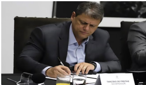
Governador Tarcísio sancionou lei que obriga cartórios a disponibilizar certidões de óbito, nascimento e casamento em braille.