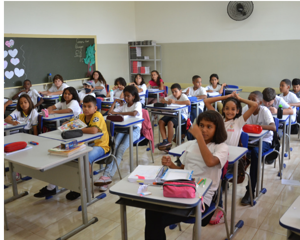
Alunos de Colina vão participar do Concurso Cultural “Acqua Titãs”.

O super-herói criado pelo aluno ou pela aluna deve identificar o seu município apresentando características de sua tradição folclórica e artística, inspirando-se em fatos históricos e culturais relacionados ao contexto ambiental