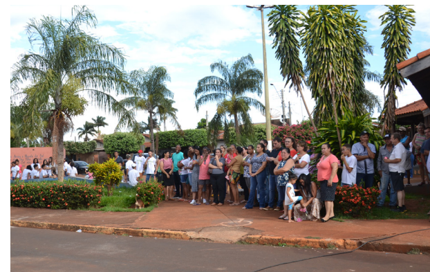
O público tomou conta da Praça da Bíblia e também se emocionou com o acontecimento.