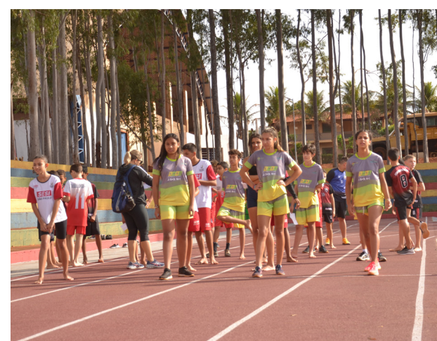
Atletas na pista de alto rendimento construída pela prefeitura no centro esportivo.

O evento esportivo acontece simultaneamente à corrida de rua e todas as modalidades esportivas serão no Centro Esportivo, que possui uma pista de alto rendimento construída pela prefeitura.