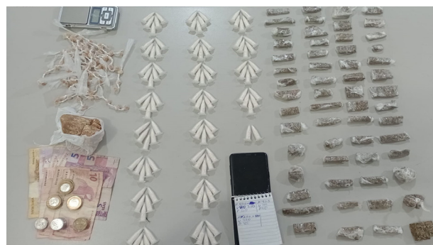
Drogas apreendidas com adolescente de apenas 16 anos na Vila Guarnieri.

mente, esta realidade está bem perto de nós. Um adolescente de 16 anos, morador da Vila Hípica, que já tinha sido conduzido à delegacia para averiguação de tráfico no dia 5, foi pego dois dias depois na Vila Guarnieri com maconha, cocaína e crack. O menor foi detido e conduzido à Fundação Casa.