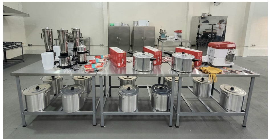
Ampla e moderna cozinha industrial está disponível para os cursos no Projeto Cozinhamento.