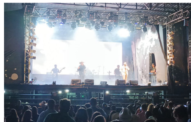
A arena de rodeios foi tomada pelo público que prestigiou e cantou junto os sucessos das duplas que se apresentaram durante a festa jaborandiense.