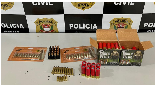
Munições, de diversos calibres, apreendidas na casa de investigado em Barretos.

A Polícia civil, por meio da delegacia de Colina, apreendeu 105 munições intactas, de diversos calibres, que não tinham comprovação de legalidade. Os projéteis, que estavam numa casa de Barretos, pertencem a um investigado por violência doméstica, de 43 anos, que não foi encontrado na residência no momento do cumprimento dos mandados de busca e apreensão na última sexta-feira, 5. As investigações começaram quando a ex-companheira, moradora em Colina, relatou à polícia as ameaças e perseguições sofridas. A justiça deferiu também as medidas protetivas em favor da vítima.