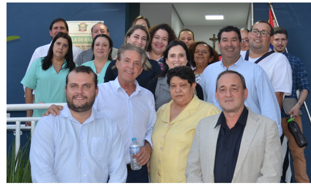
Autoridades fizeram questão do registro juntamente com parte da equipe de funcionários do hospital.