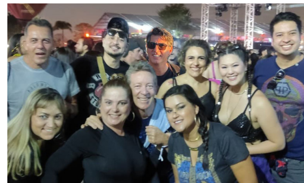
As diversas atrações do Festival João Rock, que completou 20 anos em grande estilo, atraiu uma multidão a Ribeirão Preto no último sábado e é lógico que galera colinense também marcou presença.