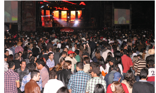
Público prestigia show com portões abertos de Eduardo Costa no dia 9/7/2012 que, segundo sentença, a prefeitura pagou à contratante R$ 135.000,00, porém a empresa contratada pagou efetivamente pelo evento R$ 77.000,00.