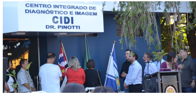
A solenidade inaugural foi prestigiada por autoridades, convidados e público em geral.

Depois dos discursos foi feito o descerramento das placas inaugurais na presença das autoridades, convidados e público em geral.