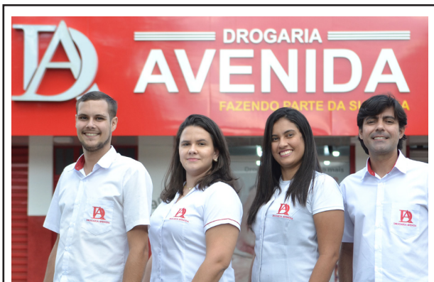
A Drogaria Avenida está de plantão a partir deste sábado e por uma semana, até o próximo dia 16, funciona até às 21h. A equipe está pronta para atender os colinenses presencialmente ou por telefone. É só ligar 3341-2168 ou 99711-9183 para receber seu medicamento em casa, com todo conforto e rapidez.

O mês junino tem festança boa no Asilo São José, que começa hoje e vai até sábado com delícias típicas, torneio numérico, muita diversão e alegria. O evento acontece na rua em frente à entidade. Compareça!