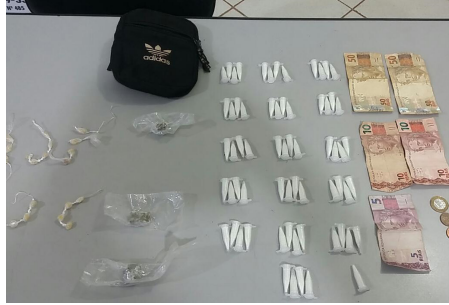
A traficante foi presa com crack, maconha, cocaína e uma quantia em dinheiro.

Uma mulher, de 22 anos, foi presa em flagrante por tráfico de drogas na tarde do dia 24, próximo a um trecho de mata no Patrimônio onde a indiciada fazia a venda do entorpecente. Além da quantia de R$ 126,25 foi apreendido em seu poder 3 invólucros de maconha (12,5g), 22 pedras de crack (4,2g) e 65 cápsulas de cocaína (81,3g). Os PMs Rezende e Coquelet conduziram à autora ao plantão policial em Barretos, onde permaneceu recolhida até a transferência para a cadeia feminina de Bebedouro.