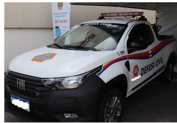
As ações de combate a incêndios ganharão mais agilidade e eficiência com os equipamentos e o novo veículo da Defesa Civil Municipal.