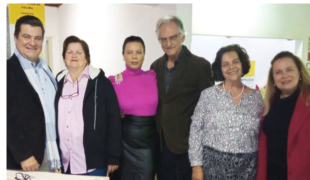
Os rotarianos recepcionaram na noite de sábado o público que degustou a 1ª Paella Caipira promovida na sede do clube, que ficou repleta. O ambiente agradável, com som ao vivo, agradou quem fez parte do evento gastronômico.