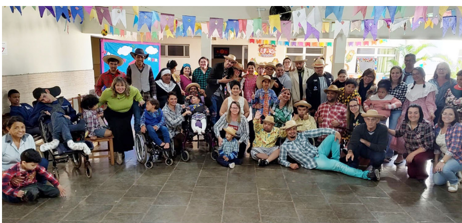
Os alunos da Apae dançaram e se divertiram muito com a festa junina realizada dia 22, nos dois períodos. Os professores, direção, funcionários e alunos se vestiram a caráter para dançarem a quadrilha e curtir a festança. É claro que teve muitas delícias típicas para degustar.