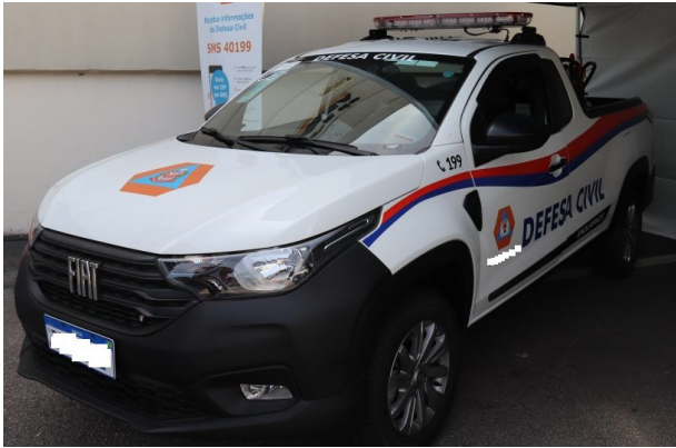
O município foi contemplado com uma viatura equipada para a Defesa Civil.

O prefeito Silvinho esteve em São Paulo na semana passada onde assinou convênio com a Defesa Civil Estadual e ganhou uma viatura totalmente equipada para combater incêndios e outros serviços. Ele esteve com o governador Tarcísio e agradeceu a atenção dispensada ao município. Pág. 8