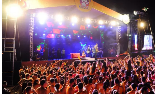
Atrações diversas e renomadas vão se apresentar no palco principal.

de Esportes e Turismo, também nas cidades da região e pelo site www.saudtickets.com.br .