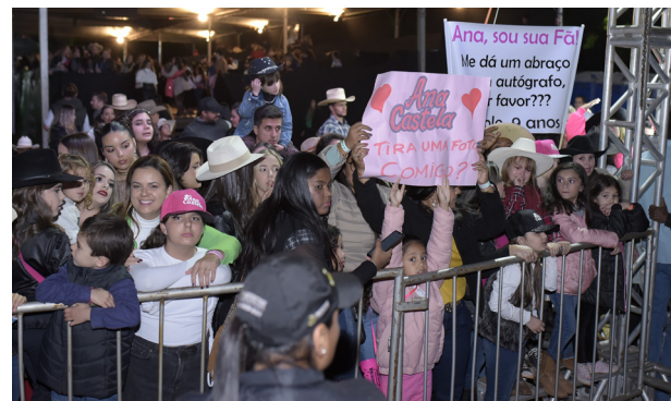
A galera teen fez festa para Ana Castela e provou que o fã clube da “Boiadeira” cresce todo dia. A cantora retribuiu o carinho e soltou a voz, interagiu e ganhou aplausos.