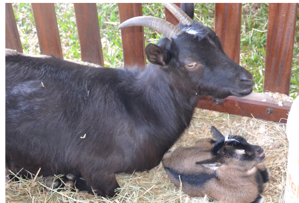
A criançada e o público tiveram uma surpresa com o filhote de cabritinho que nasceu na feira de mini animais durante a festa.