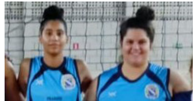
As duas jogadoras que foram campeãs por Viradouro.