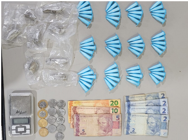
Maconha e cocaína apreendidas com traficante do Patrimônio.

Uma ciclista de 42 anos foi presa em flagrante na madrugada do dia 23, na Rua 1 do bairro Colina F. Ela transportava 4 cápsulas de cocaína (8,5g), 15 pedras de crack (9,2g) e R$ 534,00 em dinheiro. A ocorrência foi apresentada no plantão policial e a indiciada conduzida à cadeia de Bebedouro.