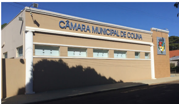
Prédio da Câmara Municipal.