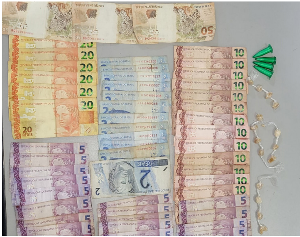
Dinheiro e drogas encontrados com ciclista presa no bairro Colina F.

A PM prendeu na tarde do dia 17, na Rua Luiz Gustavo C. Cubas – Patrimônio, um traficante de 25 anos. Ao todo foram apreendidos com ele e no quintal da residência 64 cápsulas de cocaína (90g), 9 invólucros de maconha (37g), balança e R$ 50,00 em dinheiro. Os PMs Neves e Almeani o conduziram ao plantão policial, onde permaneceu preso até a transferência para a cadeia local.