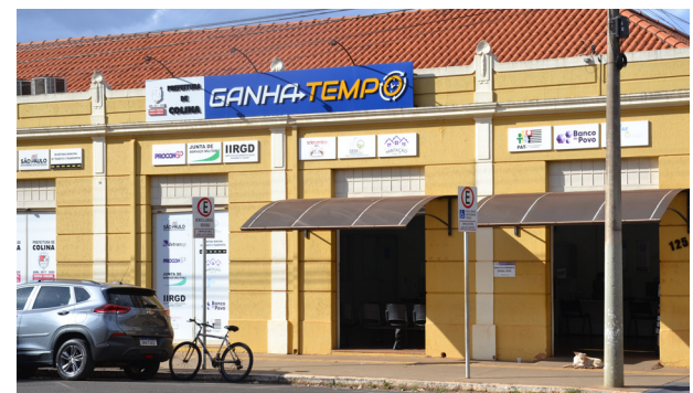
Fachada do Ganha Tempo na Av. Ângelo M. Tristão.

Os agendamentos devem ser feitos no site da Prefeitura (colina.sp.gov.br); também acessando o link ( https://www.aeti.com.br/gt/col/itrfc_client/Form/etapa1.php?setor=3 ), ou ainda apontando a câmera