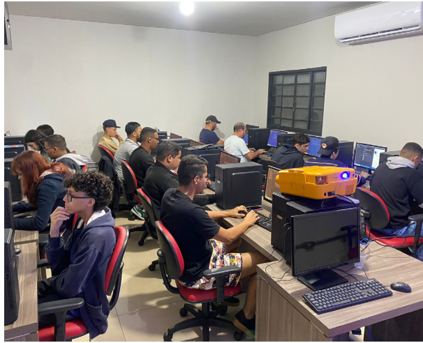
A grande procura pelos cursos do Ctech deixam as turmas lotadas.

O curso de Desenvolvimento Web e Web Apps é um dos mais procurados. “Os alunos mergulham no mundo da programação e aprendem linguagens modernas e ferramentas essenciais para