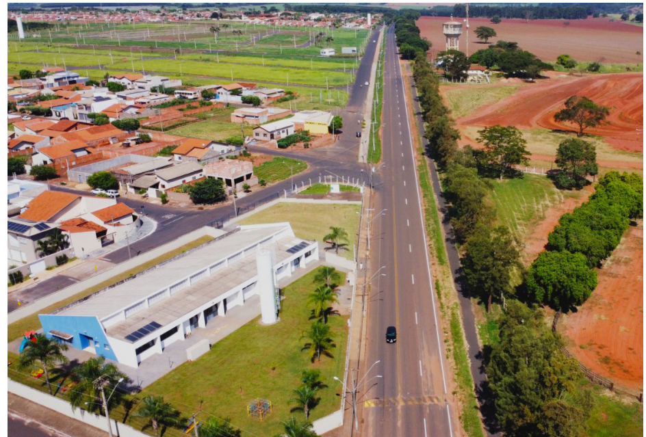
Foto aérea mostra toda extensão da 3ª faixa concluída ao lado da vicinal.