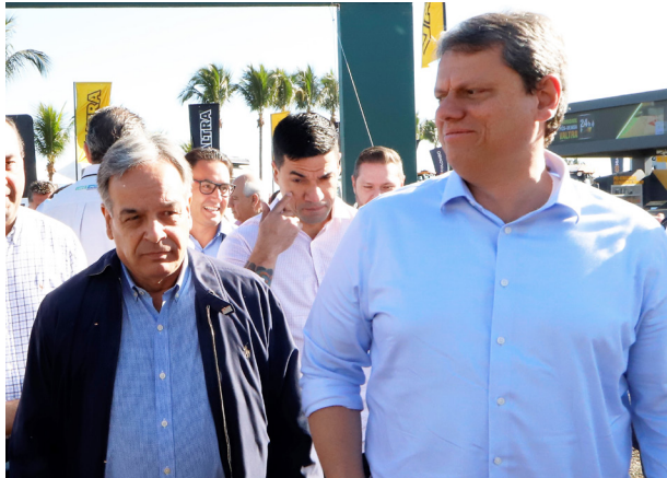
Secretário Antônio Júlio e o governador Tarcísio na feira de agronegócios.

e secretário Renê na feira agrícola de acompanhar a visita das autoridades Bebedouro.