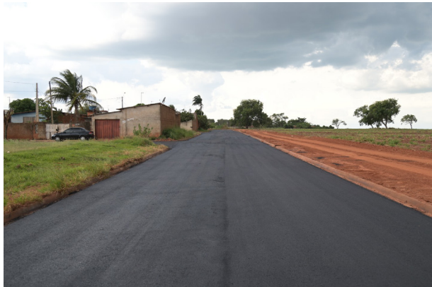
Rua 17 da Vila Guarnieri está asfaltada.

“Estamos trabalhando para melhorar as condições de mobilidade urbana em nosso município, levando estes benefícios a todos os bairros para proporcionar melhor qualidade de vida a todos os colinenses”, destacou o prefeito Dieb.