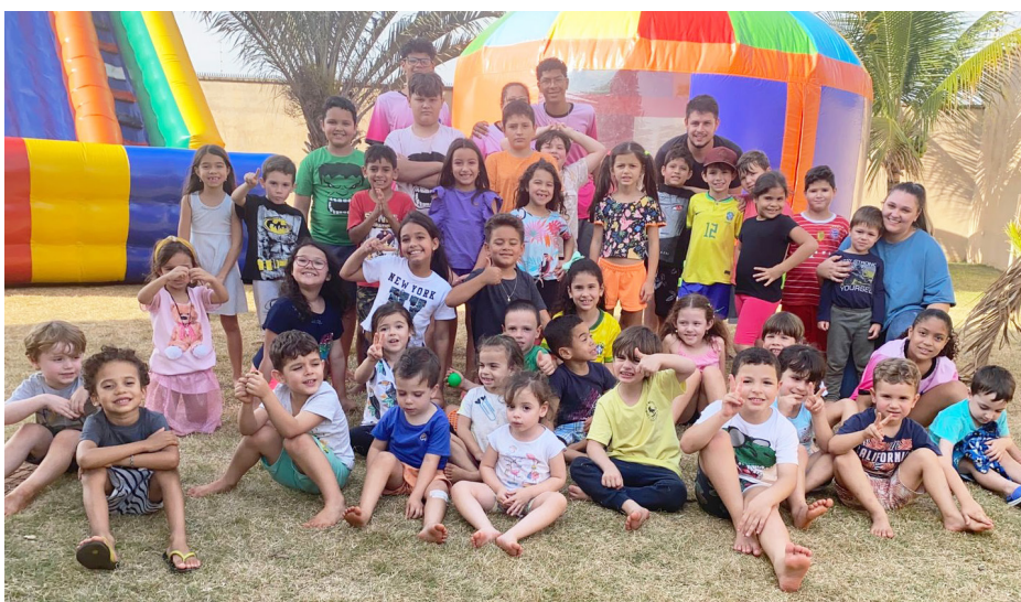
A Hill School promoveu em parceria com a BK Brinquedos a 2ª edição da sua colônia de férias, que reuniu cerca de 40 crianças, que se divertiram muito por vários dias nas diversas atividades, gincanas e brinquedos infláveis. A foto é do encerramento com o "Dia do Cabelo Maluco". Em dezembro tem mais!