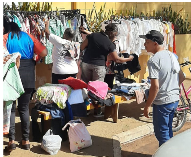
A iniciativa tem atraído muitas pessoas.

possam escolher as peças de acordo com suas necessidades.