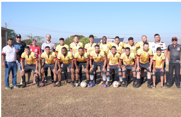
Equipe da Dirce campeã do torneio de bairro.

Este é o 2º título conquistado pela Dirce este ano, o primeiro foi no torneio society do Colina Atlético. O time se prepara para o Campeonato Varzeano, do qual foi campeão por duas vezes.