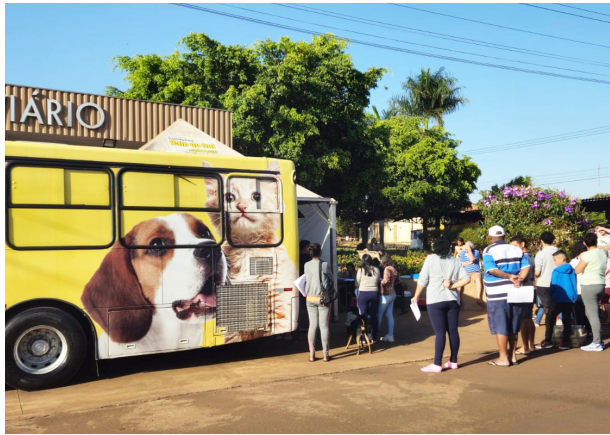
Castramóvel esteve em Jaborandi nos dias 5 e 6.