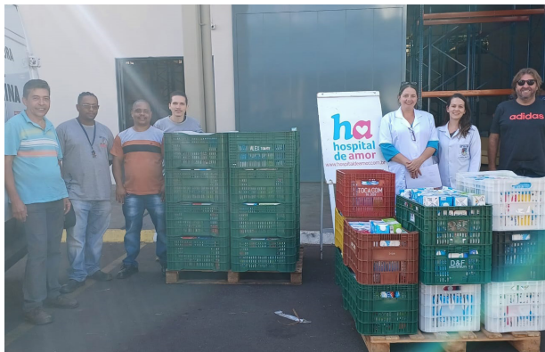
Caixas com o leite doado ao hospital barretense.