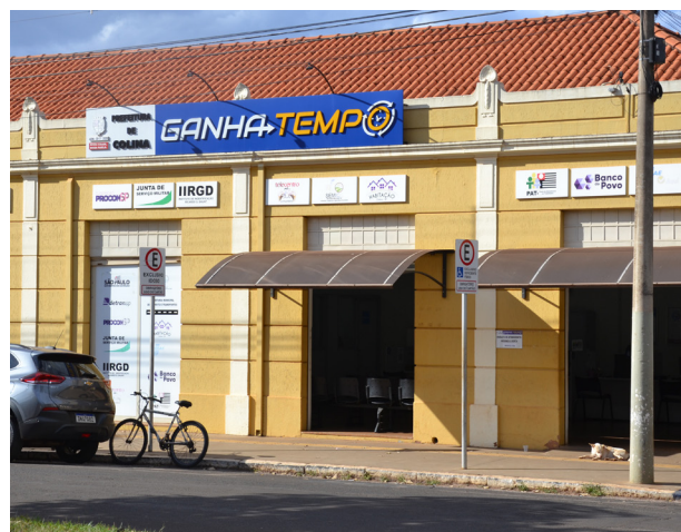
Consumidores interessados em aderir ao Programa Renegocia! devem procurar o Procon no Ganha Tempo.

O programa Renegocia!, criado pela Secretaria Nacional do Consumidor, que propõe a renegociação das contas atrasadas, tem atraído muitos brasileiros para saldarem suas dívidas.