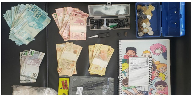
Apreendidos na casa de traficante no bairro Colina F.

Durante cumprimento de busca e apreensão na Rua Luiz Gustavo C. Cubas – Colina F, os policiais civis Thalles e Leonardo encontraram diversos aparelhos utilizados no tráfico de drogas na sala da residência do indiciado, de 21 anos, que foi preso em flagrante na tarde do dia 2. Além da caderneta e bloco com anotações da venda de entorpecente, foram apreendidos uma porção de maconha (1,04kg), um microtubo com crack (57g), 74 embalagens vazias usadas para armazenar drogas, a quantia de R$ 2.230,00 em dinheiro e um celular que está sendo vistoriado pelo Setor de Investigações Gerais da unidade policial. O delegado Gustavo Coelho, que solicitou o mandado de busca e apreensão à justiça, disse que o indiciado já tem passagens pelo mesmo crime. A operação contou com apoio da PM.