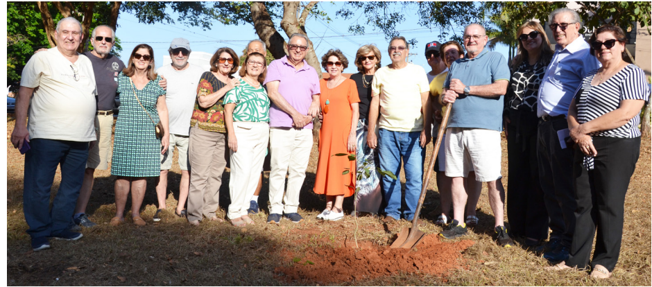
Parte dos amigos da “Turma do Trem” fizeram plantio de árvores em comemoração ao encontro festivo.

A nostalgia foi o grande destaque do encontro da “Turma do Trem” que aconteceu no sábado, 5, no espaço de eventos Dubai. Antes