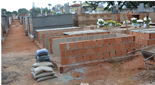
Espaço remanescente da última ampliação em 2017, tem apenas 12 túmulos (tipo gaveta) disponíveis.

tamentos. Dieb pediu bom senso aos vereadores e disse que a prefeitura não quer causar prejuízo a ninguém. Pág. 3