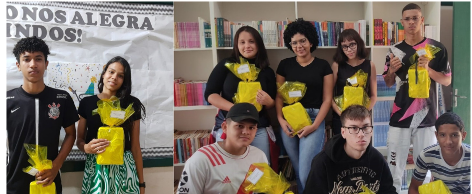
Estudantes da Escola Darcy premiados na CUCO, competição de conhecimentos promovida pela USP.

A CUCO é um projeto do Programa de Difusão Científica da USP, denominado “Vem Saber” e conta com apoio do Instituto de Física da USP de São Carlos, em parceria com a Secretaria Estadual de Educação, Centro Paula Souza e das 91 Diretorias de Ensino do Estado.