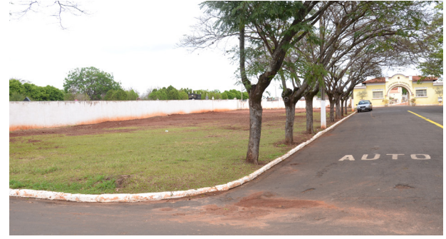
Na área ampliada em 2017 tem apenas 12 túmulos disponíveis.