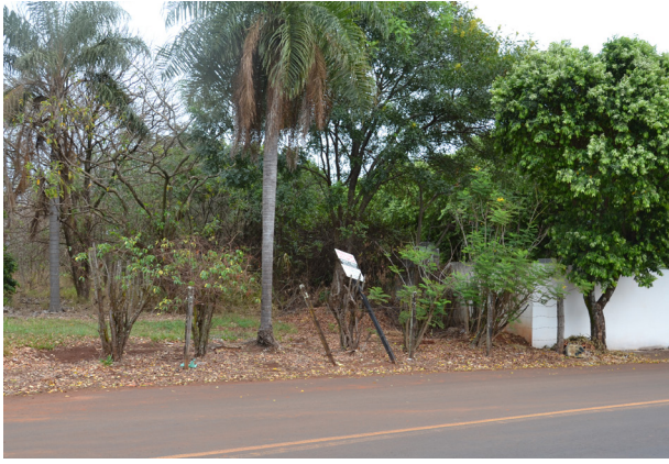
Ampliação do cemitério aconteceria em área de mata da Fazenda Baixadinha, que fica na divisa com o muro.

O documento mostrou uma área de 10.759,66 metros quadrados