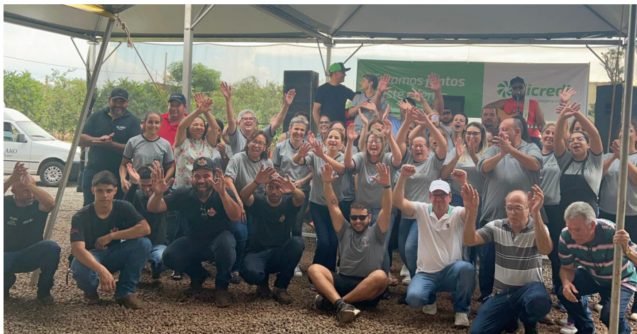
A direção/funcionários da Apae e colaboradores comemoram o sucesso do almoço beneficente realizado no último domingo, que teve um grande número de adesões e participantes.