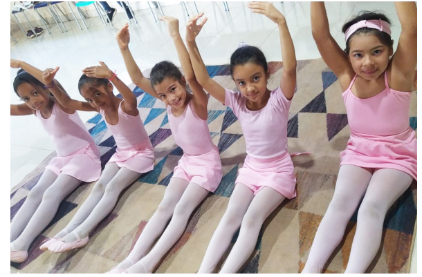
O potencial artístico das crianças tem sido revelado na prática do ballet.

em faixas etárias e as aulas têm duração de aproximadamente uma hora. Mais informações com a professora pelo fone 99197-2798.