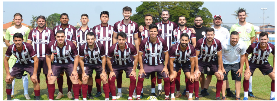
Primavera, campeã de 2022, vem com tudo em busca do bicampeonato do Amador.

Outro time que promete empenho para por a mão na taça é a Nova Colina que foi vice em 2022. A novidade fica por conta do retorno da Pedreira. Pág. 7