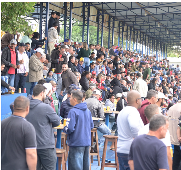
Com onze times em campo o Amador 2023 promete disputas acirradas que vão levar muitos torcedores ao Colina Atlético, palco dos clássicos. Na estreia o campeão Primavera pega o AC1, às 10 horas.

Na grande final não há vantagem. Em caso de igualdade a decisão vai para a prorrogação e man-