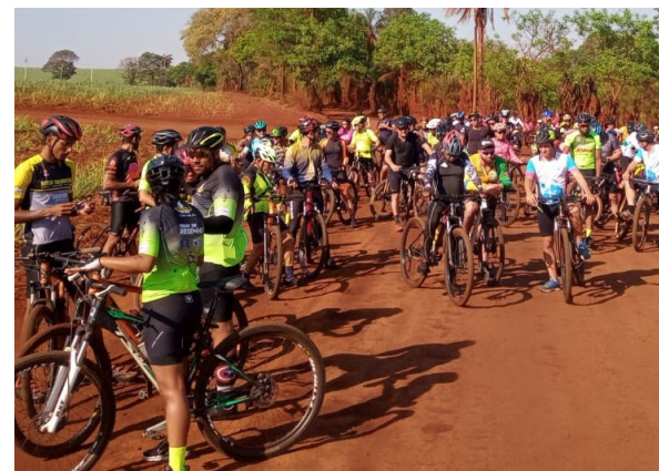
Ciclistas no percurso até Jaborandi, todo em estrada de terra.

dou 150 litros de leite que serão doados à Apae pelo grupo de ciclistas, que sempre dá um sentido social aos eventos para ajudar as entidades.