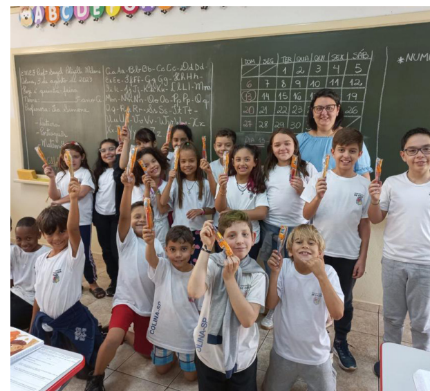
Alunos com escovas e cremes dentais distribuídos na campanha.

Nas palestras os cirurgiões dentistas reforçaram a importância da higiene bucal, da alimentação saudável e ensinaram o método correto de escovação.