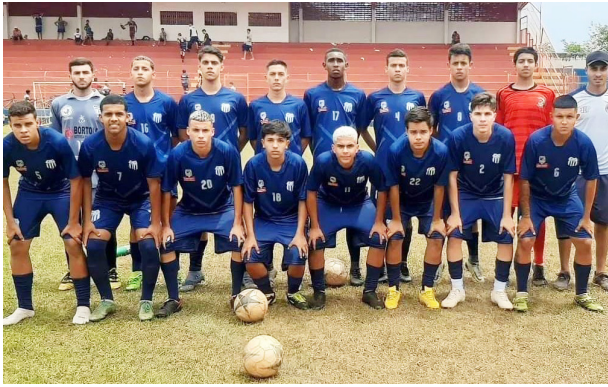
Equipes sub 17 que venceu o Grêmio Olimpense (1x0) e foi campeã.

“Fábrica de Craques”, de Guaíra. Mais fotos no site.