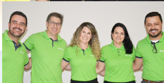
Representantes dos bancos participantes que apresentaram as linhas de crédito e fizeram bons negócios.