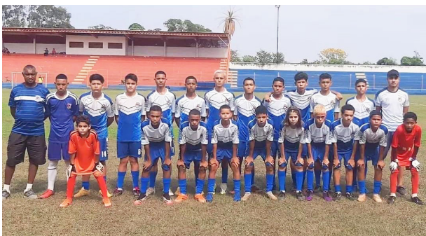
O sub 13 perdeu do Grêmio Olimpense por (2x0) e ficou com o vice-vicecampeonato.