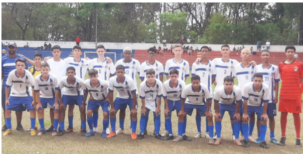
Os campeões no sub 15 que ganharam dos anfitriões na final (1x0).