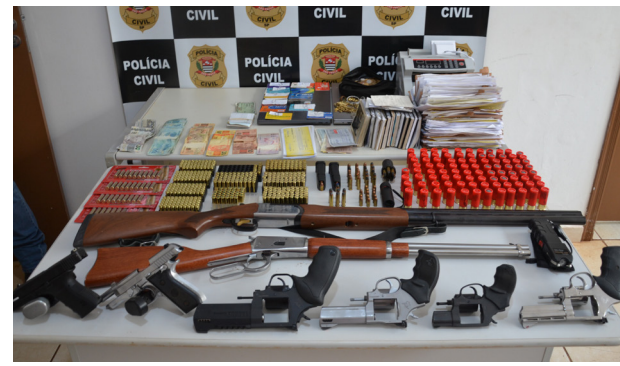
Armas, munições, dinheiro, documentos, contadora de cédulas e demais itens apreendidos na operação.

O guincho foi solicitado, mas a quantidade de veículos foi tão grande que foi necessário o deslocamento por mais de uma vez. O “comboio” com os veículos levados até a delegacia despertou a curiosidade de quem estava na rua. As três camionetes Ram 2500,