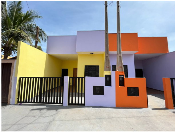
Modelo das casas entregues às famílias carentes já beneficiadas pelo projeto.

“Na primeira etapa, que prevê a construção de 9 casas, os materiais necessários foram obtidos através de convênio com a Secretaria Estadual de Habitação, fortalecendo o projeto e tornando o sonho da casa própria possível para diversas famílias”, destacou o