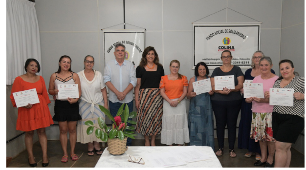
Concluintes do curso de costura.