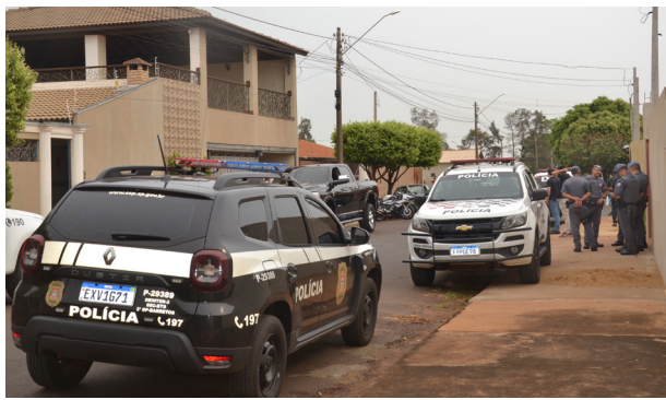
Policiais civis e militares em frente aos imóveis vistoriados.

A Polícia Civil de Colina comandou a ação que contou com apoio da Força Tática, integrantes da DIG, Central de Polícia Judiciária de Barretos e Canil com o cão farejador Cronus que vasculhou um terreno.