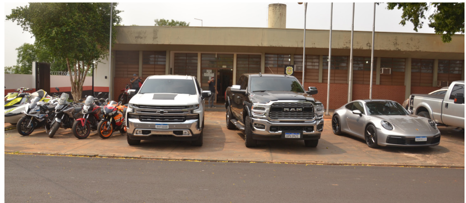
Porsche, camionetes e motos apreendidos ficaram expostos em frente à delegacia.