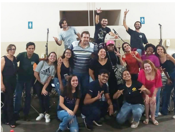
Integrantes da banda de rock BSK8 que teve um final de semana movimentado. Na sexta o show foi para a turma de administração do Imesb, em Bebedouro e no sábado em Jaborandi.

NATAL DO SHOPPING - Papai Noel chega amanhã, dia 3, ao North Shopping para a inauguração da decoração natalina. O centro de compras preparou uma programação especial com muitas atrações para a festa de boas-vindas ao bom velhinho, que começa a partir das 15h com a distribuição de pipoca e guloseimas ao público.