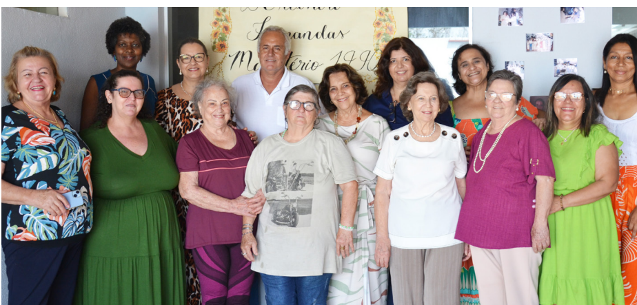
A formatura no magistério, cursado na "Lamounier de Andrade", foi há 33 anos, mas a turma de 1990 se reuniu novamente no sábado para o 2º encontro, que teve a participação das alunas, professoras e diretora da época. Foi bom demais!