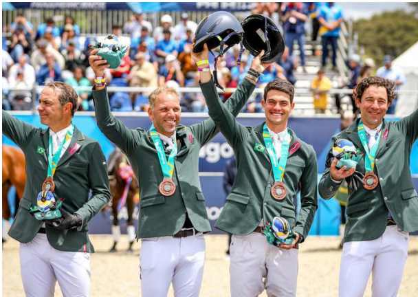
Equipe brasileira que conquistou vaga para Paris/2024.

nominal para os Jogos Olímpicos ainda serão divulgados. Os conjuntos buscam vaga até junho de 2024.