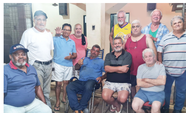
Parte da turma da extinta Telesp e amigos de Colina que se reuniram no final de semana em Jaborandi após 25 anos. O reencontro foi regado de muita alegria, bate-papo e de lembrar os bons tempos em que trabalhavam juntos