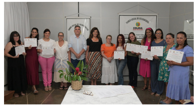
Participantes da "Costura Avançada" com os certificados.