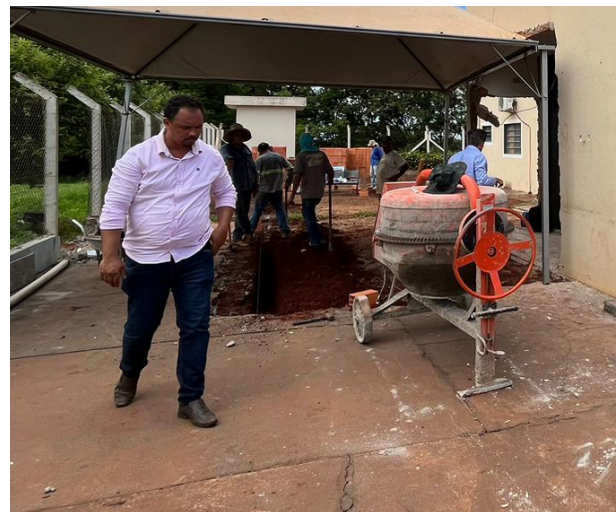
Funcionários trabalham nas obras de reforma e ampliação da unidade de saúde.