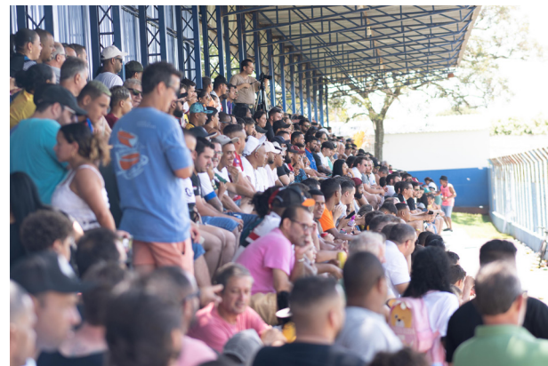
A torcida tomou conta da arquibancada para acompanhar a final no domingo.