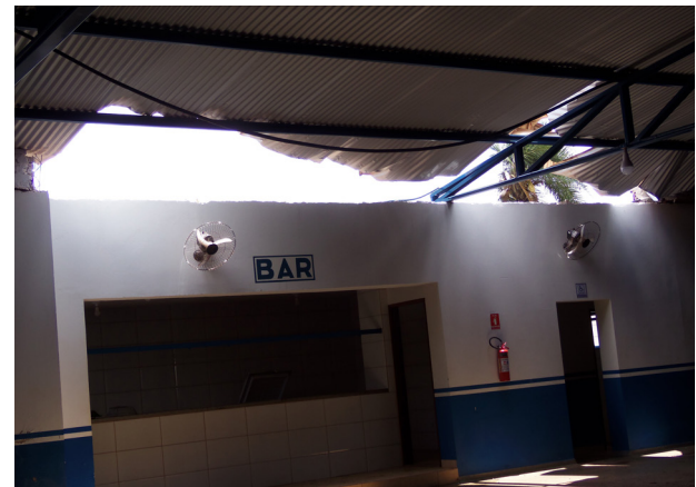
O temporal arrancou as telhas deixando um vão aberto na parte social do “Tigre do Vale”.

estrutura que segura as redes do campo lateral cedeu e um pedaço do muro terá que ser refeito”.