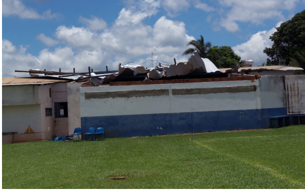
Telhado da sede social do Colina Atlético ficou retorcido e exaustores eólicos quase atingem casa vizinha.

Uma palmeira plantada em frente a uma casa na Rua Marechal Deodoro, ao lado da Casa Brasil Materiais