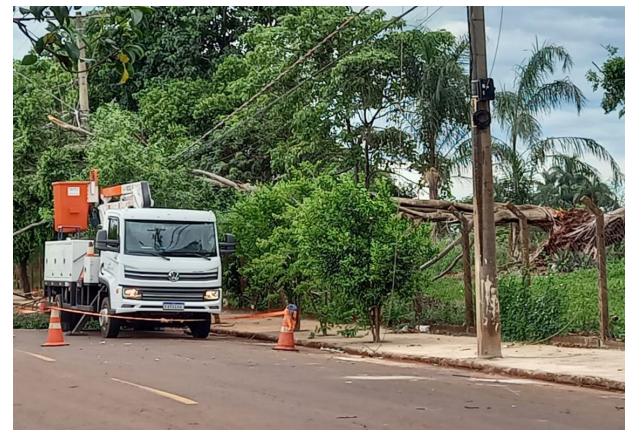
Funcionários da CPFL trabalham na manhã de segunda-feira para restabelecer energia no Jardim Hípico após queda de árvore na rede elétrica.