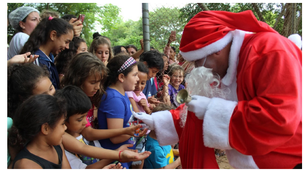
Papai Noel faz a alegria das crianças na festa deste domingo.

A festa começa às 14h30 com muitas atrações, inclusive shows da dupla José & Moura e da cantora Lavínnia Buttini, de Barretos, com início a partir das 17h. Além dos diversos brinquedos, as barracas estarão distribuindo picolé, refrigerante, pipoca, algodão doce e sacolas surpresas com muitas delícias para a criançada.