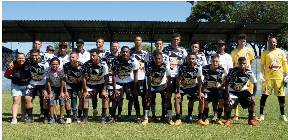
Equipe do Patrimônio que foi vice campeã.