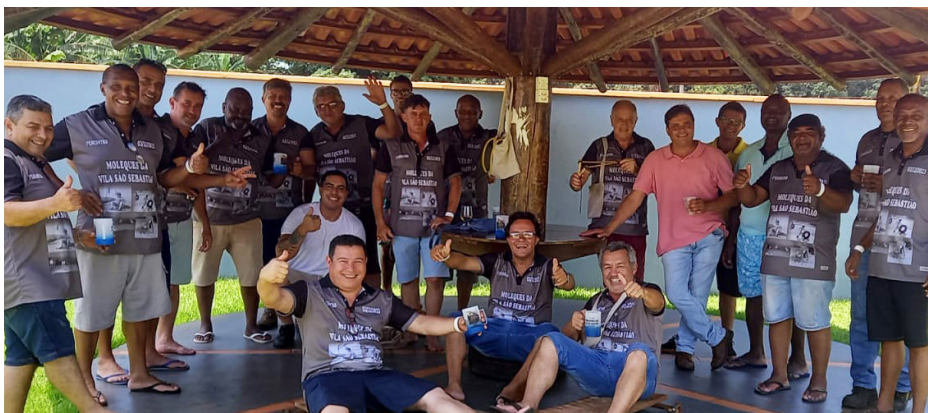
A turma de amigos, denominada "Moleques da Vila São Sebastião", que passou a infância/adolescência juntos no bairro, promoveu um encontro no último dia 3, na Estância Country. Boas recordações e muitas saudades fizeram parte do evento que reforçou a amizade da turma.