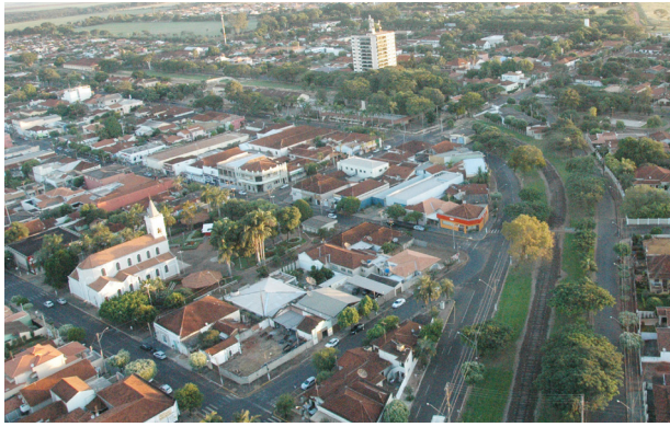
Vista aérea da cidade que terá orçamento mais enxuto em 2024.

O orçamento de 2024, que estima a receita e fixa a despesa em R$ 151.645.000,00, foi aprovado de forma unânime pelos vereadores. O valor representa uma queda de 0,68% comparado ao orçamento deste ano, de R$ 152.682.000,00. A diminuição se deve a queda na arrecadação do município.