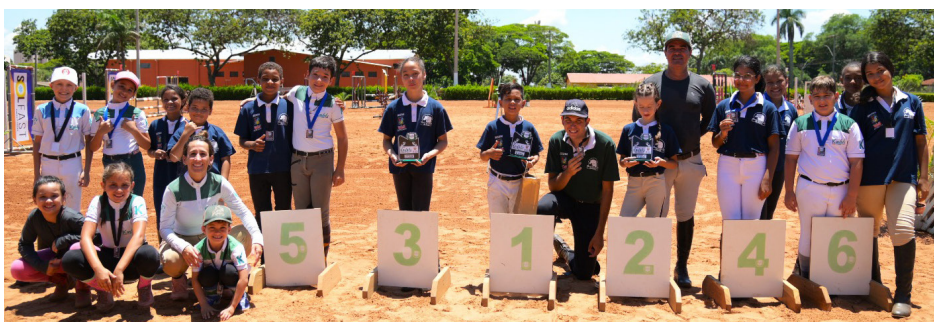
Alunos da Escola Kavalu e Projeto Equitação Educativa que participaram da prova.

Ruan/ HG Charlotte ficou em 1º (1,10m) e Antônio H. Paro Marques/Curly Girl C. Jmen, da Escola Kavalu, foi campeão no 1,20m. Confira no site a relação de todas as categorias.