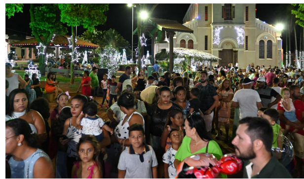
Um grande número de pessoas tomou conta da praça na noite de sábado.