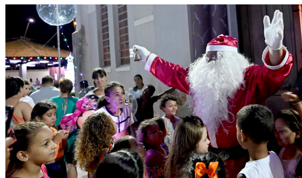
As crianças cercaram o Papai Noel quando da sua chegada na praça central.