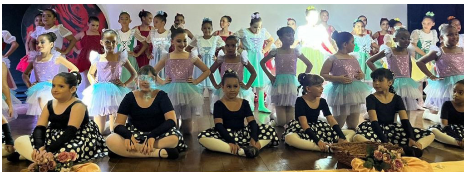
Apresentações impecáveis do ballet e teatro "Alice no País das Maravilhas" que encantaram o público.