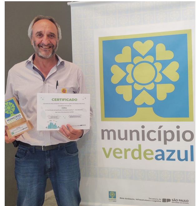
Dieb com o certificado de Município Verde Azul recebido em solenidade no Palácio dos Bandeirantes.

“Esse certificado é o reconhecimento de todo o nosso trabalho e do comprometimento da