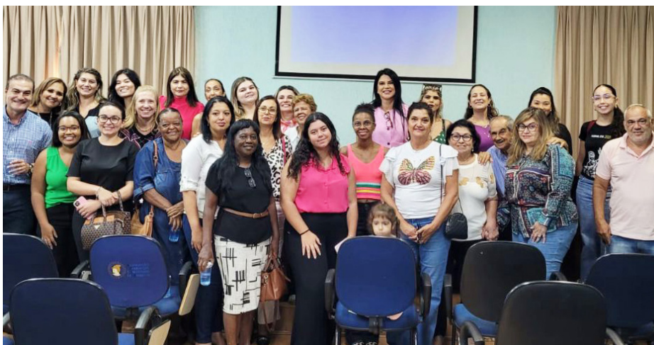
Palestrantes e parte do público participante do "Política pra Elas", evento realizado sábado, dia 24, na Associação Comercial em Barretos, que incentivou a participação feminina no cenário eleitoral. A roda de conversa foi realizada na mesma data do reconhecimento do voto feminino, instituído no Brasil em 1932.