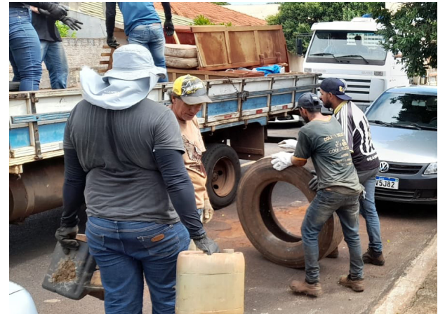
Não tem desculpa, o Ecoponto Itinerante vai até os bairros para coletar diversos tipos de materiais, que podem ser criadouros para o mosquito.

Até o fechamento desta edição foram 191 casos confirmados. A Secretaria de Saúde fechou o cerco contra o mosquito transmissor e tem adotado medidas para evitar a sua proliferação, como o Ecoponto Itinerante em