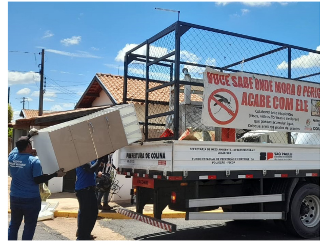
Materiais inservíveis coletados nos bairros recebem a destinação correta para evitar que o mosquito se prolifere e contamine mais pessoas.

No último dia 23, houve o carregamento de pneus no Ecoporto Municipal, para a destinação adequada e sustentável de 698 pneus usados no trabalho de coleta semanal dos últimos meses. Deste total, 153 pneus são de