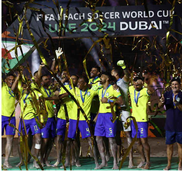
Seleção Brasileira comemora o título em Dubai.