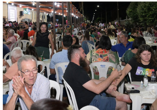
Neste sábado começa mais uma edição da tradicionalíssima festa do padroeiro São José, que será realizada até 24 de março, inclusive no dia do santo (19/3), no Lar Paroquial. Um grande número de famílias prestigia o evento para saborear o clima agradável e as delícias típicas. Prestígie!