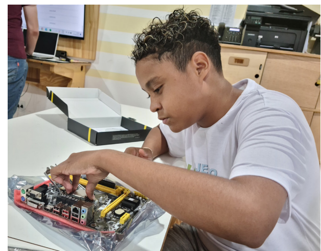
Integrante do projeto que têm várias frentes de atuação, conforme as necessidades e habilidades dos participantes.