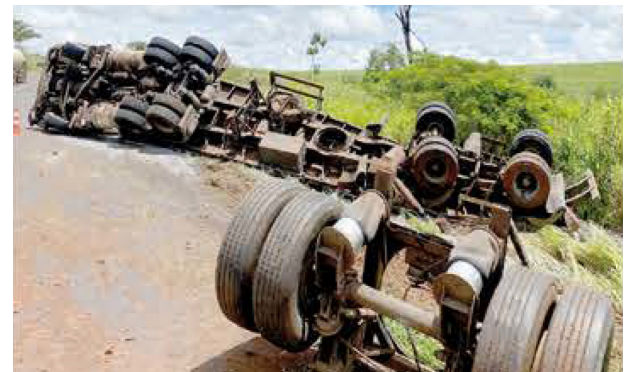
Caminhão capotado no acostamento da Rodovia Assis Chateaubriand.

No último dia 8, um motorista de 38 anos ficou ferido após o caminhão que conduzia na Rodovia Assis Chateaubriand, sentido Barretos/Olimpia, apresentar falha mecânica e capotar no acostamento. O motorista foi socorrido pelo Corpo de Bombeiros com ferimentos e cortes nos braços e pernas, além de reclamar de dores no pescoço.