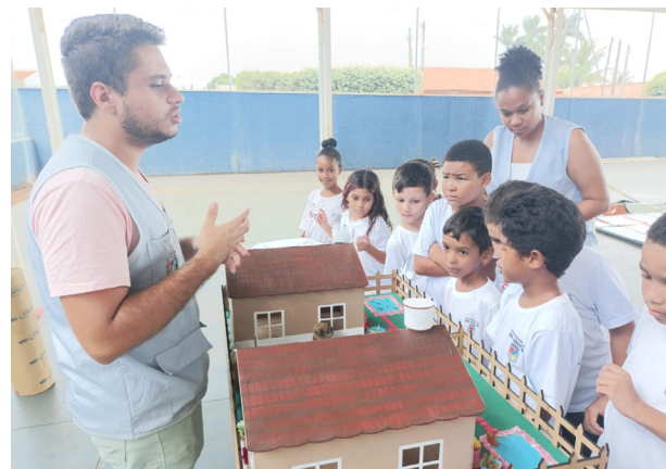
Agente utiliza maquete para mostrar aos alunos o que é certo e errado em casa no combate à dengue.

A Prefeitura, por meio da parceria entre as Secretarias de Saúde e de Educação/Cultura, realizou no último dia 1º o “Dia D” de Combate à Dengue, com diversas ações educativas nas escolas da Rede Municipal de Ensino, como confecção de cartazes sobre o combate à doença, passeata pelo bairro das escolas, palestras educativas, brincadeiras lúdicas e entrega de panfletos de conscientização.