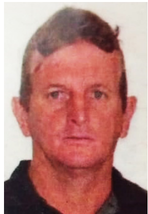
Laerte Izopp assassinado em 2019.

Sentença no primeiro julgamento em 2020. O Tribunal de Justiça de São Paulo deu provimento parcial ao recurso apresentado pelo Ministério Público e um novo julgamento foi marcado em outubro do ano passado, mas foi adiado em razão do réu não comparecer por estar hospitalizado após acidente.