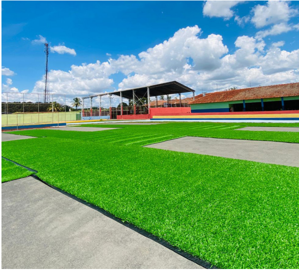
Campo de grama sintética da Escola Olinto será entregue no próximo dia 18.

A prática esportiva na escola ficará ainda melhor com o novo e moderno campo de futebol sintético. “O