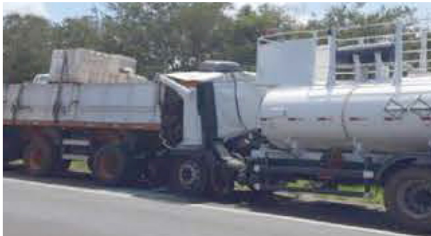
A cabine do caminhão bateu em reboque que seguia no sentido Colina/Barretos.

Um motorista foi retirado das ferragens pelo Corpo de Bombeiros após o caminhão que conduzia bater na traseira de um reboque na Rodovia Faria Lima, em Colina, no último dia 5. O condutor, de 44 anos, com fratura na perna e consciente, foi socorrido pela ambulância da concessionária e atendido na Santa Casa de Barretos. O outro motorista não se feriu.