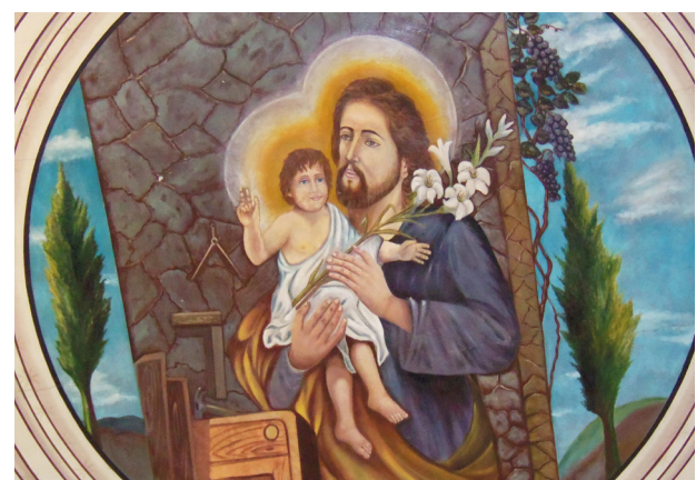
Afresco do padroeiro pintado na igreja matriz

As lojas e repartições públicas estarão fechadas no feriado municipal em comemoração ao padroeiro São José.