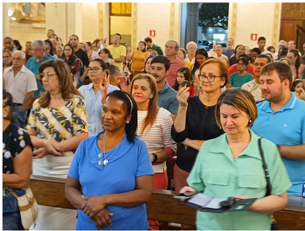
A igreja ficou cheia na celebração do padroeiro dos motoristas.