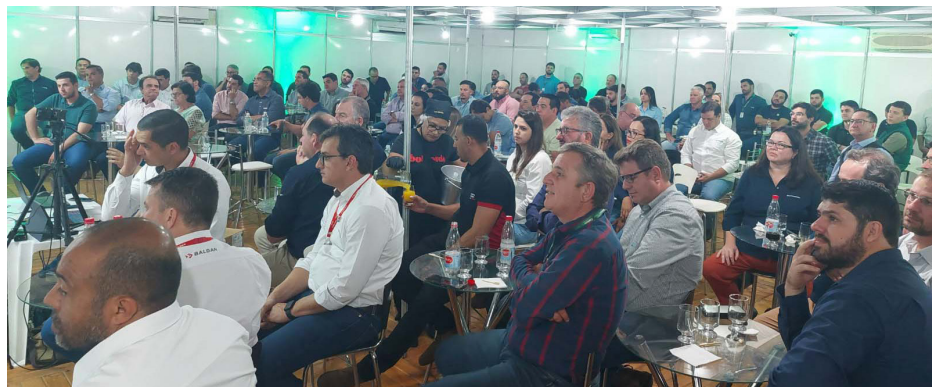
As palestras são um diferencial da feira que tem atraído os participantes.

Termina hoje, dia 1º, a 11ª Feira de Negócios promovida pela Coplana em Jaboticabal. O evento, aguardado por produtores de toda região, inclusive de Colina para programação da nova safra, teve início na terça-feira, dia 30, com duração de três dias.