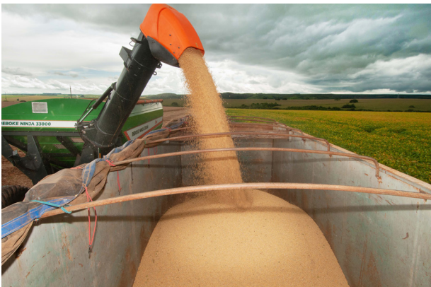
Expor os atrativos que caracterizam Goiás como uma potência no campo foi um dos objetivos da ExpoGoiás, que esteve presente na Festa do Peão. O estande mostrou que o Estado possui o 3º maior rebanho bovino do país, ocupa a terceira posição entre os maiores produtores de grãos de acordo com a última safra, destacando-se também na cana de açúcar. Quem viu se surpreendeu!