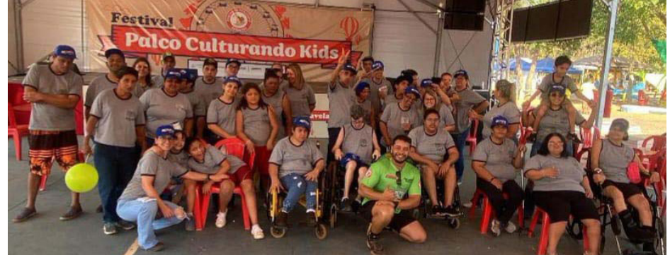
Atividades diversas agitaram a Apae que aderiu a Semana Nacional da Pessoa com Deficiência Intelectual e Múltipla, promovida nacionalmente de 21 a 28 de agosto. Os alunos participaram de muitas atrações, dentro e fora da entidade, que promoveram a integração e a socialização. Diretora, professores e funcionários da Apae com os alunos no Parque do Peãozinho.