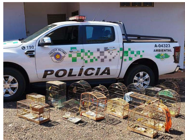
Viatura da Polícia Ambiental com as gaiolas apreendidas na vistoria.