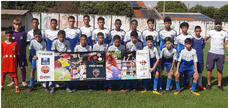
Equipe Sub-14 de Colina que disputa a final da Série Ouro da Copa 3 Rios.

O time Sub-14 da Escolinha de Futebol da Secretaria Municipal de Esportes, Turismo e Lazer disputa sábado, dia 31, a final da Série Ouro da Copa 3 Rios contra Barretos, no estádio Mauricio Goulart, em