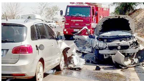
Veículos envolvidos no acidente com duas vítimas fatais da mesma família.

Um acidente na Rodovia Armando de Salles Oliveira, envolvendo quatro carros, resultou na morte de duas mulheres, identificadas como mãe e filha. As duas vítimas, naturais de São Paulo, faleceram ao dar entrada na Santa Casa de Olímpia. O acidente, no trecho entre Severínia e Olímpia, deixou ferida também a condutora de uma SpaceFox, que recebeu atendimento na UPA de Olímpia e mais tarde transferida para a Santa Casa daquela cidade.