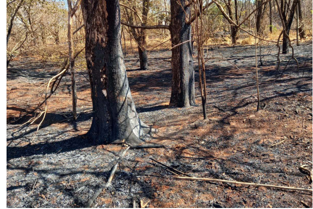
Área queimada atrás do cemitério, pertencente à Fazenda Baixadinha.

Na região a densa cortina de fumaça interditou rodovias, gerou engavetamentos e acidentes. Em Colina, o fogo consumiu uma área de vegetação atrás