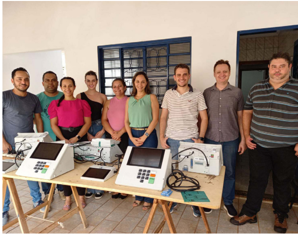
Equipe do Cartório prepara as urnas para receber os votos dos eleitores.

A cerimônia de carga e lacração dos equipamentos, nos últimos dias 24, 25 e 26, reuniu toda equipe do Cartório Eleitoral que ainda tem muito trabalho, como preparar as seções eleitorais dos três municípios abrangidos. Colina concentra o maior