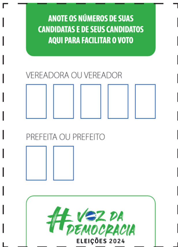
Modelo da “cola”, disponível pela Justiça Eleitoral, que pode ser recortado e preenchido para facilitar a votação.

A biometria não é obrigatória e o eleitor que já fez o cadastro será identificado com a digital. A pessoa que não fez a biometria poderá votar normalmente, desde que o título esteja regular. “Quem não votou por três turnos consecutivos e não justificou, o título será cancelado e não poderá votar, com ou sem biometria. O título só poderá ser regularizado a partir do dia 5 de novembro, data de início da reabertura do cadastro eleitoral”, explicou Campos Júnior que