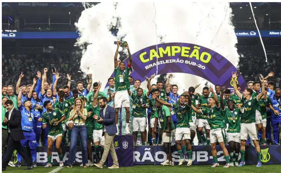
Jogadores recebem o título do Brasileirão Sub-20.

O Palmeiras conquistou na noite de segunda-feira, dia 30, o Campeonato Brasileiro Sub-20. Sob os olhares do técnico do time principal, Abel Ferreira e a presidente Leila Pereira, que estavam no Allianz, o time venceu o Cruzeiro por 3 a 0.