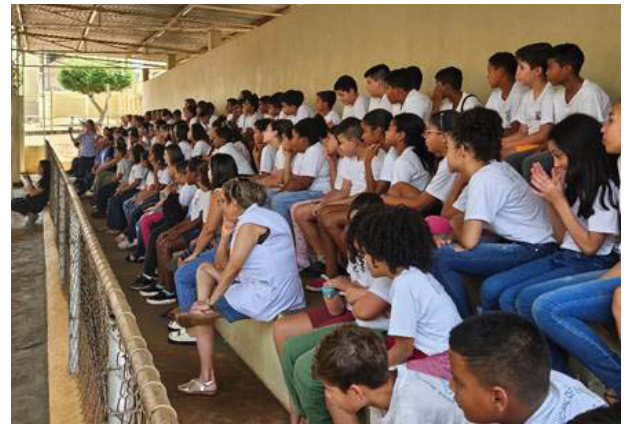
Em comemoração à Semana Nacional de Trânsito, a Concessionária Tebe levou a peça "Trânsito Animal" à EMEF "Cel. José Venâncio Dias". A encenação foi realizada no dia 24 nos dois períodos de aula para conscientização dos alunos para atitudes práticas e seguras no trânsito. O evento contou com apoio da Polícia Rodoviária e Artesp.