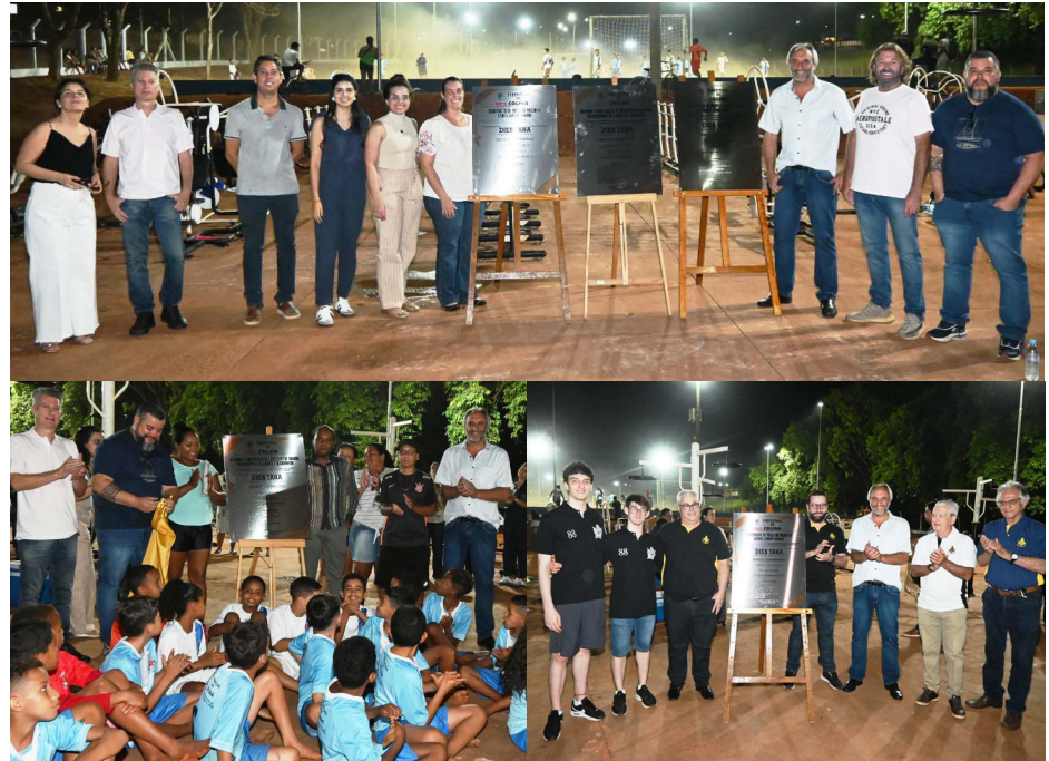
Autoridades, secretários, representantes de entidades e servidores junto às três placas das obras entregues no último dia 26.

O Prefeito Dieb Taha enfatizou a importância destas obras entregues à população de Colina, que proporcionam atividades esportivas, lazer, saúde física, entretenimento e cidadania. “Nossa Administração oferece todo o apoio ao Esporte no município, oferecendo através das Escolinhas, várias modalidades esportivas, estimulando a prática de esportes. Todas as modalidades esportivas são importantes para a população de Colina e por isso fazem parte das prioridades do nosso Governo. Além disso, essas obras proporcionam lazer e entretenimento”.