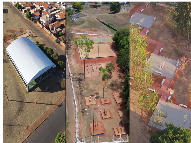
Vista aérea das três obras inauguradas na noite do último dia 26, que beneficiam moradores de vários bairros.