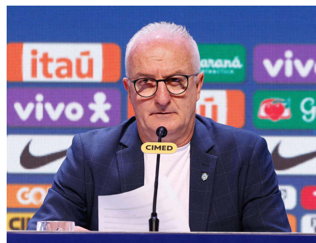
Dorival durante convocação da Seleção. Treinador está pressionado no cargo.

Na última sexta-feira, o técnico da Seleção Brasileira, Dorival Jr., anunciou a convocação para os jogos de outubro nas Eliminatórias para a Copa de 2026. As principais novidades na lista são o atacante Igor Jesus, do Botafogo, e o lateral Abner, do Lyon. Convocados em outras oportunidades, Raphinha, Martinelli, Bremer e Vanderson também retornam.