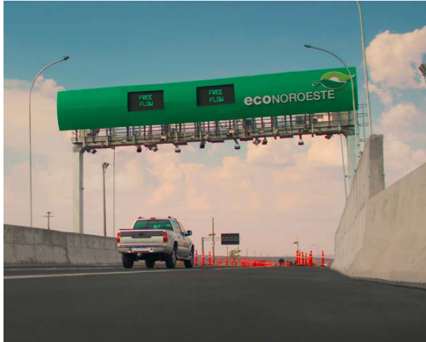
Pórtico da Econoroeste, o 2º do Estado, instalado na Rodovia Carlos Tonanni em Jaboticabal.

Entrou em operação na última sexta-feira, dia 1º, o segundo pórtico free flow da concessionária EcoNoroeste, instalado no Km 110 da Rodovia Carlos Tonanni (SP-333), em Jaboticabal. O pedágio eletrônico é também o 2º do Estado, o primeiro está em funcionamento na Rodovia Laurentino Mascari, em Itápolis, desde setembro.