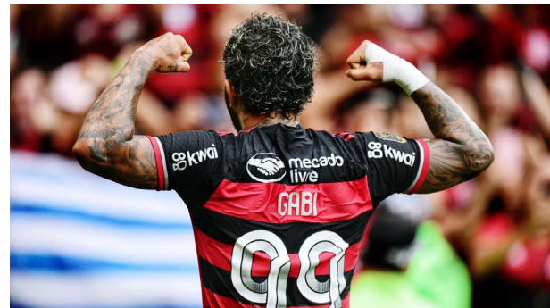
Teve gols dele! Gabigol faz sua tradicional comemoração na decisão da Copa do Brasil.

campeão da Copa do Brasil irá faturar mais de R$ 90 milhões, sendo R$ 73,5 milhões apenas na decisão. O vice-campeão, por sua vez, leva R$ 31,5 milhões.