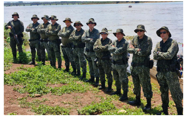
Uma das equipes da Polícia Ambiental que está fiscalizando os rios da região.

A captura, transporte e armazenamento de espécies nativas da bacia hidrográfica do Rio Paraná está proibida por quatro meses, até o final de fevereiro de 2025. Em "Operação Pré-Piracema", realizada na última semana, a Polícia Ambiental autuou pescadores de municípios vizinhos que pescavam em desacordo com a legislação