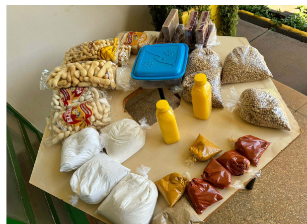
Alguns dos produtos comercializados na feira, que foi um sucesso.