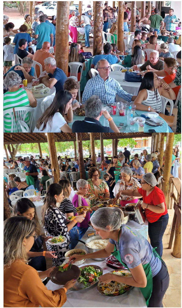
O público que participou do almoço da Associação Providência Santíssima no último domingo só foi elogios. Comida deliciosa regada com música ao vivo e ambiente agradável que tornaram o evento um sucesso. Que venha o próximo!