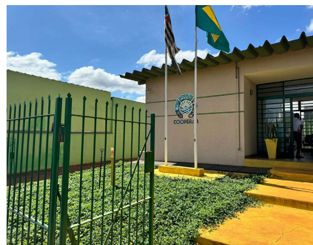
Fachada da Cooperaja que está em pleno funcionamento.

A iniciativa, além de promover a venda direta dos produtos, também incentiva a valorização da cultura e da economia de Jaborandi, proporcionando aos moradores uma experiência única de consumo local e sustentável.