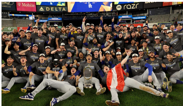
Los Angeles Dodgers comemora o título da World Series 2024.

Os Dodgers conquistaram seu segundo título