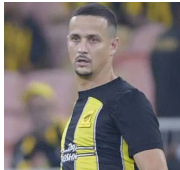
Aos 27 anos, Fefê retorna ao futebol europeu depois de passagem pelo mundo árabe.

especulado em algumas equipes do futebol brasileiro, como Corinthians e Palmeiras, mas optou por retornar ao futebol europeu.