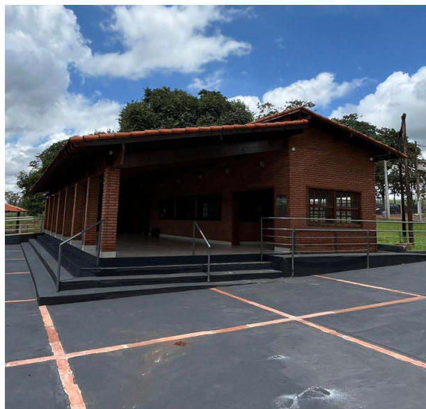
Está quase tudo pronto para a grande inauguração, que acontece na próxima semana.

Além da oferta de comidas e bebidas, o projeto conta com uma grande novidade: uma quadra de beach tennis, que já está em fase de construção. A modalidade esportiva, que vem ganhando popularidade em todo o país, será mais um atrativo para os visitantes e moradores que frequentam a praia, oferecendo uma opção de lazer