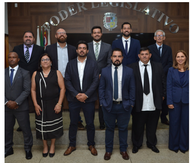
Os onze vereadores empossados no dia 1º de janeiro.

Agradeceu aos novos e antigos colegas pela colaboração e pelo apoio durante sua trajetória, reafirmando o compromisso de exercer seu mandato com dedicação e lealdade, respeitando a Constituição e as leis, comprometendo-se a trabalhar pelo progresso de Colina.