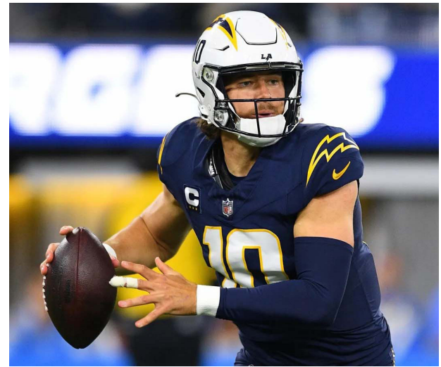
O quarterback Justin Herbert, do LA Chargers, que estará no Brasil em setembro.