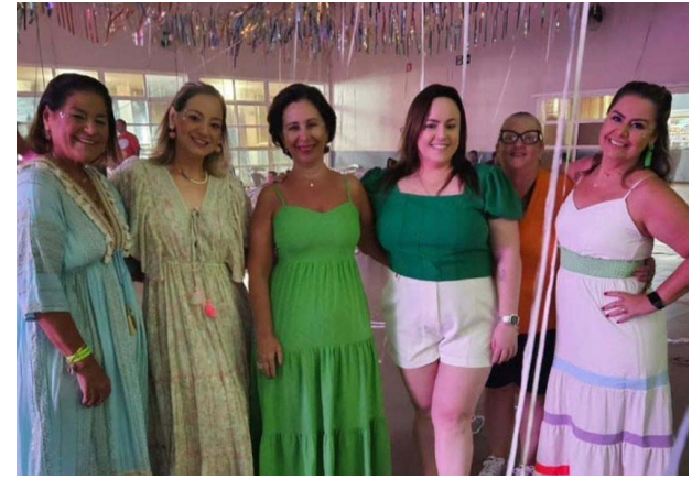
O carnaval já começou e elas já curtiram um dia especial juntas. Muitas risadas, boas músicas e passinhos foi o que rolou no salão do Grêmio de Colina neste sábado, dia 22.