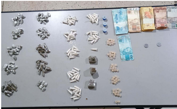
Drogas e dinheiro apreendidos pela PM com traficante na Vila Guarnieri.

Em patrulhamento pela Rua 7 da Vila Guarnieri na noite do dia 22, os PMs Neves e Coquelet depararam com um indivíduo de 37 anos carregando uma sacola abandonada antes da fuga e com grande volume nas vestes. O indiciado foi abordado e encontrado em seu poder e na sacola 52 pedras de crack (22g), 71 cápsulas de cocaína (125g), 98 invólucros de maconha (210g), 3 tubos de haxixe (8g) e R$ 2.331,00 em dinheiro. O autor foi apresentado no plantão policial e preso na cadeia.