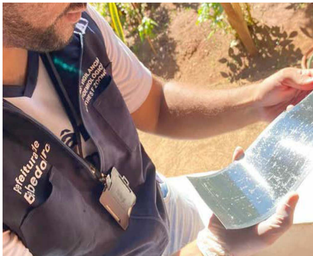
Dispositivo simula criadouro que atrai a fêmea do mosquito, transmissora da doença.

O método permite um planejamento antecipado e estratégico, identificando áreas de risco antes mesmo da confirmação de casos suspeitos. As armadilhas foram distribuídas em todos os setores da cidade, totalizando 144 unidades, estrategicamente