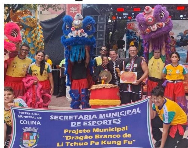
A equipe Dragão Branco de Dança do Leão Chinês se apresentou no evento.

Durante a feira, Colina apresentou seus atrativos turísticos e sua gastronomia, reforçando a identidade local e despertando o interesse do público visitante. O mascote Jango, símbolo da cultura equestre do município, foi um dos destaques do