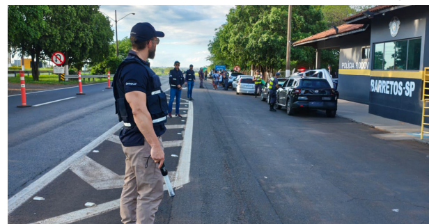
Agentes do Detran em operação na Rodovia Faria Lima, em frente à base da Polícia Rodoviária entre Colina/Barretos.

Em operação contra alcoolemia, promovida pelo Detran-SP com apoio da Polícia Militar no último dia 24, na Rodovia Faria Lima, o Detran fiscalizou 915 veículos. Deste total, 25 motoristas se recusaram a realizar o teste do bafômetro. Segundo o Código de Trânsito Brasileiro, a recusa é considerada infração gravíssima com aplicação de multa no valor de R$ 2.934,70. A fiscalização do Detran, realizada em 24 cidades do Estado na última semana, visa a redução e prevenção dos sinistros causados pelo consumo de bebida alcoólica combinado com direção.