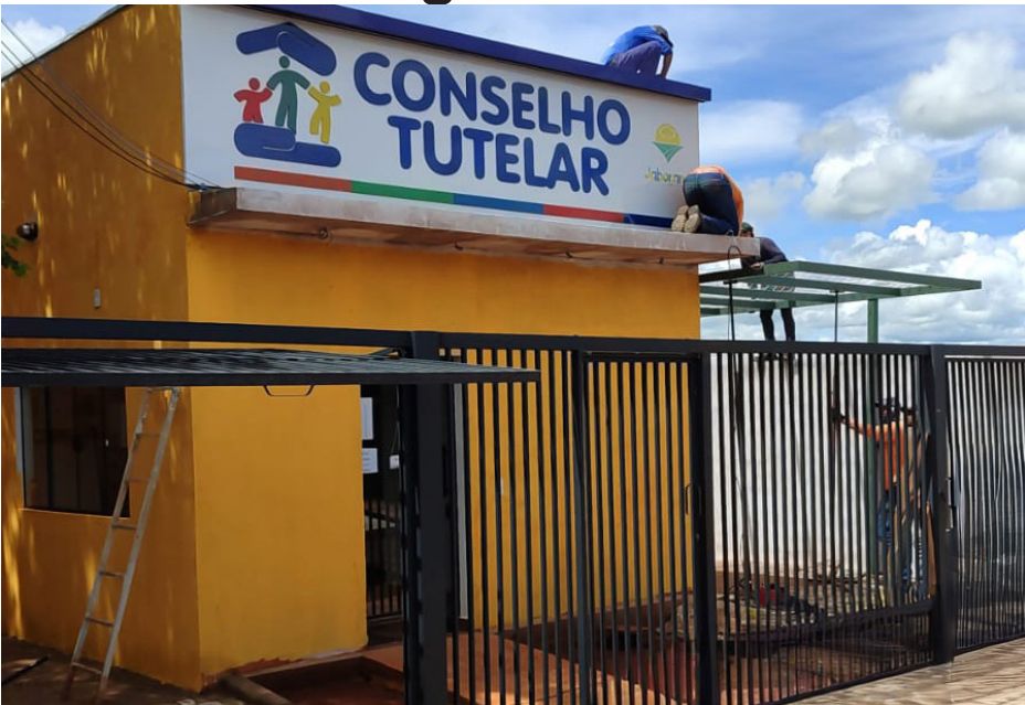
Novo prédio que vai abrigar as instalações do Conselho Tutelar.

O novo prédio do Conselho Tutelar está na fase final de pintura e será inaugurado nesta sexta-feira, dia 6. A obra foi realizada com recursos próprios do município, reforçando o compromisso da Administração Municipal com a proteção e garantia dos direitos de crianças e adolescentes. A construção da nova sede se fez necessária depois que o antigo prédio passou a abrigar a Casa do