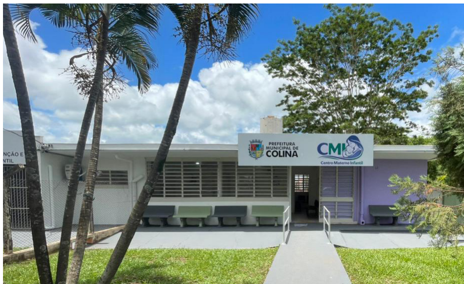
Prédio do novo serviço que já está em funcionamento.

Está em funcionamento desde a última segunda-feira, dia 2, o Centro Materno Infantil (CMI), um novo serviço de saúde oferecido à população na Av. Moacir Vizzotto nº 20, ao lado do CIADI e da Biblioteca.