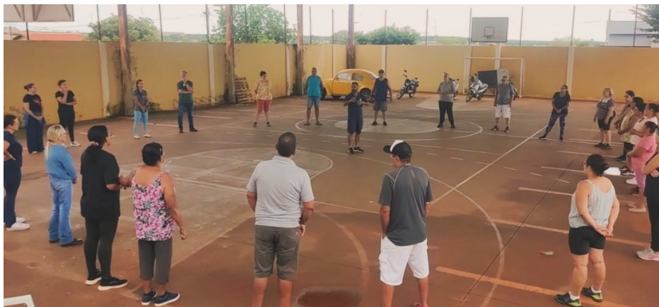
Atividade realizada durante uma das aulas.

Iniciativa une as secretarias de Saúde e Esportes para oferecer atividades físicas