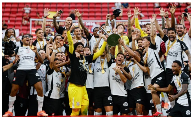
Jogadores do Corinthians erguem o troféu da Supercopa

A partida começou equilibrada, mas o Timão abriu o placar ainda no primeiro tempo. Após cobrança de escanteio, Gabriel Paulista subiu mais que a defesa rubro-negra para balançar as redes de Agustín Rossi aos 15 minutos.