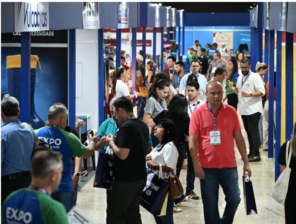
Milhares de profissionais de vários Estados participaram da Expo Plastripel, maior feira de varejo alimentício do interior paulista. O evento, totalmente gratuito, teve duração de três dias e terminou ontem, 21, no Berrantão em Barretos. Na sua 2ª edição a estrutura da feira foi duplicada, registrando crescimento no número de expositores e ampliação do público visitante.