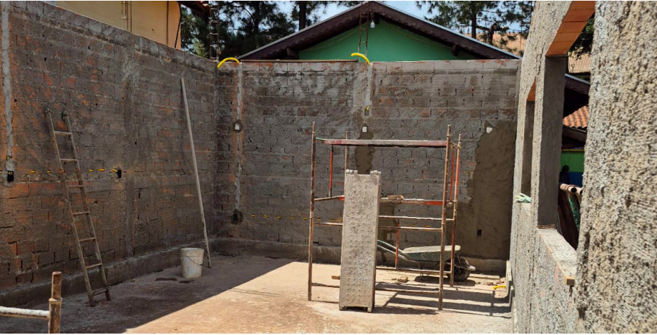
Sala de Atendimento Educacional Especializado em construção na Escola Olinto.

A educação inclusiva em Jaborandi está prestes a dar um salto histórico, já que as obras na Escola Olinto seguem a todo vapor, trazendo a tão sonhada construção da nova sala de Atendimento Educacional Especializado (A.E.E.), que foi pensada com todo carinho para acolher as crianças de inclusão e garantir que tenham o suporte necessário no ensino fundamental.