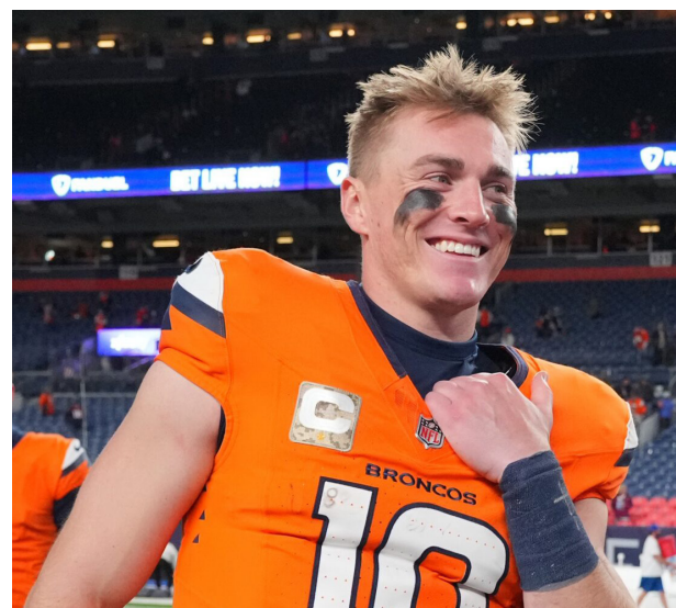
Destaque do Denver Broncos, Bo Nix, está fora da temporada com uma fratura no tornozelo.

Já os Patriots eliminaram o Houston Texans ao vencer por 28 a 16, num jogo marcado por