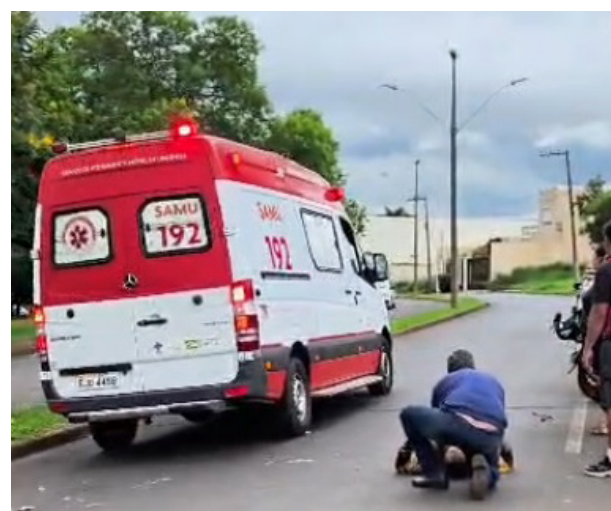
Ambulância do Samu chega ao local do acidente para socorrer a vítima, que está no meio da avenida.

Como era por volta das 18 horas, horário de pico em que as pessoas saem do trabalho e utilizam a avenida para se deslocar para os bairros do CDHU, Jardim Primavera e Cohabs, muitas pessoas pararam no local para prestar socorro, inclusive um servidor da ambulância que não estava de serviço, orientou a vítima para não