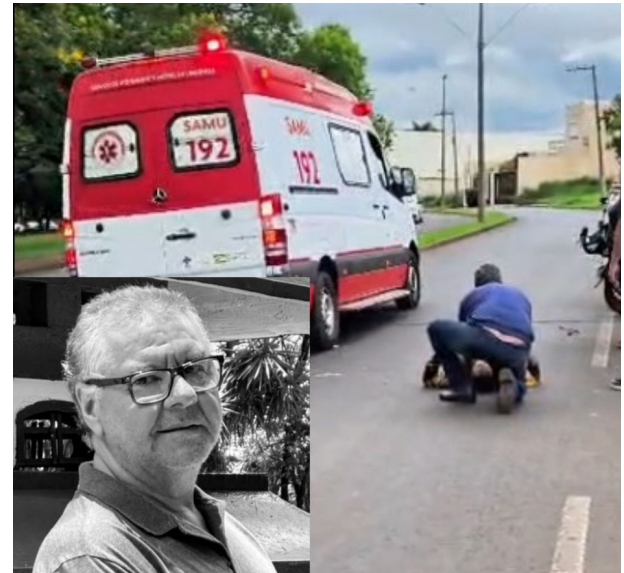
Momento em que a ambulância do Samu chega para socorrer a vítima.