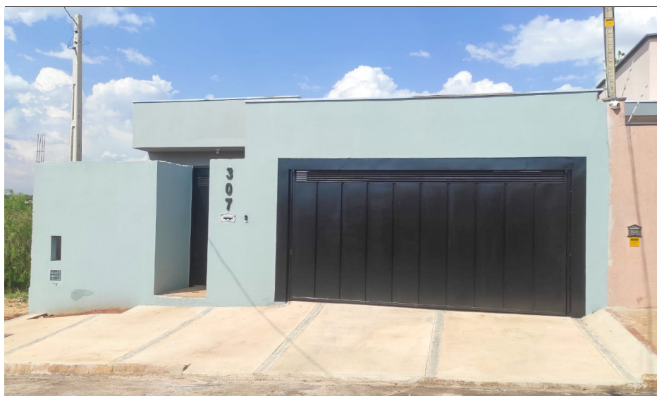
Fachada de uma das residências construídas pela empresa.