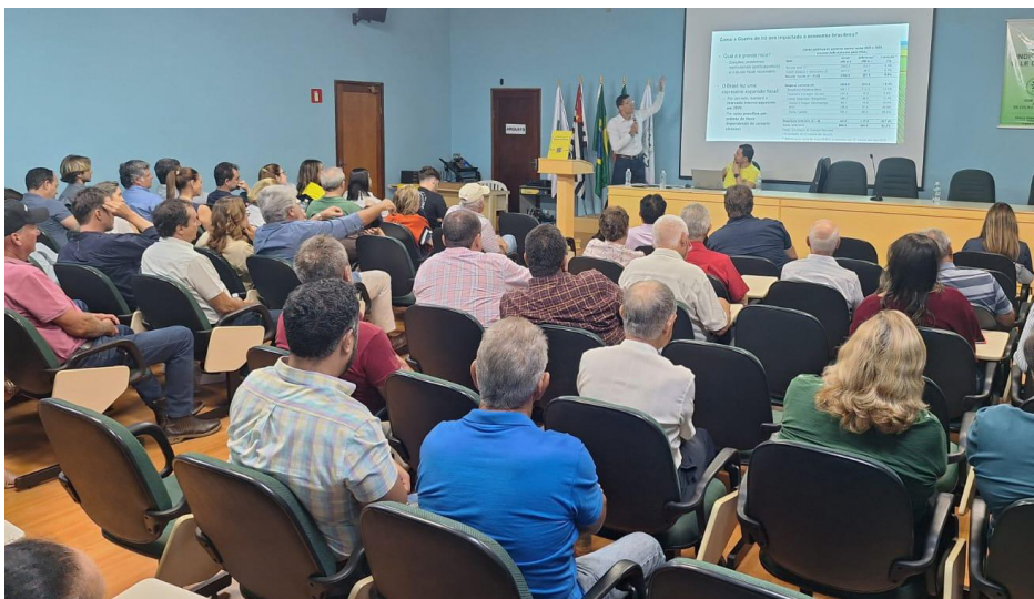
Palestra realizada no auditório do Sirvarig.

Os produtores rurais, empresários e parceiros do agronegócio participaram, na noite de sexta-feira, 24, do evento BB Pré-Agrishow 2026, que apresentou linhas de crédito do banco para o maior evento agrícola do país.