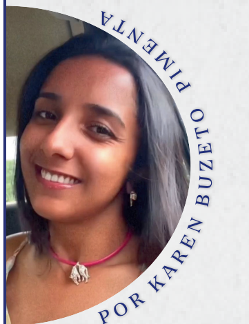
PIMENTA POR KAREN BUZETI

Flashes da 40ª Festa do Peão de Jaborandi DO JEITO QUE TEM QUE SER!