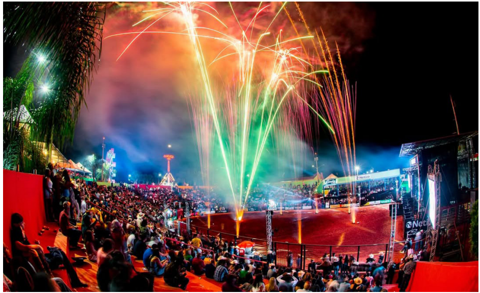
As arquibancadas ficaram lotadas todas as noites.

Essa é a sensação que o público de Jaborandi teve da 40ª edição da Festa do Peão que movimentou a cidade de quinta-feira a domingo, 23 a 26. O sucesso do evento, que superou todas as expectativas, foi aliar a forte tradição às atrações artísticas de renome com as emocionantes montarias em touros.