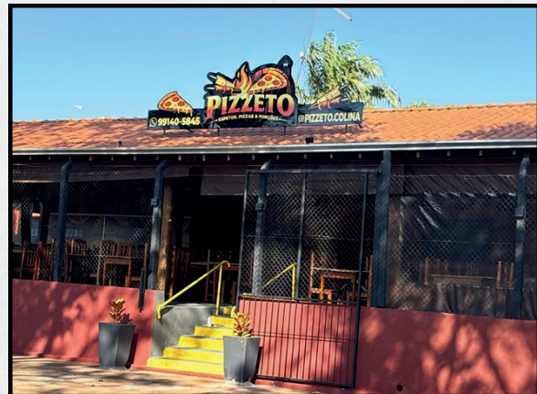
A noite desta ultima quarta-feira (03) marcou a inauguração da Pizzeto - Pizzaria, espetos e porções, em Colina. O novo espaço, localizado na Avenida Ângelo Martins Tristão, nº450, recebeu amigos, familiares e clientes para celebrar o início de uma nova trajetória, repleta de sabor, qualidade e bons momentos. Com um ambiente acolhedor e um cardápio variado, a Pizzeto já chegou conquistando o público e promete se tornar um dos novos pontos de encontro da cidade. Já é sucesso turma!