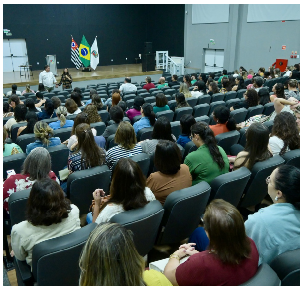
Profissionais da educação no evento que discutiu a prevenção da violência nas escolas.

A palestra “O sofrimento socioemocional na educação brasileira e o caminho real de prevenção da violência nas escolas” propôs uma reflexão pro-