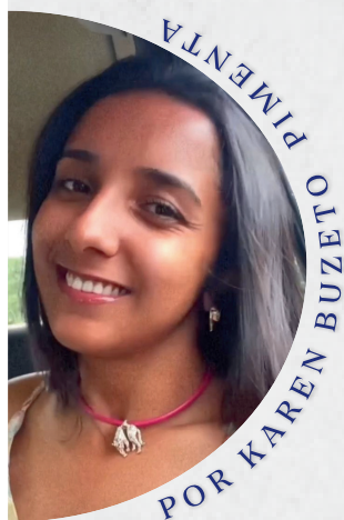
POR KAREN BUZETO PIMENTA