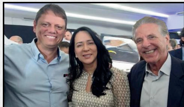
O prefeito de Jaborandi, Silvinho, participou da Caravana 3D, em Barretos, reforçando a busca por parcerias e oportunidades para o município. Na foto, ele está ao lado do governador do Estado de São Paulo, Tarcísio de Freitas, e da primeira-dama, Cristiane Freitas.