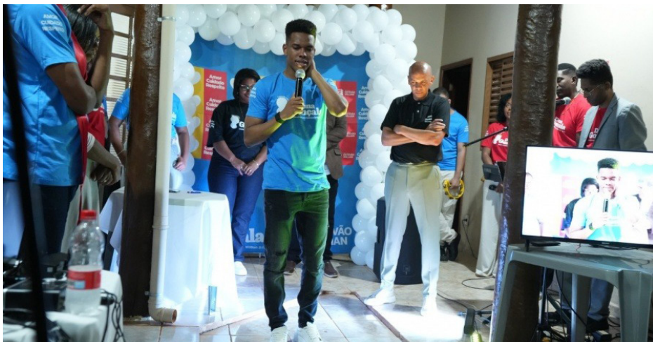
O jogador interagiu com os pacientes e acompanhantes na inauguração do espaço, que homenageia a avó do jogador.

O atacante Estêvão, destaque da Seleção Brasileira e jogador do Chelsea, esteve em Barretos, no último dia 26, para a inauguração da Casa de Apoio Dona Gonçalves, espaço criado para acolher acompanhantes e familiares de pacientes em tratamento no Hospital de Amor. O jogador esteve acompanhado