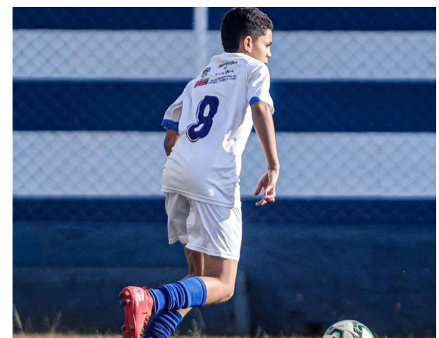
Atleta colinense em partida contra Mirassol

O maior espetáculo de gols da rodada ficou por conta dos garotos do Sub-