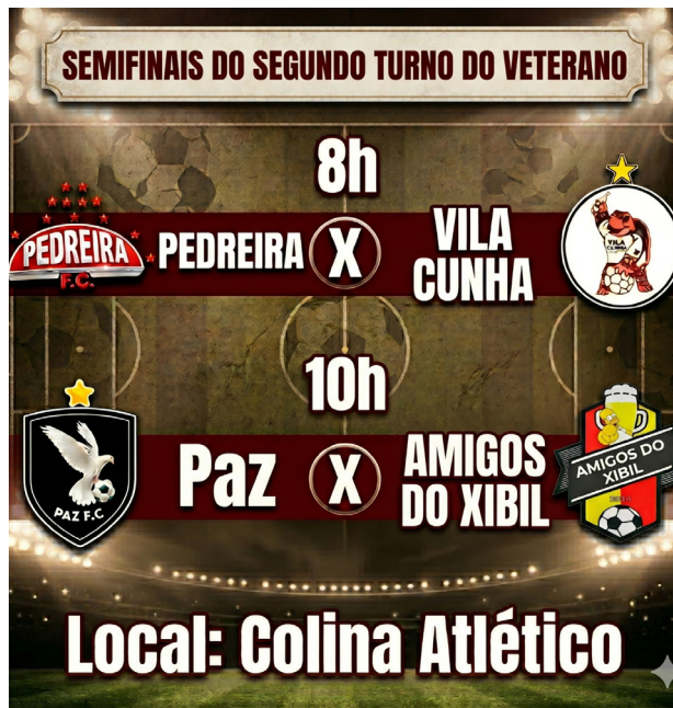
A tabela das semifinais.

O domingo de futebol promete parar a cidade, pois o Estádio Colina Atlético será o palco das duas semifinais do segundo turno da Copa Master, trazendo rivalidades acesas, sedes de vingança e a reedição da grande final do turno anterior. A rodada dupla começa logo cedo, às 8h, com o confronto eletrizante entre Pedreira e Vila Cunha, que coloca frente a frente o segundo contra o terceiro colocado da fase de classificação. A Pedreira entra em campo com sentimentos mistos, já que na última rodada precisava de apenas um empate para assegurar a liderança geral, mas acabou surpreendida e derrotada pelo já eliminado Cohab II. Apesar do tropeço que a derrubou para a segunda colocação, pouca coisa mudou na