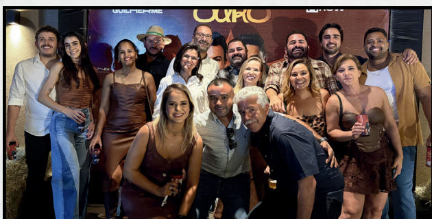
A animação da turma de Colina marcou presença na gravação do DVD Só o Ouro, da dupla Neto & Guilherme, realizada no dia 30, no Rancho do Sertanejeiro, em Barretos. Entre muita música, animação e encontros especiais, o grupo aproveitou cada momento de uma noite que promete ficar na memória.