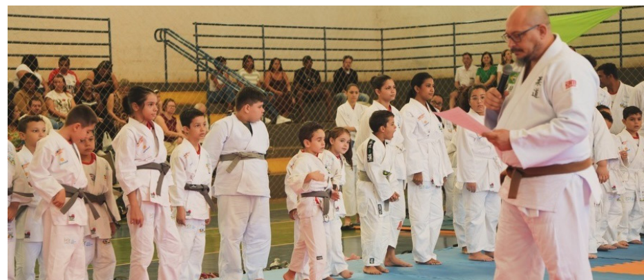
Evento reuniu centenas de atletas no Ginásio Municipal.