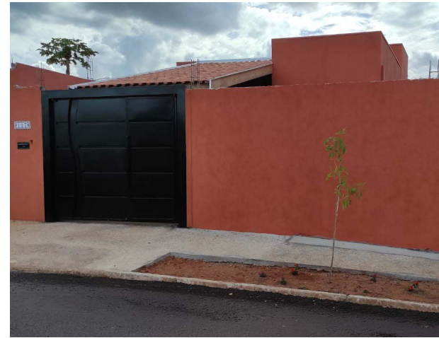
Projeto de casa entregue em 26/05 na cidade de Barretos.

A empresa atua acompanhando o cliente em todas as etapas do processo, desde a análise inicial do financiamento até a entrega do imóvel concluído. Esse modelo de trabalho facilita o acesso ao crédito imobiliário e garante maior tranquilidade para quem deseja construir, evitando imprevistos e assegurando conformidade com as exigências das instituições financeiras. Um dos diferenciais da