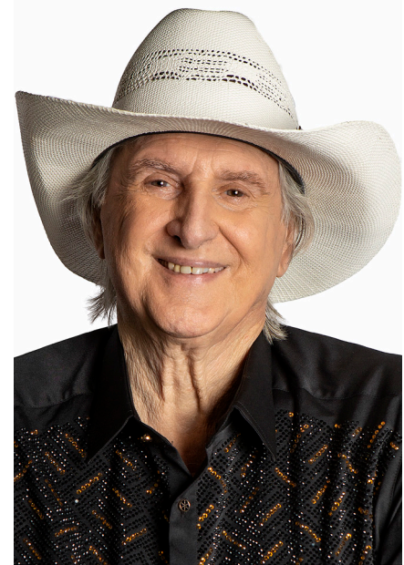
O cantor Sérgio Reis é a atração principal deste sábado, com apresentação gratuita, no 38º Arraijal da Alegria da Cidade de Maria, em Barretos. O tradicional evento se estende até domingo com shows, quermesse, almoço e o Concurso Rei e Rainha da Alegria. Vale a pena conferir e se divertir!