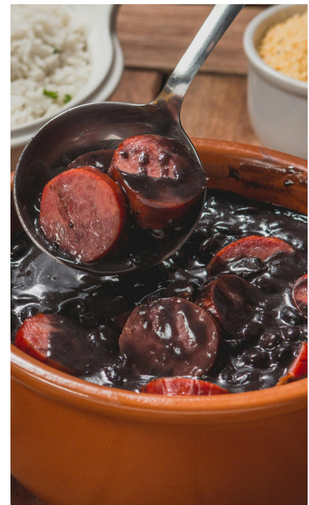
As adesões das feijoadas da Paróquia São José (14 de junho) e do Somos Solidários (20 de junho) estão à venda a R$ 50,00. Garanta já a sua porque as quantidades são limitadas.