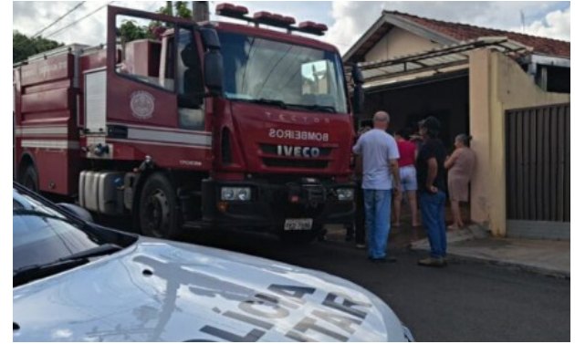
Viaturas do Corpo de Bombeiros e Polícia Militar em frente à residência onde a explosão ocorreu.

O incêndio começou logo após a troca de um botijão de 13 quilos, realizada por um funcionário da empresa de gás. A moradora