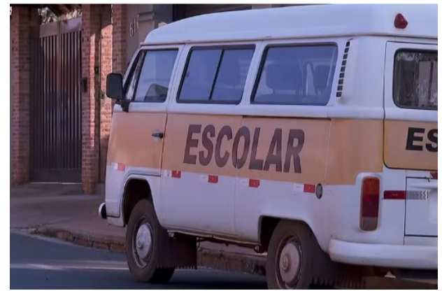
As vítimas eram deixadas por último na perua, onde os abusos aconteciam.

Alvo de denúncia oferecida pelo promotor Aluisio de Souza Marcelo, o réu recebeu, no último dia 20, a pena total de 135 anos, em regime fechado. Ele, que já estava preso desde outubro do ano passado quando os casos vieram à tona, não poderá recorrer em liberdade e perdeu a função pública que ocupava. A sentença atestou a prática de estupro e de repetidos estupros de vulneráveis contra seis meninas, incluindo uma com deficiência. De acordo com o Poder Judiciário, o ho-