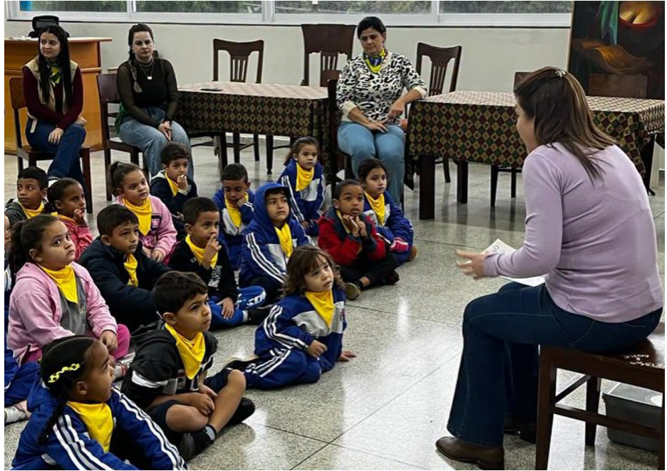
O Projeto Pequenos Leitores segue movimentando o aprendizado dos alunos da pré-escola e recreação das EMEl's da Rede Municipal de Ensino, que têm participado de muitas atividades no Centro Integrado de Educação e Cultura "Hugo Martins Tristão".