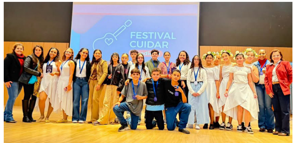
A delegação colinense que participou do evento regional.

A ETAM São Francisco de Assis foi destaque na edição 2026 do Festival Cuidar na última quinta-feira, 25, na Faculdade de Medicina Dr. Paulo Prata, em Barretos. A unidade representou o município e conquistou excelentes resultados, chegando à final em três categorias.