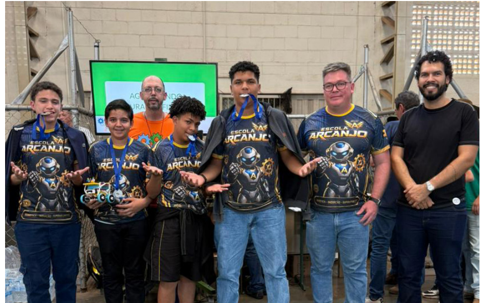
Equipe da Escola Arcanjo que disputou a eliminatória da Olimpíada Brasileira de Robótica.

A equipe da Escola Arcanjo conquistou medalha de prata na primeira eliminatória da Olimpíada Brasileira de Robótica, que funciona como uma fase classificatória. O resultado representa uma grande chance de Jaborandi ser convocada para a etapa estadual em São Paulo.