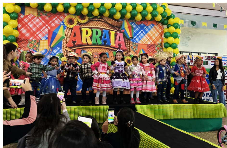
O clima junino promoveu a integração dos alunos e das famílias com a comunidade escolar.

As escolas de Jaborandi levaram muita alegria e diversão para os alunos e as famílias com a realização das festas juninas, que também trouxeram