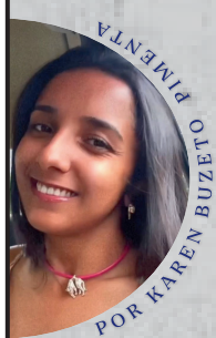
ANUNCIE AQUI! POR KAREN BUZETE OLEFINSKA