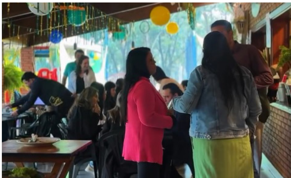
Confraternização no Bar do Lago que encerrou curso que a prefeitura ganhou do Sebrae-SP.

O curso “Seja uma Liderança Inspiradora”, que a Prefeitura ganhou do Sebrae-SP por ser uma “Cidade Empreendedora”, foi encerrado no último dia 24, no Bar do Lago, com uma confraternização entre os trinta servidores públicos participantes.