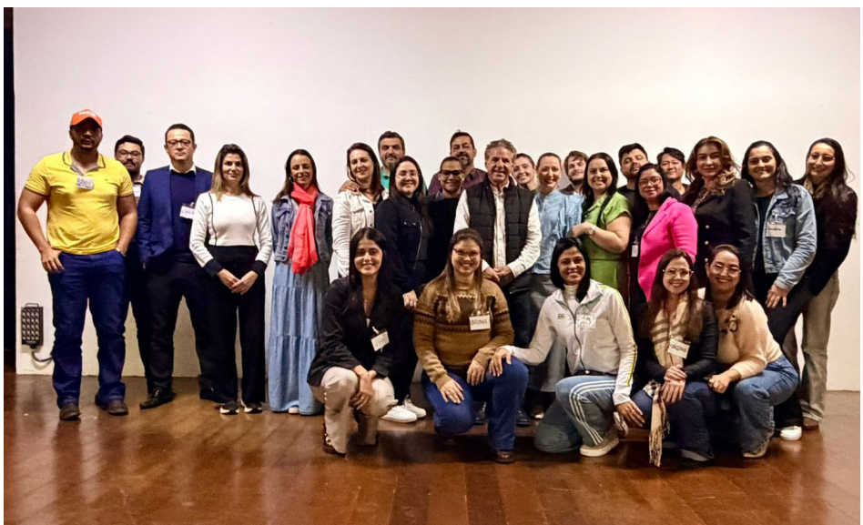
Os servidores que concluíram o curso juntamente com o prefeito.

O prefeito destacou que o Bar do Lago é um espaço preparado para receber empresas, grupos e eventos, além de um espaço de